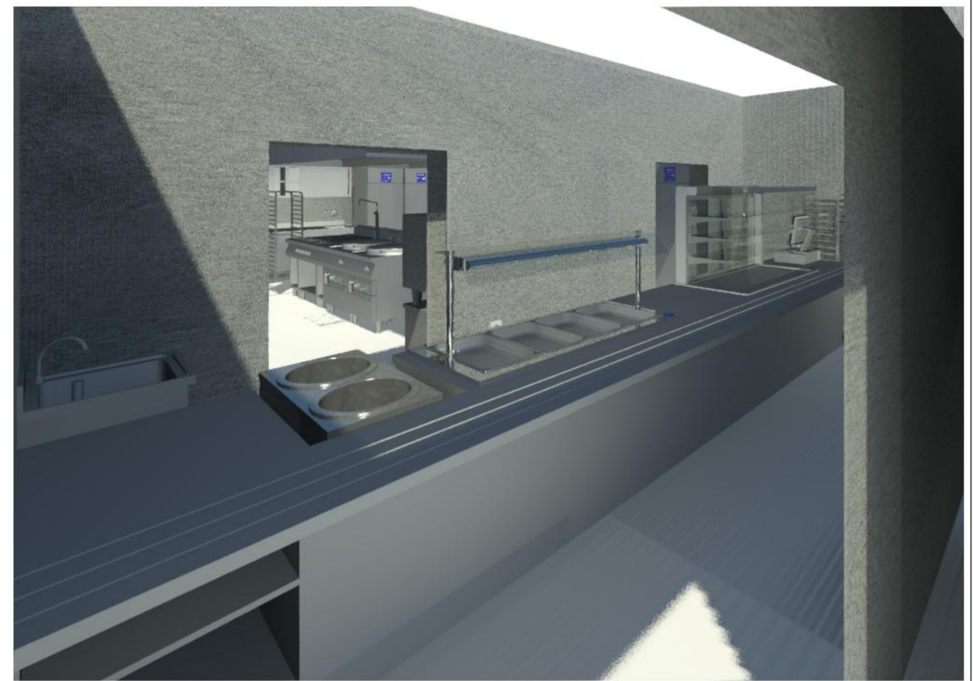
Pogled na izdajno linijo