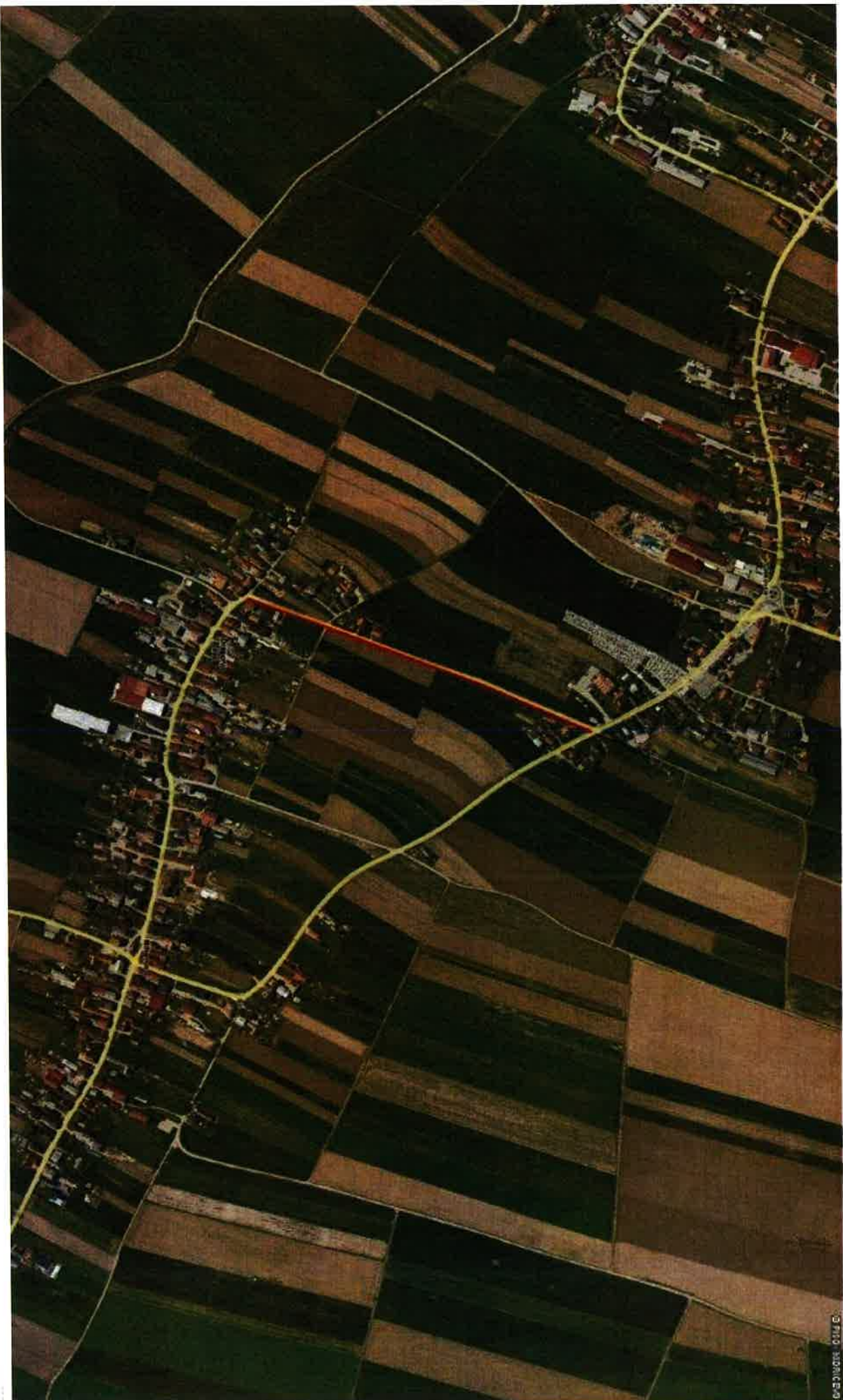
3. SKLOP MODERNIZACIJA JAVNE POTI JP 666 121 V DRAGONJCI VASI DOLŽINA 600 m