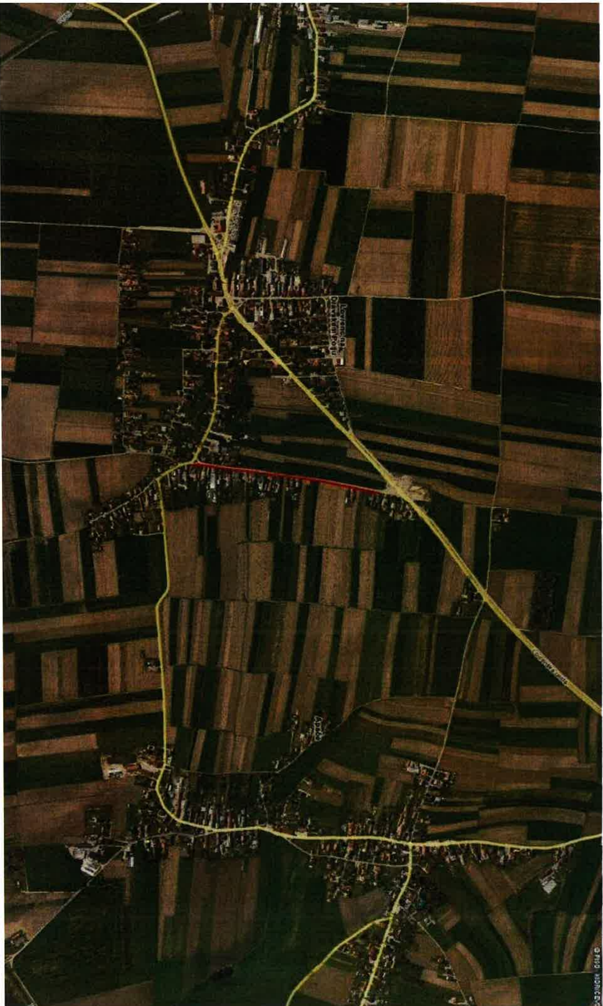
2. SKLOP MODERNIZACIJA JAVNE POTI JP 666 091, ODSEK KAPELA-R2 DOLŽINA 580 m