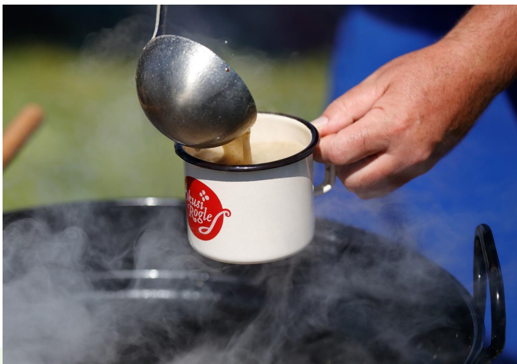
Slika 4: Praznik Pohorskega lonca_Okusi Rogle