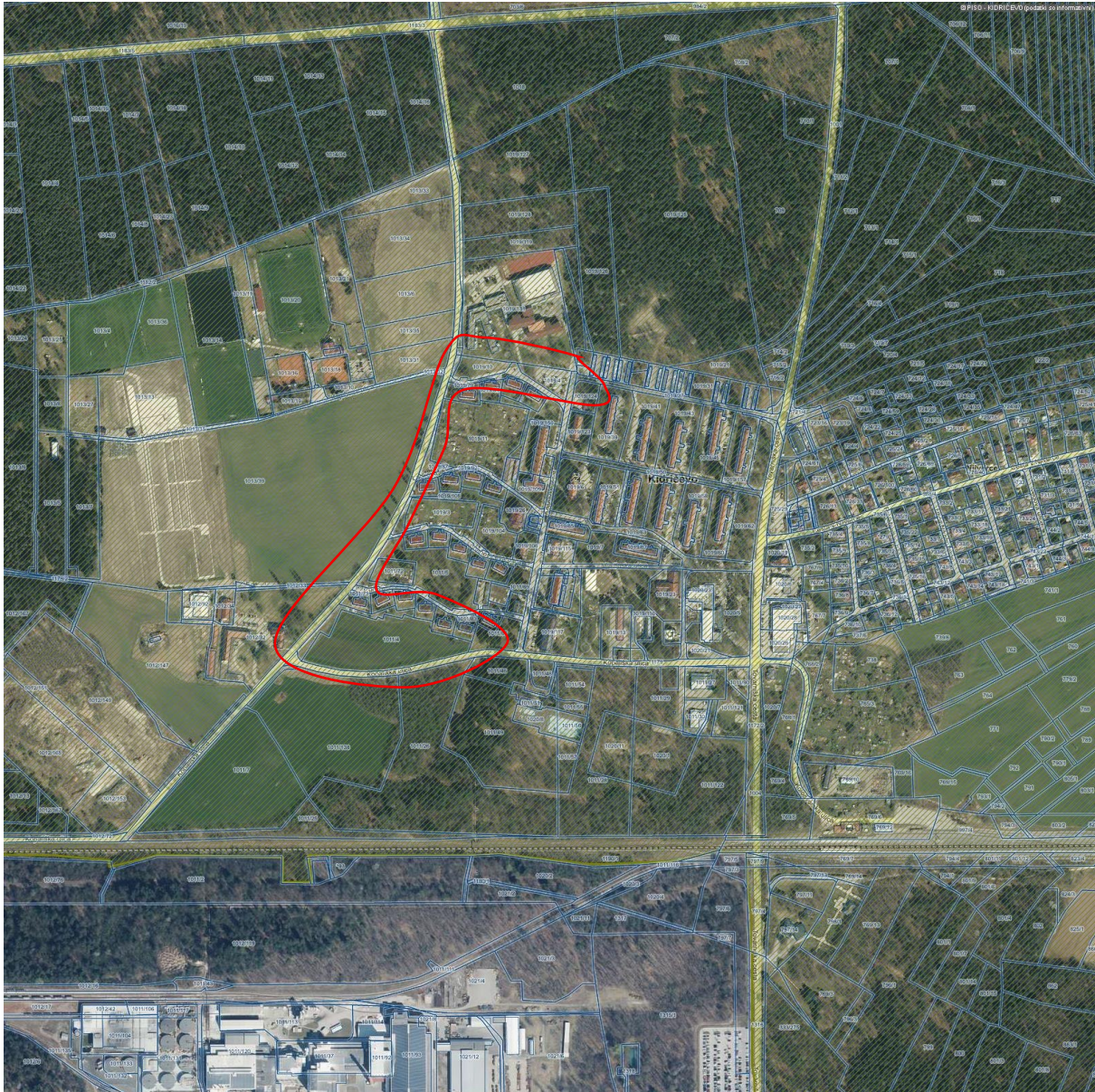
Prikaz varovanih območij varstva narave

Območje lokacijske preveritve se nahaja znotraj varovanih območij varstva narave (ekološko pomembnih območij) – EPO – 42500 Dravsko polje.