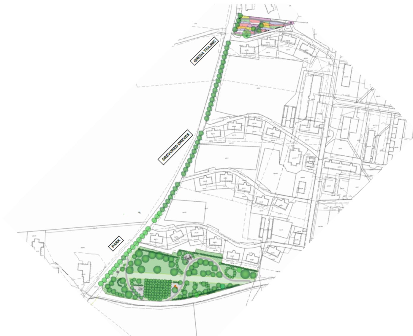
Slika 2: Pregledna situacija predvidenih ureditev (vir: PZI načrt krajinske arhitekture Zeleno Kidričevo – park, drevored, greda trajnic, št. načrta 02 – 25, datum marec 2025, izdelovalec KRAJINSKA ARHITEKTURA, Boštjan VAUDA s.p.)