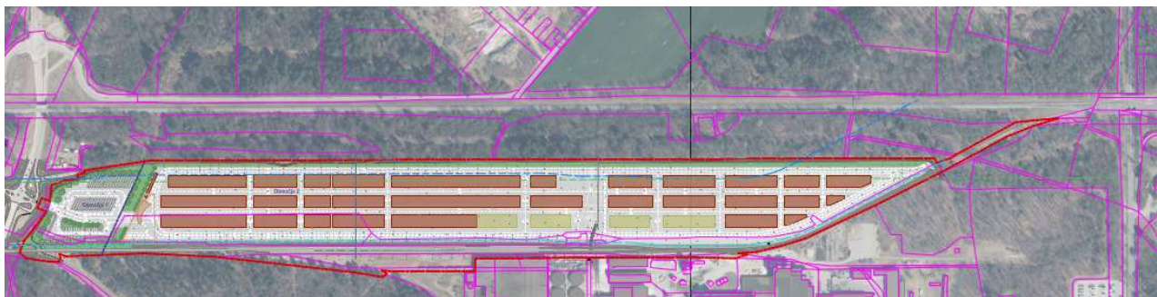
Slika 13: Zasnova predmetnega območja