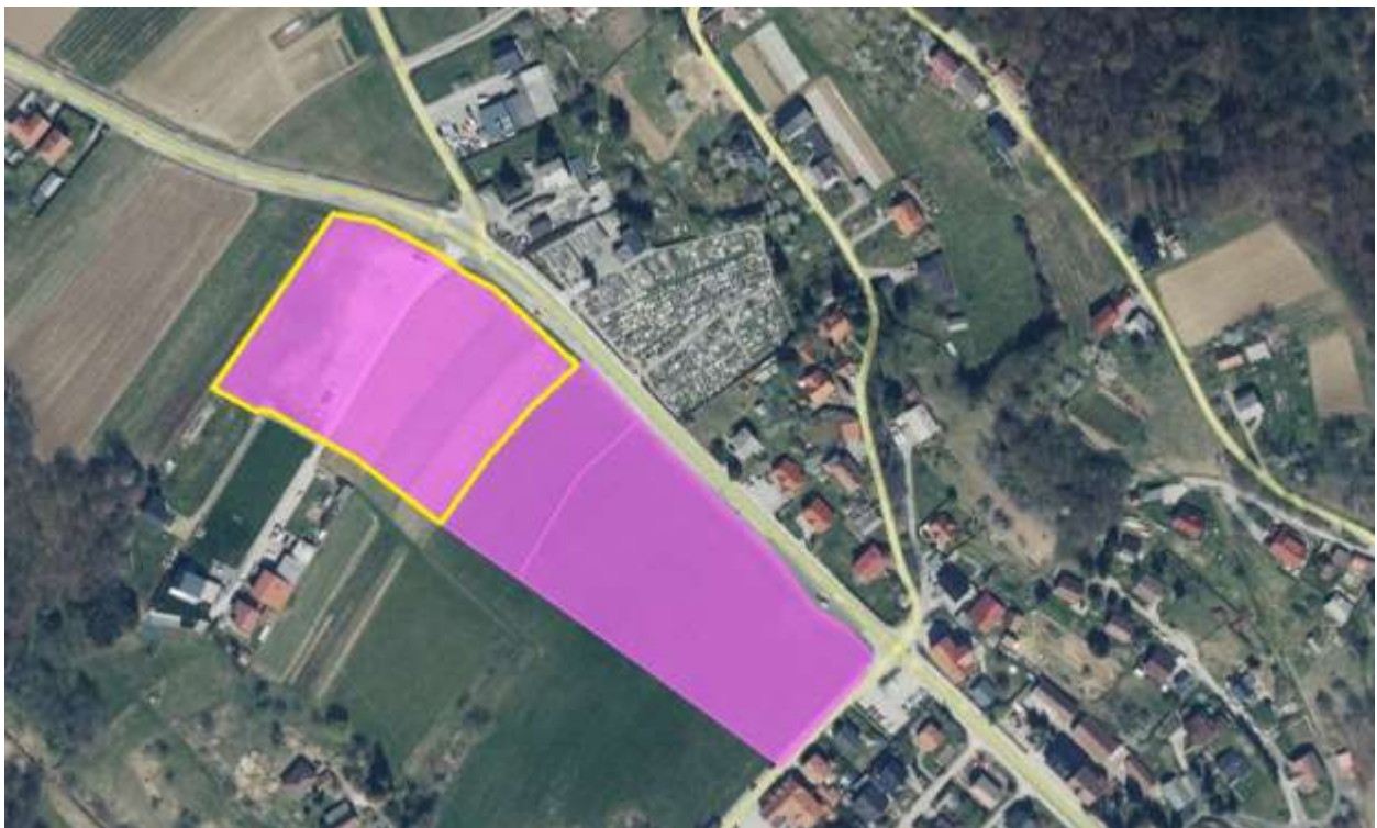
Slika 2: Območje OPPN po OPN

Območje OPPN zajema prostorski enoti D-14 in D-6, ki sta zaključeni celoti, s podrobnejšo namensko rabo PO, ZK, na katerih je predvidena izdelava OPPNp.