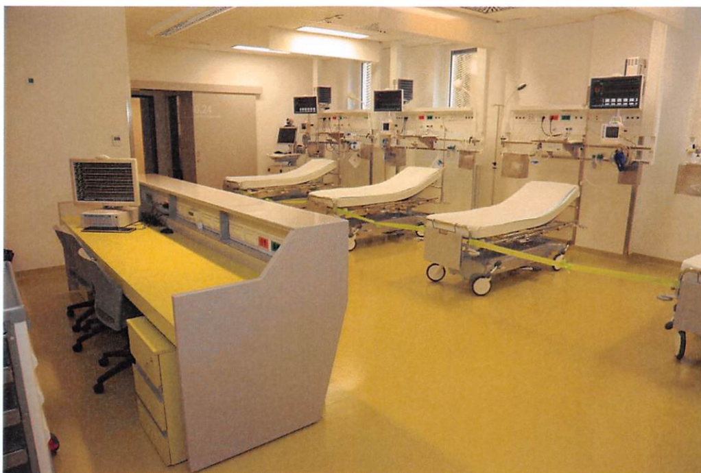
SB Brežice, urgentni center,