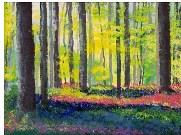
ŽARKI POMLADI, akril 40X30 cm, januar 2021