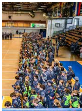
Gasilska zveza Žalec