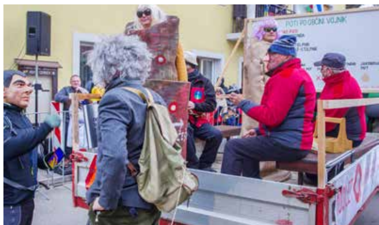
Markacisti planinskih poti iz Planinskega društva Vojnik