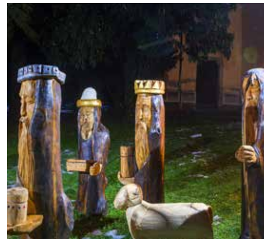
Jasllice izdelal Zvone Cirkulan, Celje