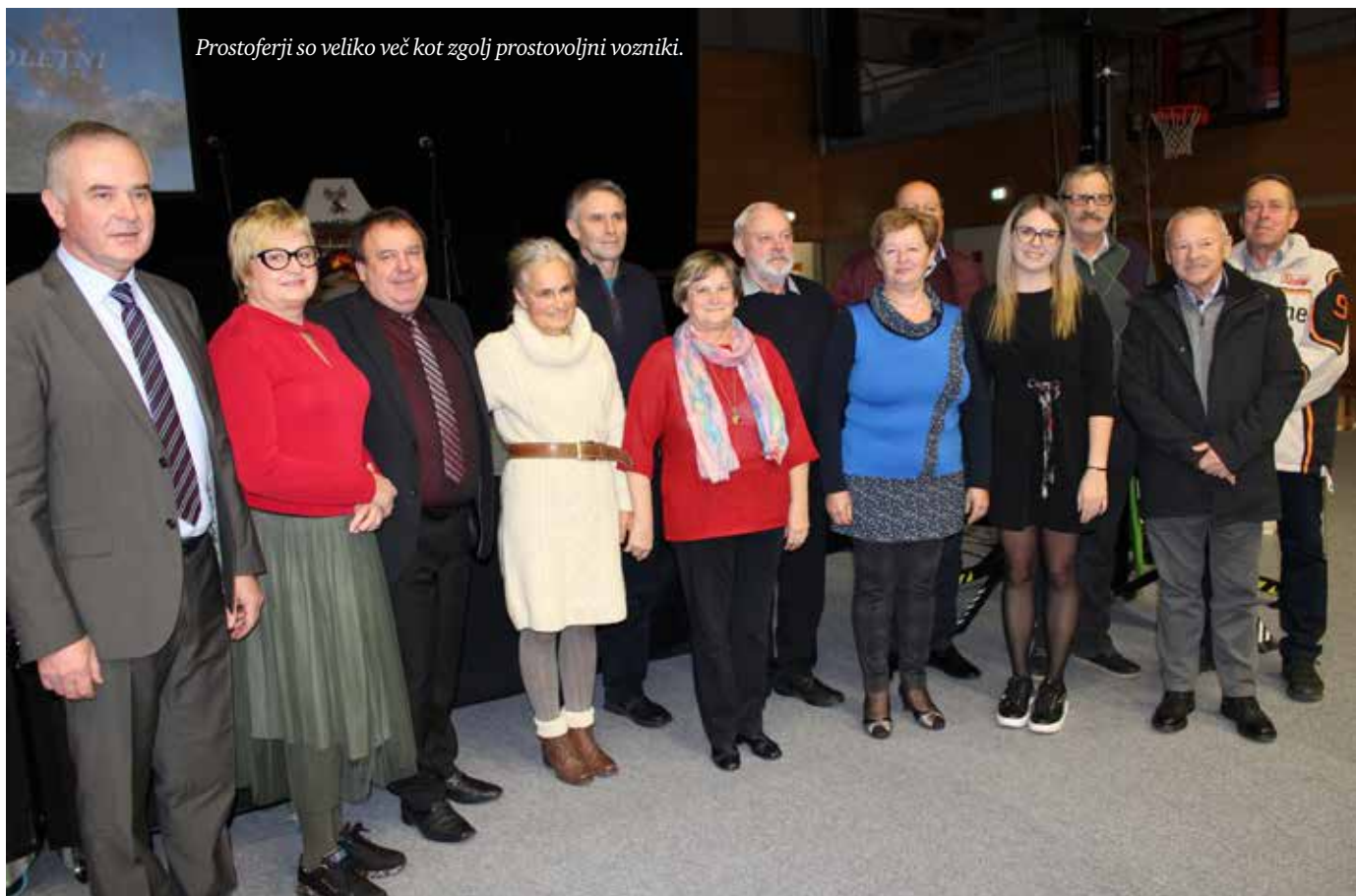
Prostoferji so veliko več kot zgolj prostovoljni vozniki.

Prostovoljni šofer je lahko vsak, ki ima veljavno vozniško dovoljenje in je v svojem prostem času pripravljen pomagati tistim, ki prevoze potrebujejo. Vendar pa so prostoferji v resnici veliko več kot zgolj prostovoljni vozniki – svojim sopotnikom nesebično pomagajo tudi, ko ti izstopijo iz avta: pri