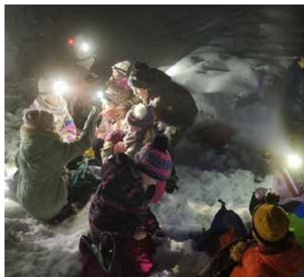
Igra svetlobe v tem delu dneva daje svoj čar.

V torek, 13. decembra 2022, smo pripravili Čarobno popoldne z bazarjem, kjer so naše stojnice zaživele v vsej svoji ponudbi s paletto izdelkov. Pripravili so jih strokovni delavci s pomočjo tudi nekaterih staršev. Družine so z izdelki v svoje domove ponesele otroško toplino, s prispevkom zanje pa se je oplemenitil vrtčevski sklad, ki skrbi za obogatitveni program v Vrtcu Mavrica Vojnik.