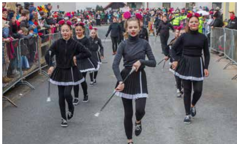
Mažoretke iz Radeč