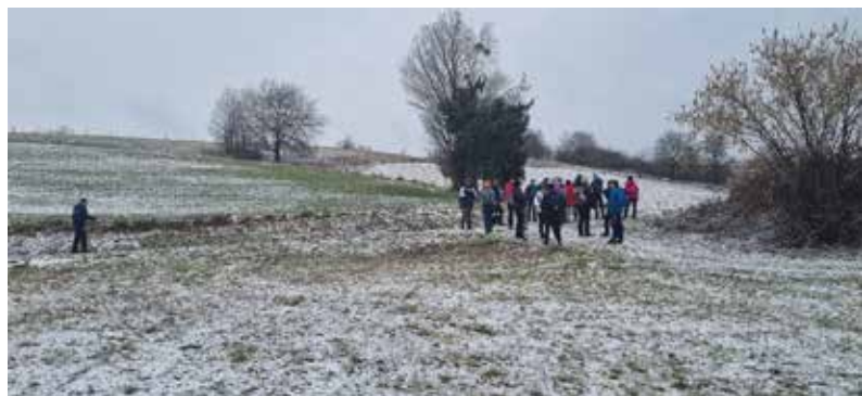
Na poti so nas spremljale nežne snežinke

Več o naših aktivnostih si lahko ogledate na naši FB strani, kjer vas čakajo tudi slike z raznih pohodov.