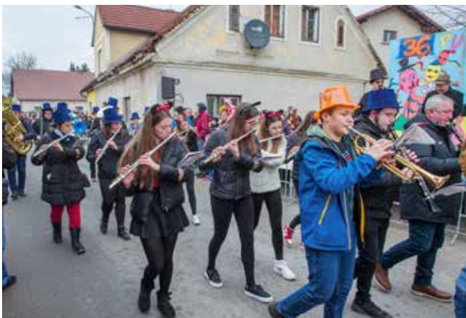
Godba na pihala KUD Nova Cerkev