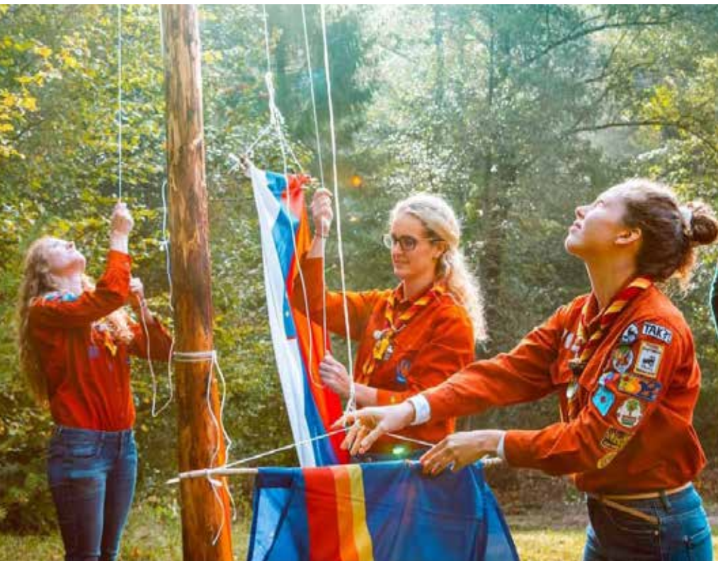
Najpristnejša izkušnja prostovoljstva so poletni tabori.

»Poskušajte pustiti ta svet za spoznanje boljši, kot ste ga prejeli, in ko boste odšli, boste odšli srečni in z občutkom, da niste zapravljali časa.« – zadnje sporočilo Badena Powella, ustanovitelja skavtov.