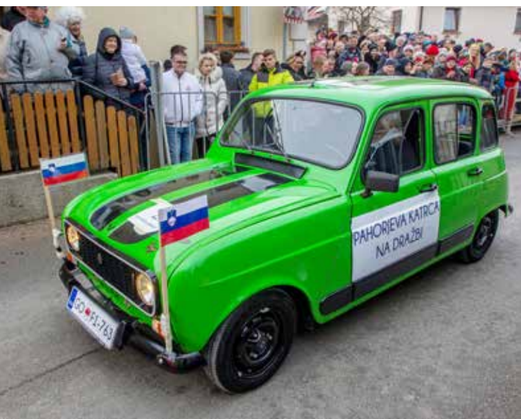
Pahorjeva katrica na dražbi, Renato Kumer