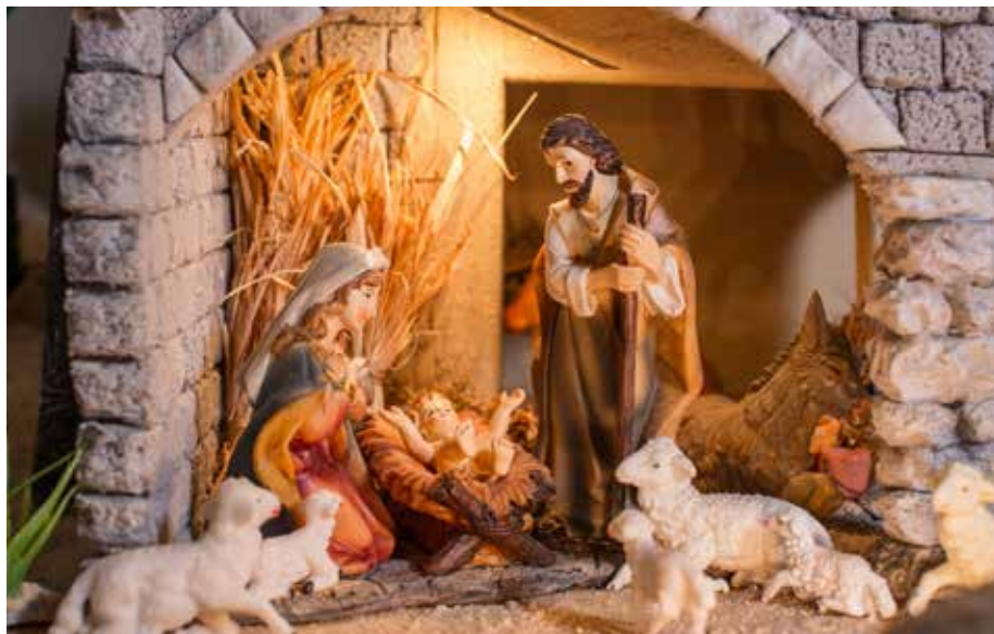
Jaslice izdelala družina Skaza, Frankolovo