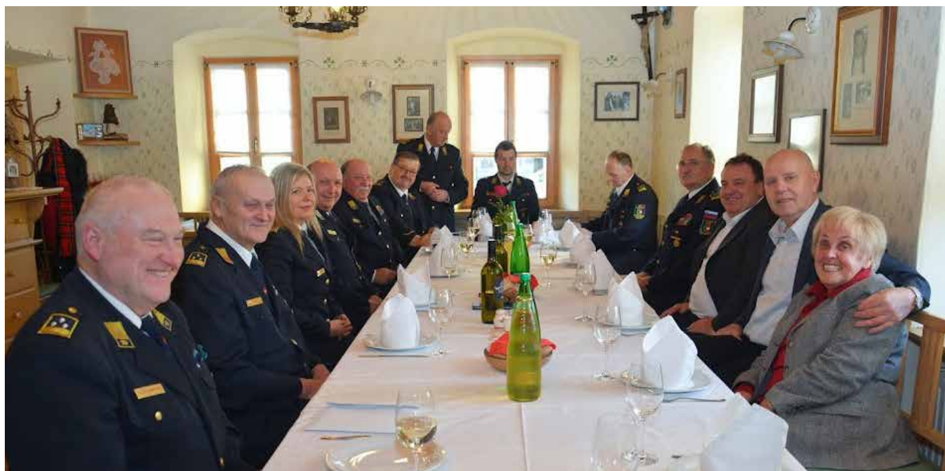
Zadovoljni podpisniki Načrta razvoja GZ Vojnik – Dobrna