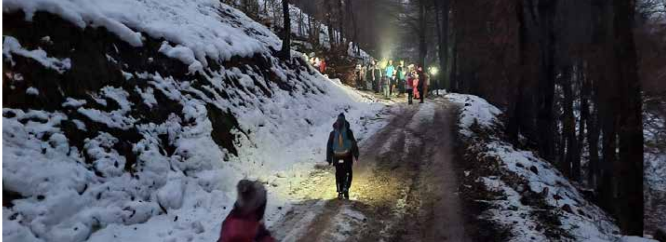
Mnogi izmed nas smo gozd prvič obiskali ponoči