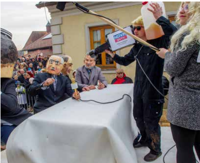
Odločanje o lokaciji Muzeja osamosvojitve s krajanj Novak in Straže