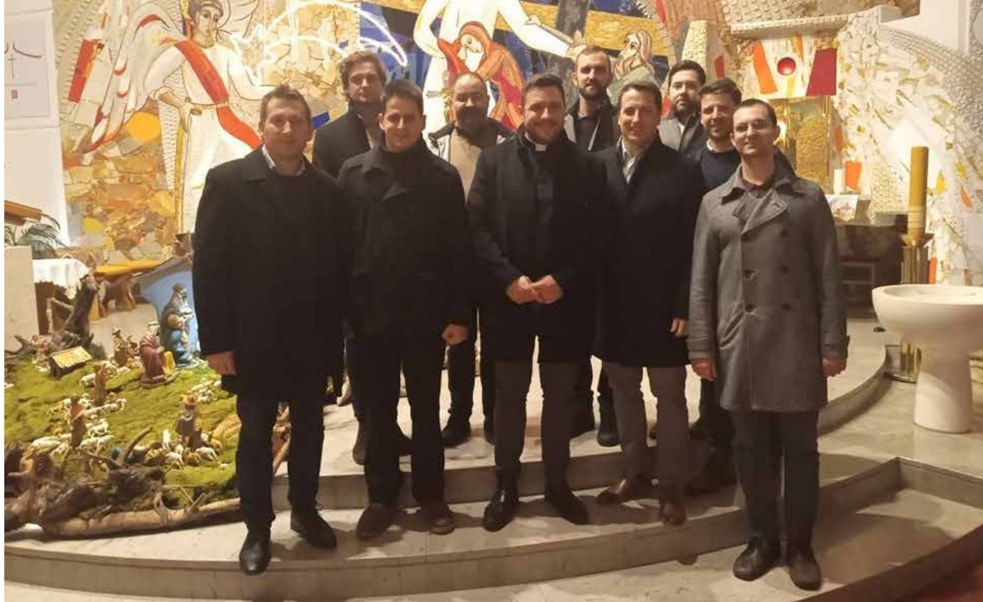
Oktet In spiritu v farni cerkvi svetega Mihaela v Grosupljem