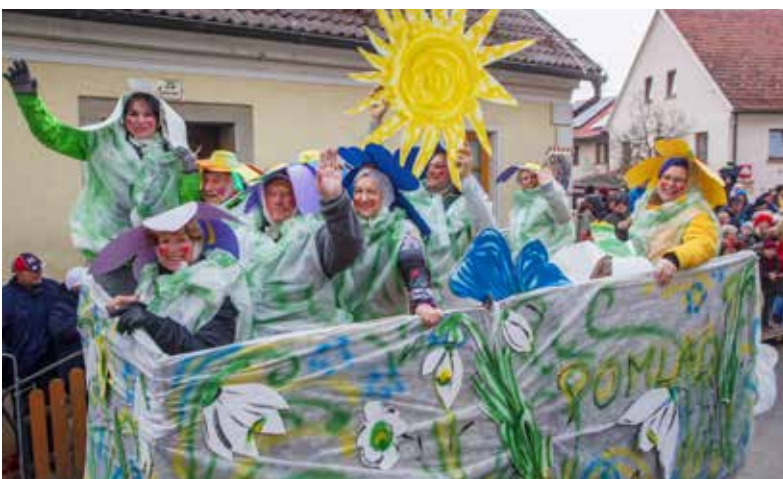
SeneCura je prinesla pomlad