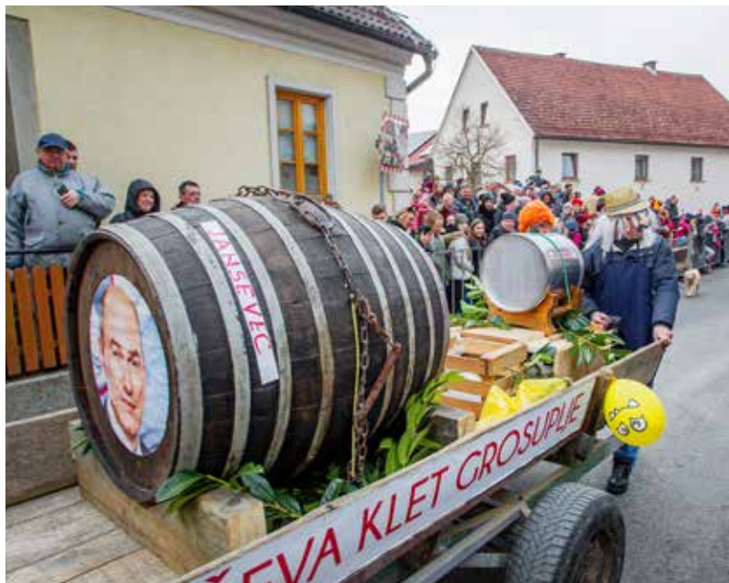
»Janšev«, ekipa KUD Nova Cerkev