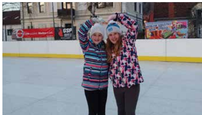
Zabavali so se veliki in mali

Picerija Limbo, Pizzeria in avtopralnica Mc, Peor, d. o. o., Fivia, d. o. o., Mizarstvo Podgoršek, d. o. o., Zobozdravstveni center Diamant, MIK, d. o. o., GSP, d. o. o., A-VIP, d. o. o., Resolucija – Urška Krajnc, s.p. in Wepik, d. o. o..