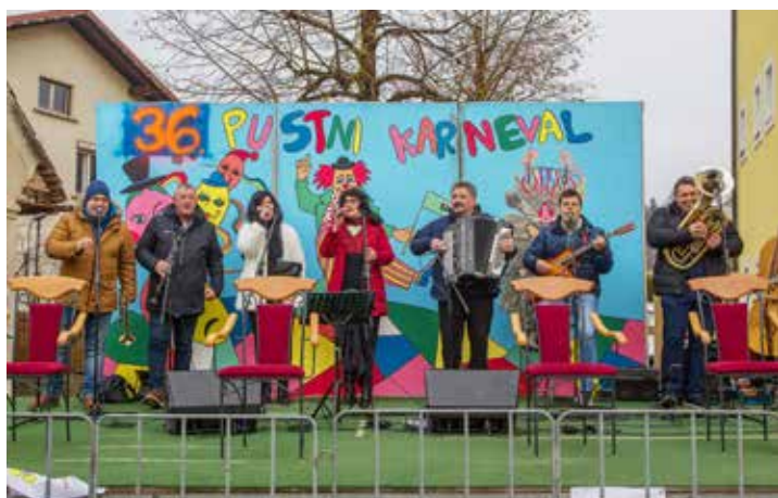
Uradni karnevalski ansambel Vagabundi