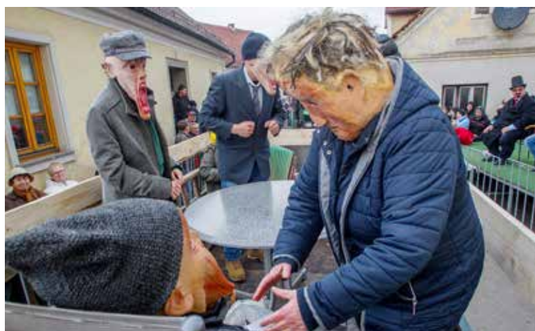
Boj za oblast v KS Frankolovo in Društvo Dobra volja iz Pristave