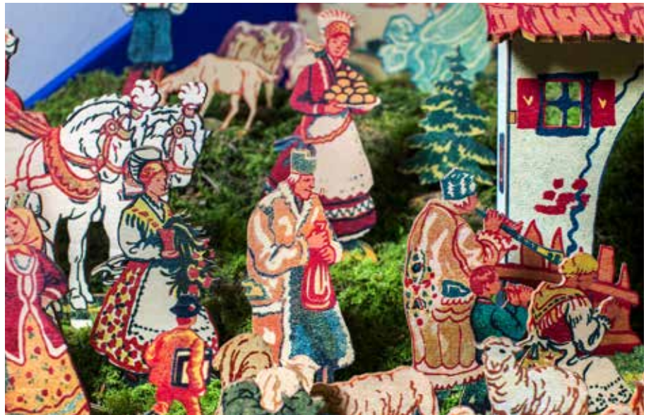
Gasparijeve jaslice izdelal in postavil Robert Kužnik, Cerknica