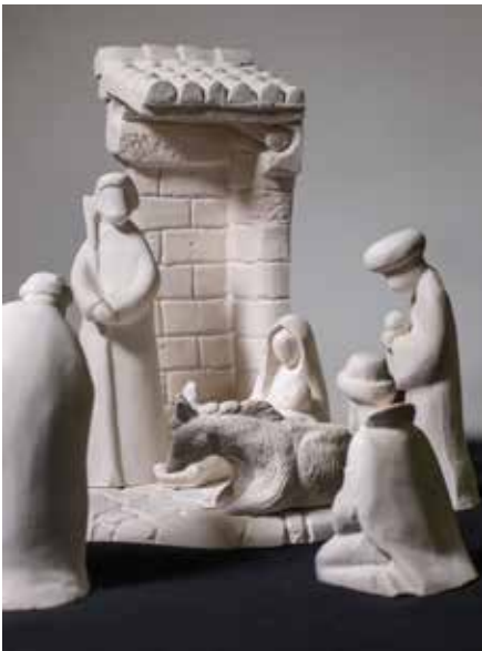
Jaslice izdelala Petra Odlazek, Celje