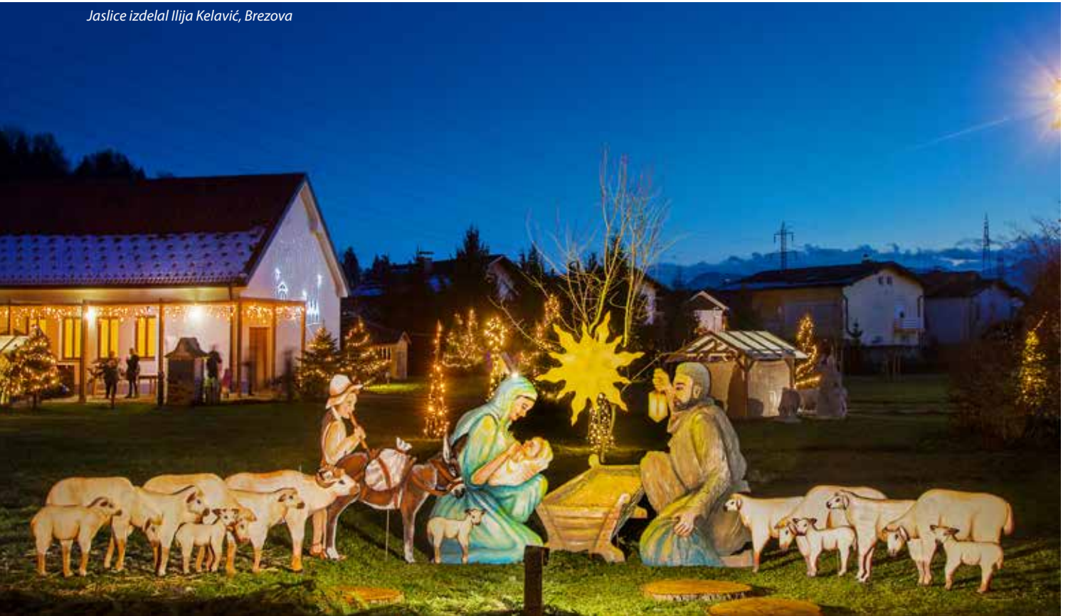
Jaslice izdelal Ilija Kelavič, Brezova