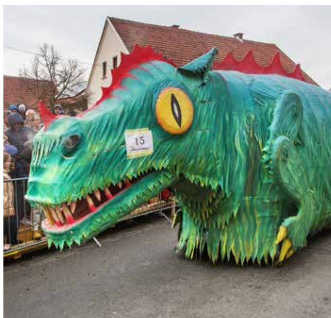
Karnevalski zmaj s posadko PGD Nova Cerkev