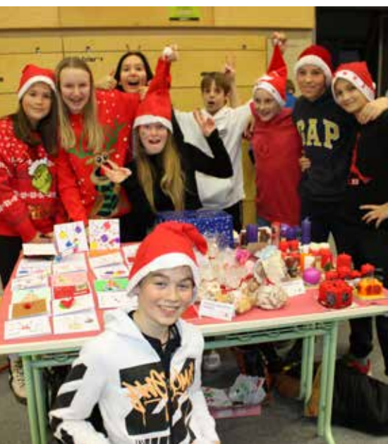
Veselo vzdušje na dobrodelnem bazarju

Šolsko delo se prepleta z dejavnostmi, učenje v razredu, z izkustvenim učenjem izven njega, medgeneracijsko sodelovanje in vzgoja otrok na vseh področjih, kjer smo prisotni. Opisane dejavnosti so le del življenja in dela na naši šoli.