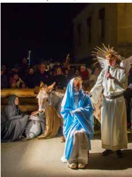
Žive jaslice v izvedbi Dramske skupine KUD France Prešeren Vojnik v sodelovanju s KKD »Ivan Šopar« Vojnik