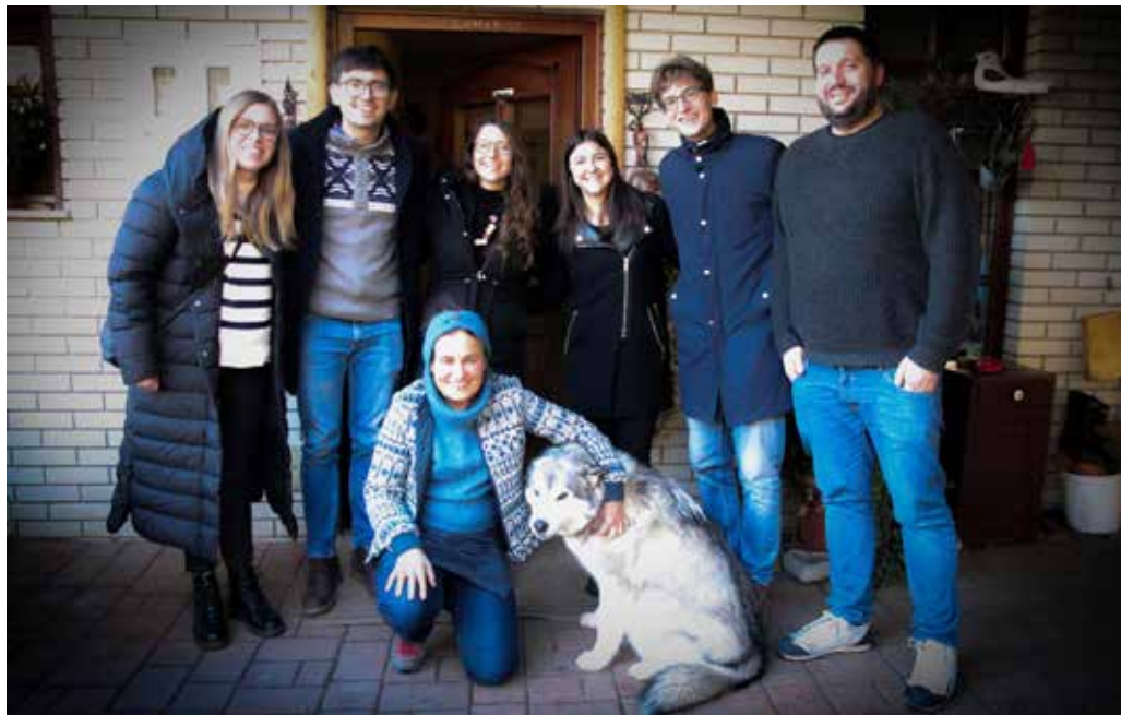
Spominska slovesnost ob 81. obletnici spomina na odpeljane oskrbovance.

Ob tej priliki se želimo zahvaliti Evropski solidarnostni enoti in MOVIT, ki sta omogočila izvedbo