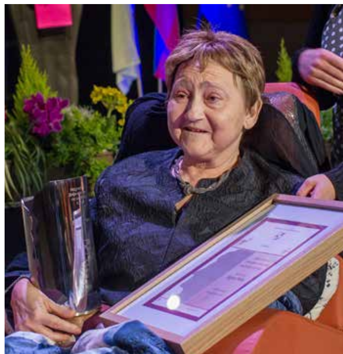
Slavnostna nagrajenka na področju kulture za leto 2023.

se je pokazala enotnost vseh predlagateljev, da gre priznanje v prave roke. Petretova je nagrado sprejela kot priznanje njenemu prispevku k razvoju kulture in ob tem tudi kot priznanje njenemu dolgoletnemu delu glasbenega ustvarjanja. V takih trenutkih je človek kljub težavam, ki ga pestijo, srečen. Naj bodo njena vztrajnost, optimizem in srčnost vzgled vsem nam.