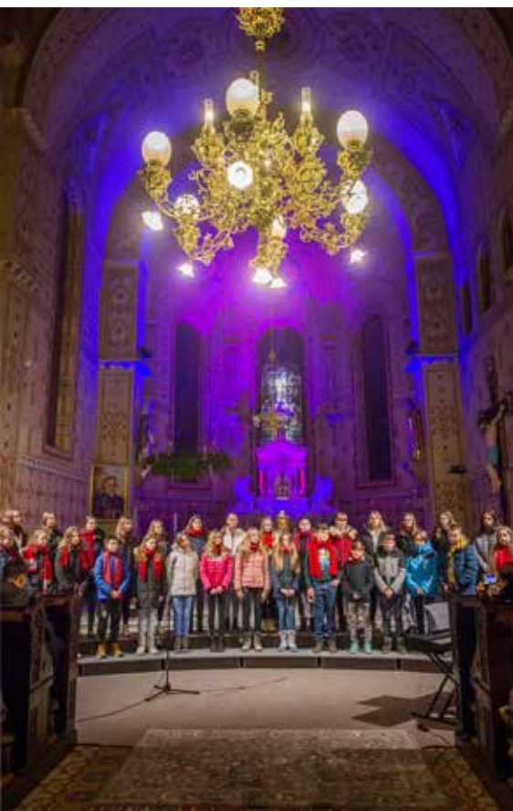
Odprtje Božičnega Vojnika

Priprave na Božični Vojnik potekajo vse leto, intenzivno pa se začnejo novembra. Ker so dosednji hlevčki zgoreli v požaru, je bilo potrebno vse izdelati na novo. Letošnje priprave je oteževalo slabo, deževno vreme, a končno je uspelo postaviti vse na svoj prostor. Vojnik je zaživel skupaj z Božičnim Vojnikom. Ustvarjalcev Božičnega Vojnika je veliko. Zagotovo se organizatorji nikoli ne morejo s priznanji zahvaliti vsem sodelujočim za njihovo delo, zato naj bo v tem zapisu beseda HVALA namenjena prav vsem, ki kar koli prispevajo k uspehu Božičnega Vojnika.