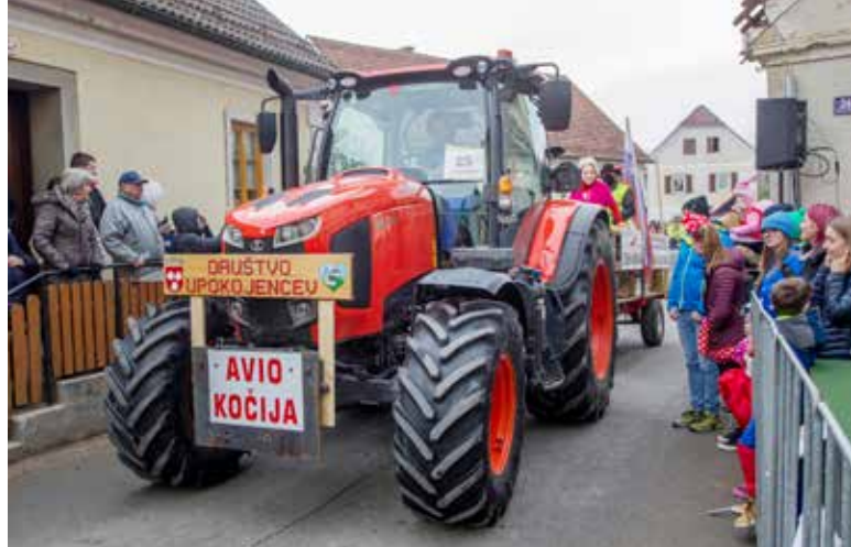
Če greš na Dunaj... masko predsednice parlamenta so pripravili v Društvu upokojencev Vitanje