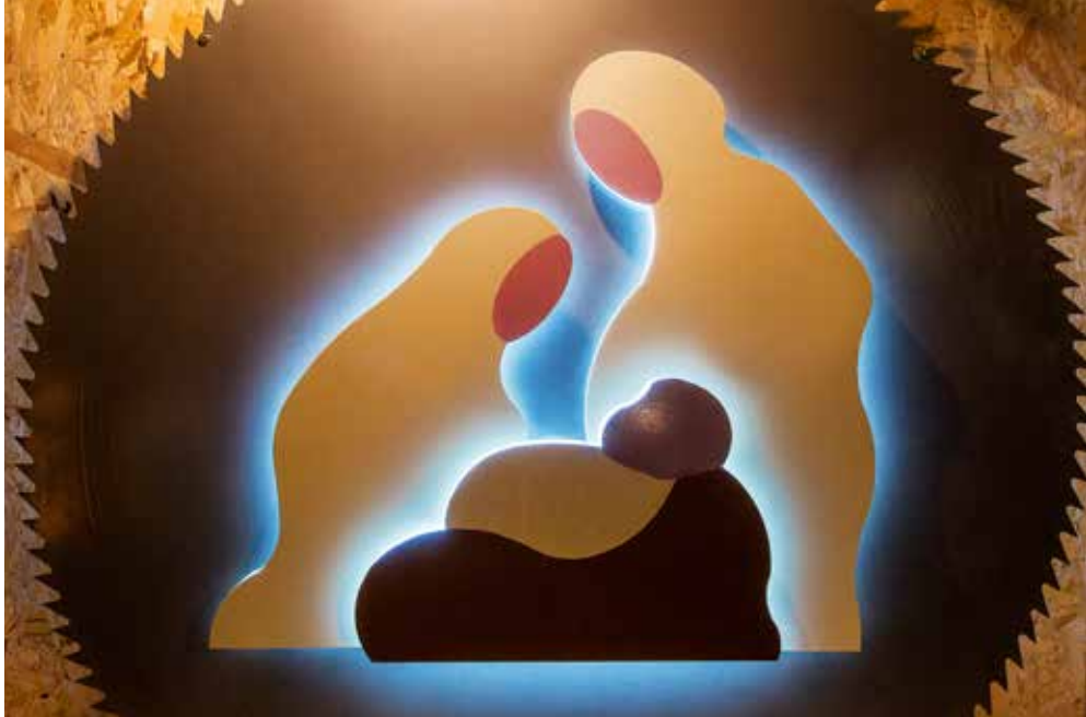
Jasllice izdelalo podjetje Ostri, d. o. o.