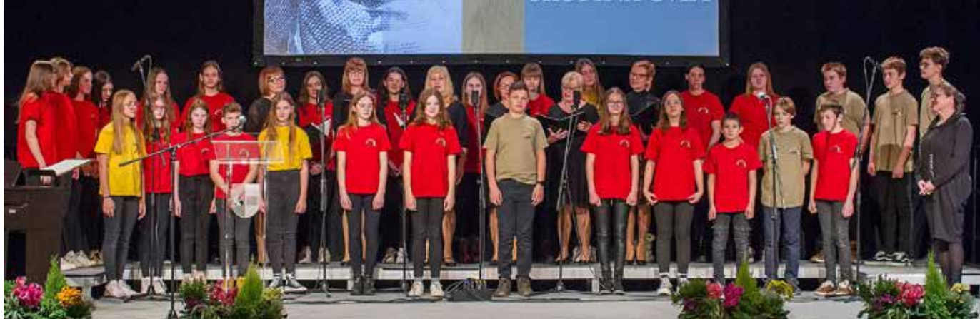
Mladinski pevski zbor OŠ Vojnik in Vokalna skupina Cvet