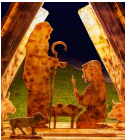
Jasllice izdelal Roman Lenarčič, Križna g. nad Šk. Loko