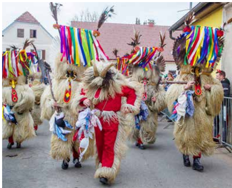
Kurenti iz PGD Polenšak – Žamenci so odganjali zimo