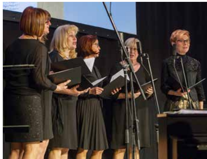
Vokalna skupina Cvet