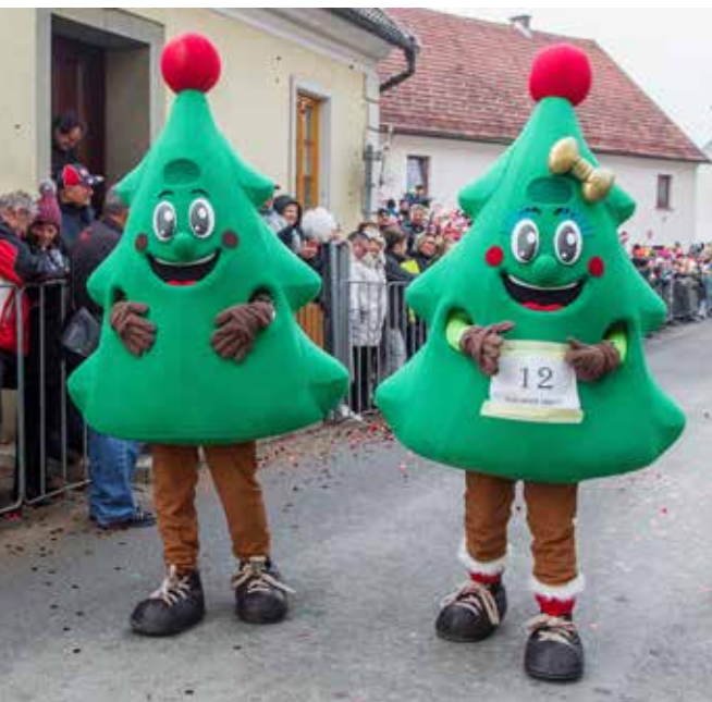
Maskoti Božičnega Vojnika iz Turističnega društva Vojnik