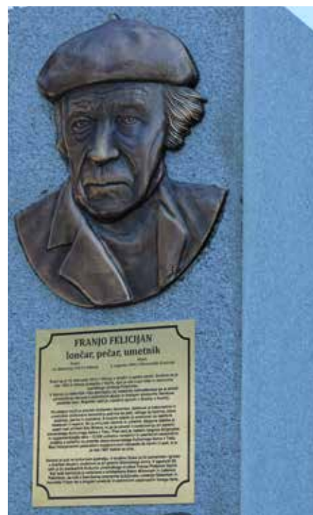
Spominsko obeležje v vrtu, ob občinski stavbi, v Vojniku.