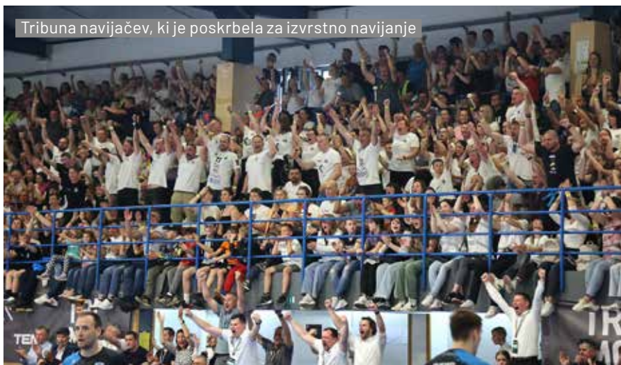
Tribuna navijačev, ki je poskrbela za izvrstno navijanje