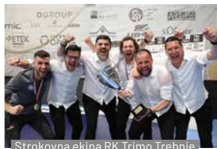
Strokovna ekipa RK Trimo Trebnje

so slavili s sedmimi goli prednosti in tako osvojili prvo lovriko v zgodovini kluba . Osvojeni pokal so trebanjski levi ponosno prevzeli pred domačimi navijači, ki so do zadnjega kotička napolnili športno dvorano OŠ Trebnje. Po osvojenem naslovu, ko so igralci trebanjskega Trima na prestolu zamenjali Celjane, so dvorano napolnila čustva veselja in ponosa, začela se je prava navijaška euforija . Po podelitvi zlatih medalj in prevzemu pokala se je v Trebnjem začelo veliko slavlje. Zaslužno. Trud igralcev na eni strani in organizatorjev ter prostovoljcev na drugi je bil poplačan. Velika HVALA vsem, za vso pomoč in podporo. ZLATI STE! ●