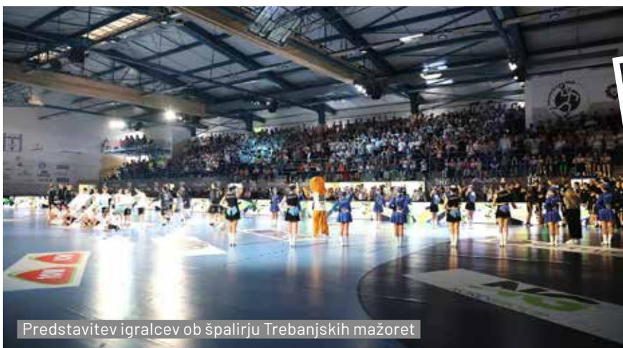
Predstavitve igralcev ob špalirju Trebanjskih mažoret