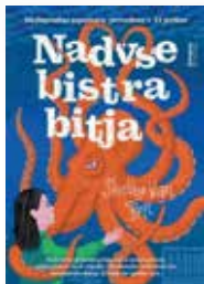
Shelby Van Pelt: NADVSE BISTRA BITJA (Beletrina, 2024)

Sijajen prvenec o prijateljstvu med ovdovelo Tovo in orjaško tihomorsko hobotnico, ki si z izjemno inteligenco in smislom za humor krajša dneve ujetništva v akvariju sredi zakotnega obmorskega mesteca.