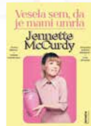
Jennette McCurdy: VESELA SEM, DA JE MAMI UMRLA (Beletrina, 2024)