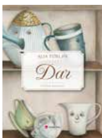
Alja Furlan: DAR (Založba Pivec, 2024)

Osrednji lik pesnitve je žabec, zadnji pripadnik svoje vrste, ki svoje dneve preživlja v akvariju v bolivijskem prirodoslovnem muzeju in srčno upa, da mu bodo uspeli najti družico.