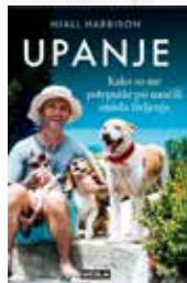
Niall Harbison: UPANJE (Učila, 2024)

Sijajen prvenec o prijateljstvu med ovdovelo Tovo in orjaško tihomorsko hobotnico, ki si z izjemno inteligenco in smislom za humor krajša dneve ujetništva v akvariju sredi zakotnega obmorskega mesteca.