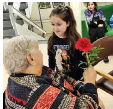
▲ Obisk starostnikov v Šeneku

starostniki v Domu upokojencev Polzela, zanje pripravimo voščilnice, darila ter pripravimo kulturni program. Starostnike obdarimo tudi ob različnih priložnostih, npr. novo leto, valentinovo, osmi marec, dan mučenikov, obiščemo jih preoblečeni v pustne šeme ... Prostovoljci svoj prosti čas preživijo v oddelkih podaljšanega bivanja, kjer mlajšim pomagajo pri učenju, pisanju domačih nalog ali se z njimi igrajo. Skozi vse šolsko leto zbiramo hrano za živali, zamaške, z reciklažo skrbimo za okolje (rabljene baterije, papir ...), organiziramo bazar Zate odpad, zame zaklad, kjer menjujemo rabljena oblačila