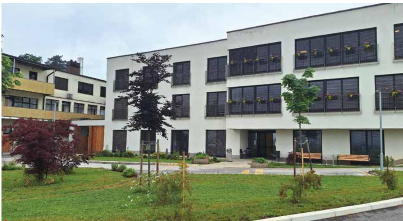
Dom upokojencev Polzela

Novi prizidek bo imel tri nadstropja s skupaj 54 posteljami na 2055 kvadratnih metrih. V pritličju bo prostor za 20 stanovalcev v sedmih dvoposteljnih in šestih enoposteljnih sobah. V prvem nadstropju je predvidenih osem dvoposteljnih in štiri enoposteljne sobe. Deset enoposteljnih in dve dvoposteljni sobi bosta v tretjem nadstropju. Vse sobe bodo imele lastne toaletne prostore in bodo zasnovane tako, da bo ob morebitni vnovični pojavitvi epidemije mogoče v čimkrajšem času organizirati zaokrožene enote, ki so nam bile nazadnje znane kot cone. »Bivanje v prizidku bo oblikovano na podlagi gospodinjskih skupnosti, s katerimi lahko stanovalcem najbolj približamo