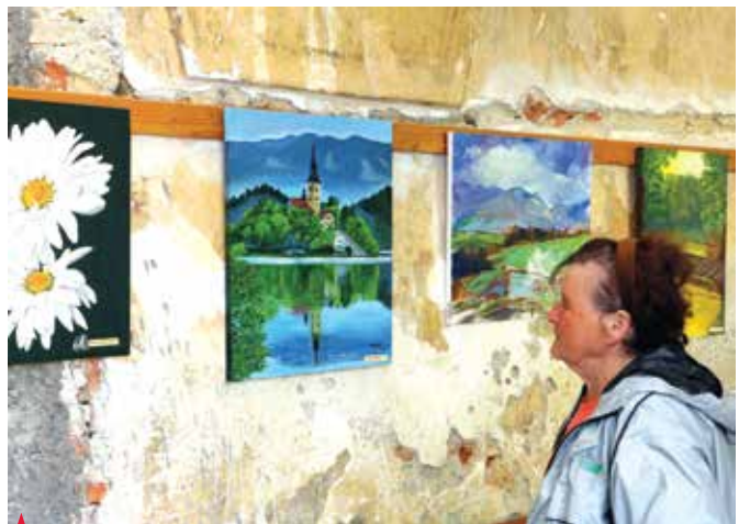
Razstava 6. likovne kolonije v Novem Kloštru je do 30. junija 2023 na ogled na gradu Komenda.