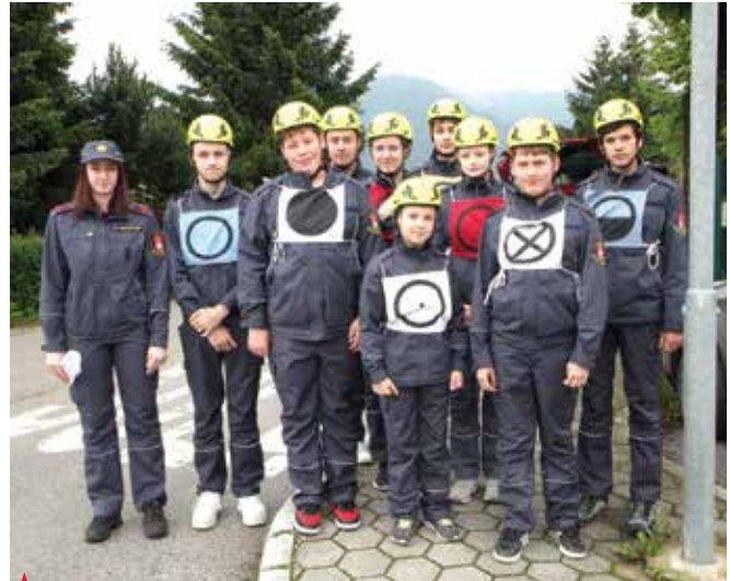
▲ Ekipe iz PGD Andraž nad Polzelo so se na tekmovanju visoko uvrstile.