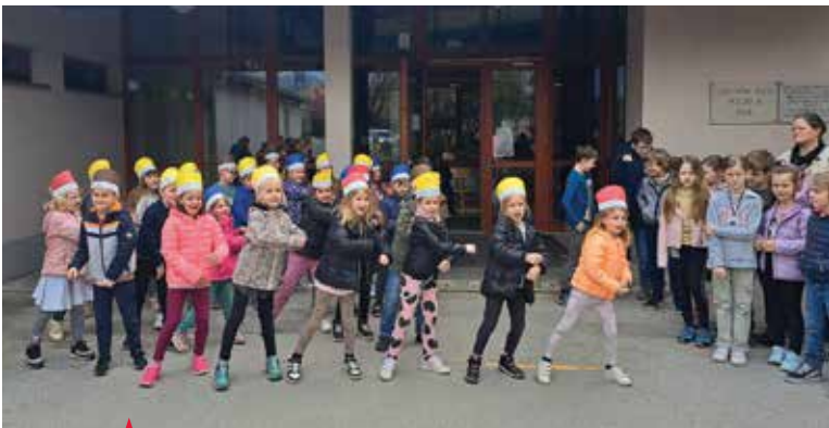
▲ Proslavili smo dan Zemlje.

22. aprila vsako leto obeležujemo svetovni dan Zemlje.