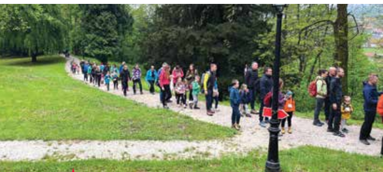
Škratov pohod spet navdušil.