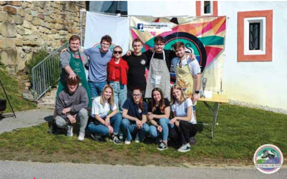
▲ Ekipa Mladinskega društva Polzela

Sončna nedelja, 21. maja 2023, je prinesla veselje in okusno tekmovalnost na grad Komenda na Polzeli. Pasuljada je privabila osem ekip tekmovalcev, ki so se pomerili v pripravi pasulja. Strokovna komisija je ocenjevala njihove jedi, upoštevala pa je tudi rezultate, ki so jih tekmovalci dosegli pri zabavnih igrah, ki so preizkušale kuharsko znanje in veščine. Prvo mesto je zaslužno pripadlo Planinskemu društvu Polzela, drugo mesto Jadralnemu društvu, tretje mesto pa ekipi Študentskega kluba Žalec 2.