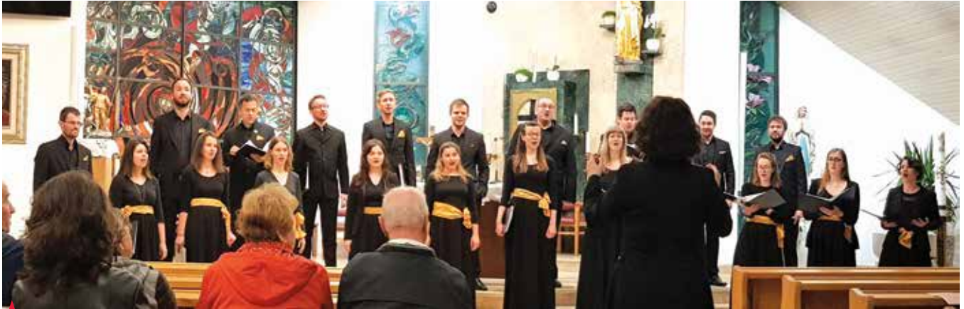
Ljubljanski madrigalisti so navdušili obiskovalce.

Z veseljem napišem, da nam je Mešani komorni zbor Ljubljanski madrigalisti 5. maja 2023 zapel raznolik repertoar, tako odlično, da je z vsako pesmijo požel navdušen, iskren, bučen in dolg aplavz.