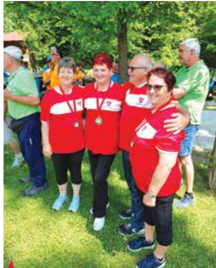
▲ Uspešne članice društva

Največji uspeh so dosegli balinarji, ki so ponovno zasedli prvo mesto in se tako spet uvrstili na državno prvenstvo. Članice našega društva so se redno uvrščale med prve tri najboljše ekipe, medtem ko člani še malo zaostajamo, a ne veliko.