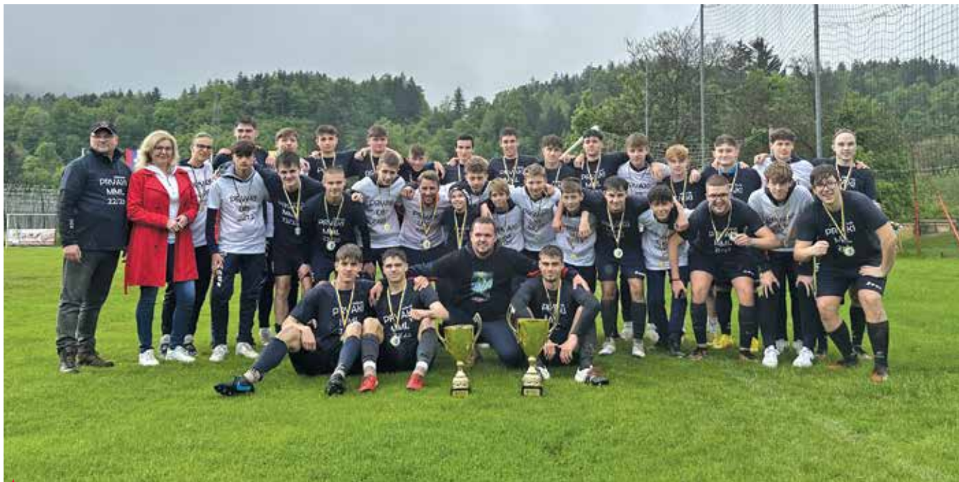
Ekipo Združena Savinjska sestavljajo igralci Nogometnega kluba Vransko, Nogometnega društva Polzela, Nogometnega kluba Žalec in Športnega društva Prebold.