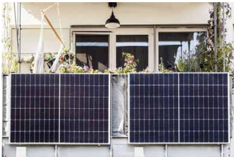
▲ Balkonska sončna elektrarna je v primerjavi s sončno elektrarno na strehi cenejša in dostopnejša.

Pri idealni namestitvi bo naprava z najvišjo dovoljeno priključno močjo 800 W na leto proizvedla približno 920 kWh električne energije. Pri pokončni postavitvi na balkonsko ograjo ali fasado bo proizvedla približno 30 odstotkov manj, torej 644 kWh. Na letni ravni lahko s proizvedeno električno energijo iz balkonske sončne elektrarne prihranite med 11–20 % pri stroških za elektriko.