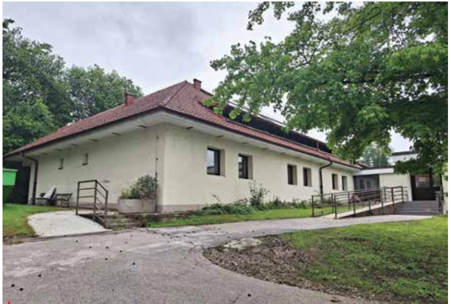
▲ Na mestu dosedanje depandanse, ki bo porušena, bo zrasel sodoben prizidek.

Načelu domske oskrbe, ki temelji na gospodinjstkih skupnostih, so v polzelskem domu upokojujencev sledili že pri projektiranju in gradnji prejšnjega prizidka na severni strani zgradbe, ki so ga dokončali tik pred začetkom epidemije. V njem so samo eno- in dvoposteljne sobe. Stanovalci so še posebno veliko pridobili z oddelkom za demenco, od koder je zaradi sodobnega prizidka mogoč neposredni izhod na zelene površine. V skupnih prostorih ima ambulantno koncesijski zdravnik, ki dela zgolj za potrebe tamkajšnjih stanovalcev. Pod isto streho delujejo še fizioterapija in delovna terapija ter frizerski salon, ki je v času kovidnih razmer služil kot sprejemna soba, medtem ko sta bili v prizidku organizirani siva in rdeča cona.