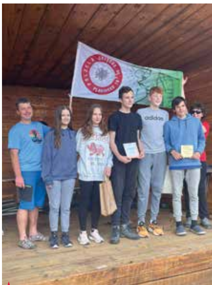
Zmagovalci v odprti in B-kategoriji