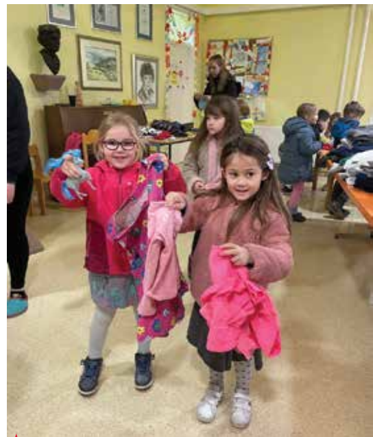
▲ Dobrotelni bazar