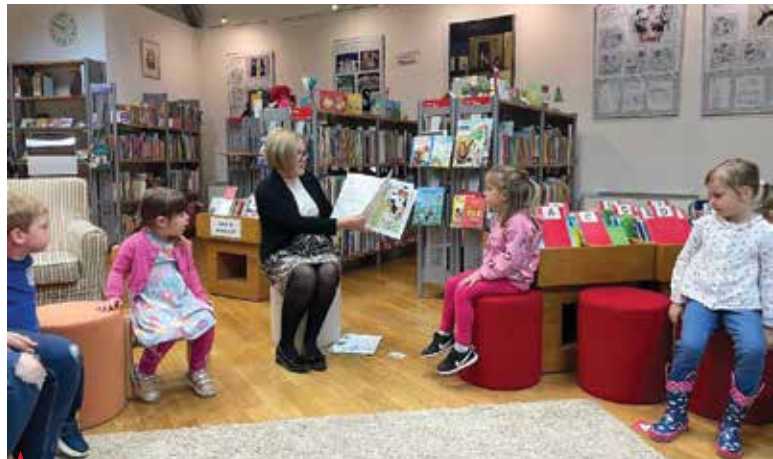
▲ Otroci so z zanimanjem prisluhnili pravljici o volku, ki je postal bralni mojster.