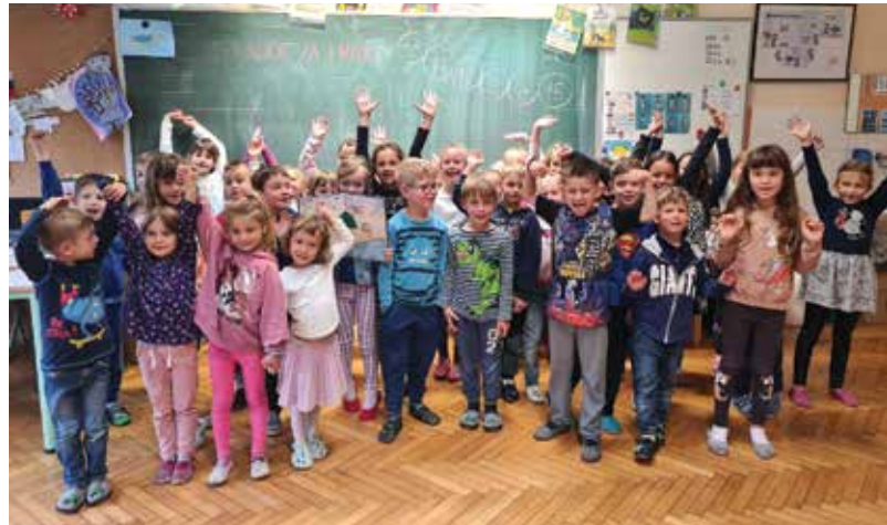
▲ Vrtec in šola z roko v roki