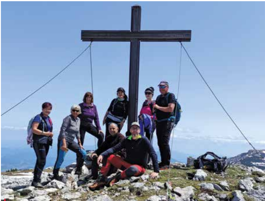
Na vrhu Peco

Sončna majska sobota je bila glede vremena kot naročena za obisk dvatisočaka Peca iz avstrijske strani. V veseli planinski družbi smo se ob kavici posladkali z domačim pecivom in pot nadaljevali proti spodnji postaji gondole.