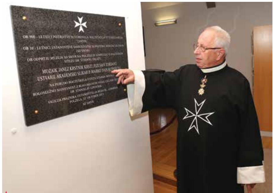
▲ Zaradi številnih zaslug ter spoštovanja in ohranjanja malteške tradicije je bil leta 1997 sprejet med viteze Suverena malteškega viteškega reda.

Pomembno področje njegovega udejstvovanja je bilo sodelovanje pri ohranjanju in obnovi kulturnih in naravnih spomenikov sprva v krajevni skupnosti ter pozneje v občini, kot so cerkev sv. Marjete na Polzeli in sv. Križa na Gori Oljki, park Šenek, rojstna hiša Neže Maurer in grad Komenda. V osemdesetih letih prejšnjega stoletja se je udejeval pri gradnji prizidka k polzelski