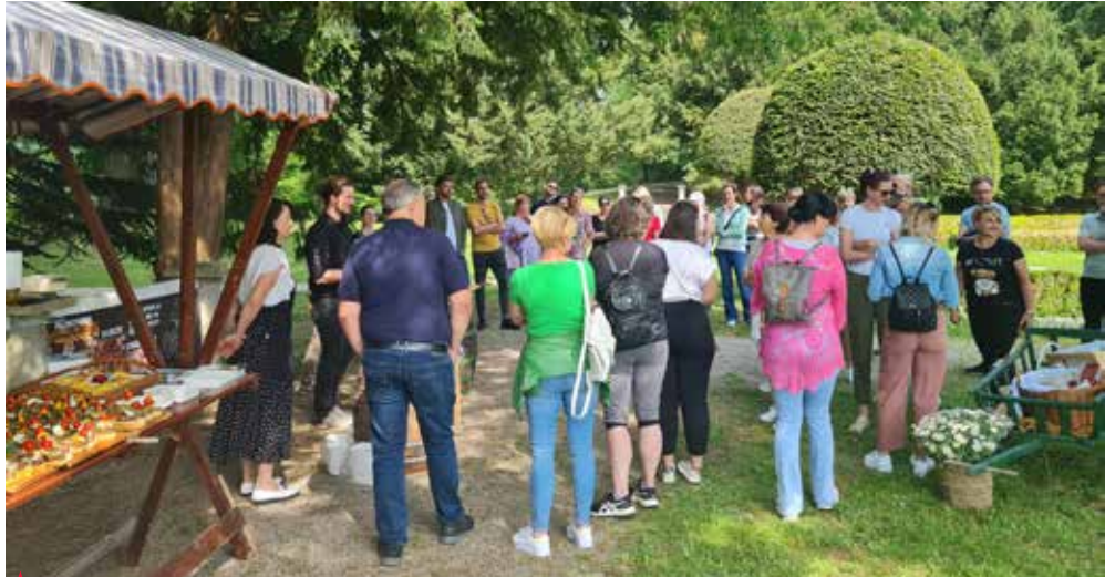
▲ V parku ob graščini Šenek so se udeležencem študijske ture v prijetni senci mogočnih dreves predstavili domači ponudniki.

V projektu LAS Spodnje Savinjske doline sodelujejo občine Žalec, Braslovče, Prebold, Polzela, Tabor in Vransko ter Razvojna agencija Savinja. V preteklih mesecih je bilo izvedenih več projektnih delavnic na vseh lokacijah destinacije. V nastajanju je blagovna znamka in skupna ponudba nastanitev, kulinarike in znamenitosti. V načrtu je izobraževanje lokalnih turističnih vodnikov, ki bi znali voditi goste po vseh šestih občinah. Ponudniki so se na delavnicah spoznavali,