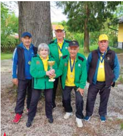
▲ Balinarji DU Polzela so se z doseženim 1. mestom uvrstili na državno prvenstvo.

V mesecu maju so bila končana tekmovanja upokojenk in upokojencev v različnih športnih panogah na ravni Pokrajinske zveze društev upokojencev (PZDU) Celje za leto 2023. Skupni rezultati bodo znani junija. Eno izmed tekmovanj smo organizirali tudi člani Društva upokojencev Polzela, in sicer v ribolovu na jezeru v Preserjah.