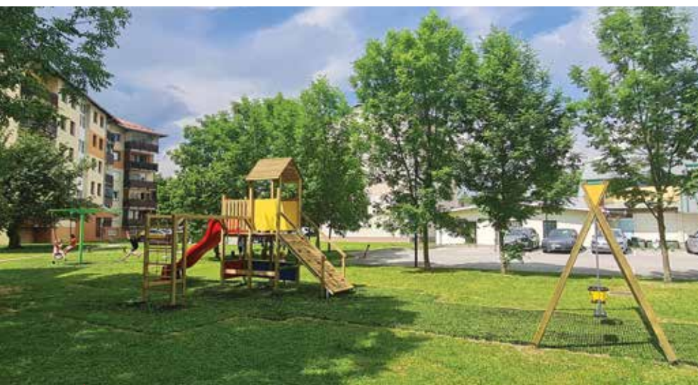
▲ Med bloki je zaživela nova pridobitev za najmlajše.

Na pobudo krajanov je Občina Polzela na občinski zelenici med stanovanjskimi bloki v središču Polzele postavila tri nova igrala.