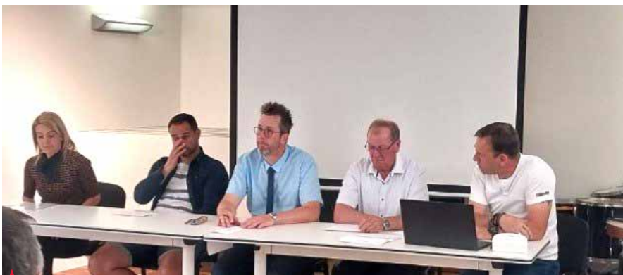
Delovno predsedstvo skupščine