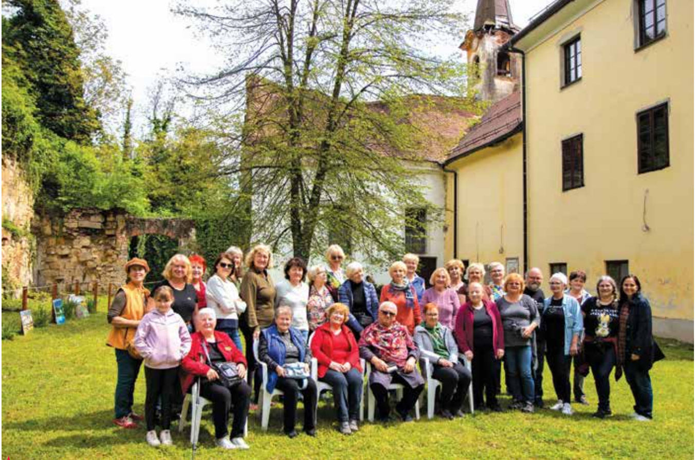
▲ Udeleženci šeste likovne kolonije v Novem Kloštru

Pod oboki in na osrednjem dvorišču dvorca Novi Klošter se je 20. maja 2023 zbralo 35 ljubiteljskih slikarjev iz širše Slovenije, Avstrije in Hrvaške.