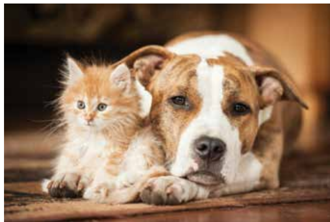
Sožitje psa in mačke

Pri kastraciji samcev odstranimo testise. Pri sterilizaciji pa se juvenilnim psicam odstranijo samo jajčniki, pri spolno zrelih pa navadno še maternica. Pri mačkah se običajno