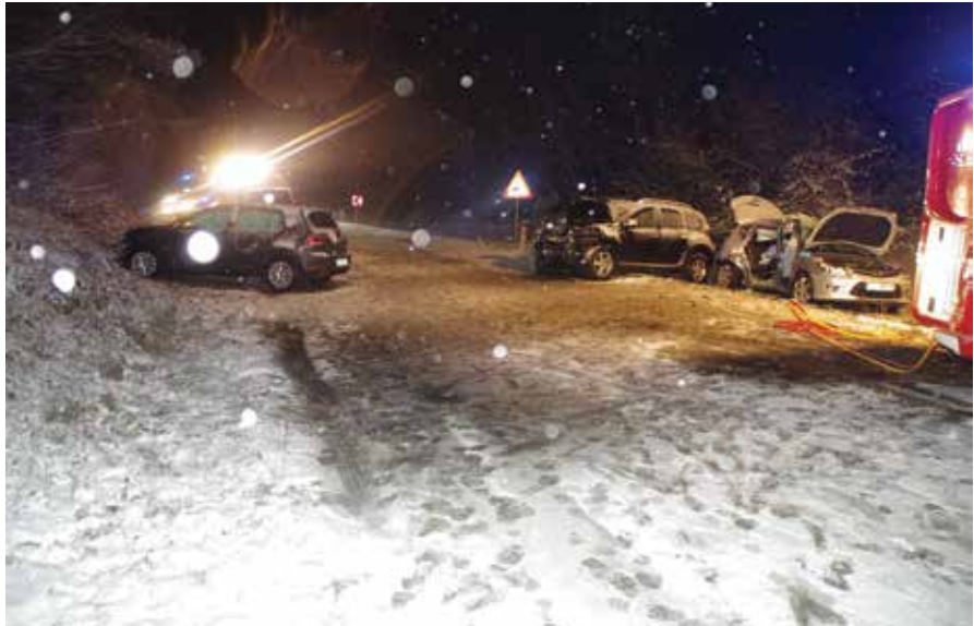
Vožnje v zimskih razmerah ne smemo podcenjevati.

Drugih varnostno problematičnih dogodkov, povezanih s kaznivimi dejanji ali prekrši po javnem redu in miru, na območju Občine Polzela policisti PP Žalec v decembru nismo obravnavali.