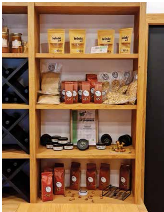
Na policah butične trgovine najdemo izdelke tako z domače kmetije kot tudi z okoliških kmetij.

Lešnike lahko uživamo neposušene, pravo aromo in okus pa dajo pri izmerjeni vlagi okrog 6 odstotkov. Pri naravnem sušenju na lesenem podu, kot jih sušijo na Kmetiji Košec, to vlažnost običajno dosežejo sredi novembra. Po opravljenem sušenju sledi luščenje, prebiranje, shranjevanje in pakiranje. Lešnike shranjujejo v vrečah v suhem in hladnem prostoru. Velik delež lešnikov prodajo kot primarni pridelek, torej kot sušeno in oluščeno jedrce za takojšnje uživanje ali praženje.