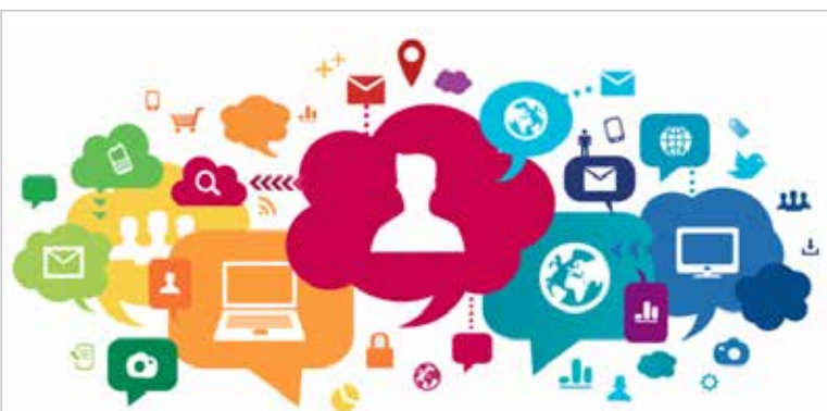
Spletna stran podjetja je investicija.

Facebook, Google+, LinkedIn idr. predstavljajo dodatne načine komunikacije. Če smo usmerjeni bolj B2B, potem bomo na LinkedIn verjetno nekoliko bolj uporabljali. Če pa je naš končni uporabnik fizična oseba (B2C), potem je smiselno razmisliti o nastopu na Facebooku. Zato je FCM (Facebook Community Management) za nas toliko pomembnejši, saj predstavlja direktni dostop do naših potencialnih