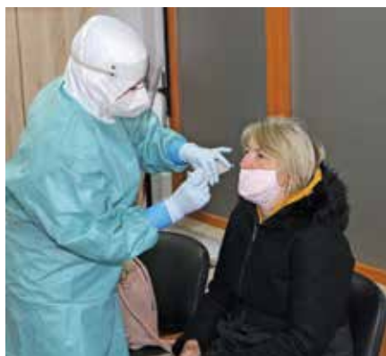
Hitro testiranje ene izmed udeleženk

Občina Polzela je v sodelovanju s Civilno zaščito Občine Polzela v petek, 15. januarja 2021, popoldne v prostorih medgeneracijskega centra pripravila hitro množično testiranje na SARS-CoV-2 s hitrimi antigenimi testi.