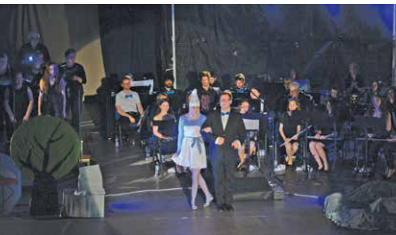
Eno izmed naših društev je Kulturno-glasbeno društvo Cecilija, ki deluje že dvajset let.

Društva so ena izmed priljubljenih oblik združevanja, v katere ljudje vstopamo iz različnih razlogov. Ta so pomemben oporni steber vsake družbe, ker se v njih opravljajo ali razvijajo raznovrstne dejavnosti, pomembne za določene skupine ljudi. Velikokrat je njihovo delovanje koristno za celotno družbo. Prek društev se razvijajo in dograjujejo prenekateri temelji družbe, in sicer od znanosti, kulture, izobraževanja, športa itd. Na območju Upravne enote Žalec imamo trenutno registriranih 498 društev, v povprečju na leto registriramo 20 novih.