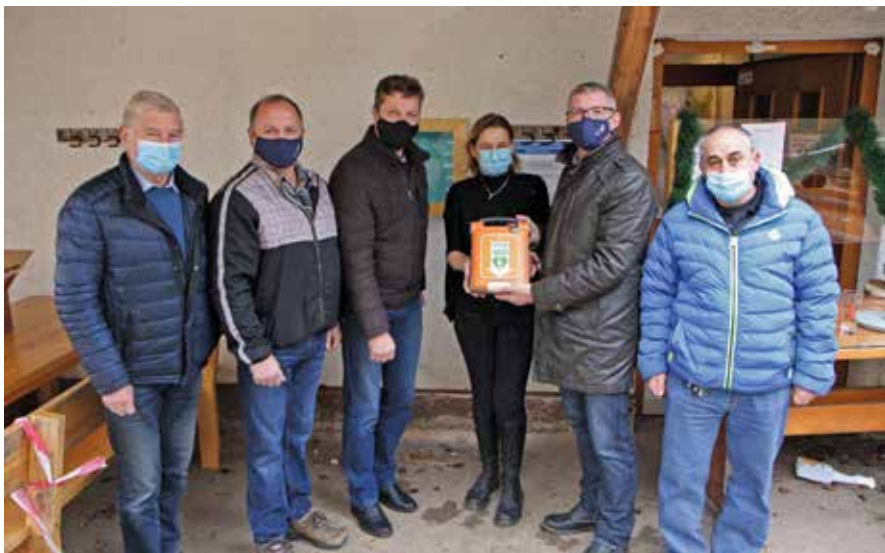
Defibrilator je pomembna pridobitev, saj Goro Oljko vsako leto obišče več tisoč obiskovalcev.

Ta planinski dom obišče vsako leto več tisoč obiskovalcev, zato je namestitev avtomatskega zunanje defibrilatorja upravičena. Namenjen je predvsem laikom, ki se še nikoli niso srečali z zastojem srca. O življenju in smrti pogosto odločajo sekunde. Običajno ljudje narobe mislijo, da so pred zastojem srca varni, saj naj bi se zgodil le starejšim in srčnim bolnikom, kar pa nikakor ne drži. Zastoji srca se dogajajo tudi najstnikom, otrokom, dojenčkom, športnikom, zdravim ljudem, ki nimajo niti povišanega holesterola v krvi, kaj šele, da bi bili srčni bolniki oz. imeli težave z ožiljem. Torej se lahko zgodi komur koli izmed nas in kjer koli.