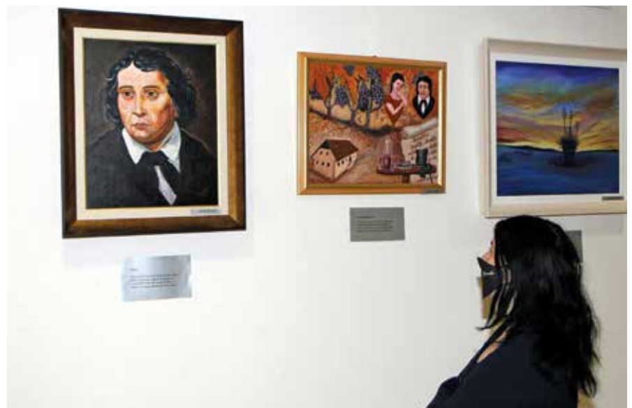
Za razstavo na gradu Komenda je veliko zanimanje.