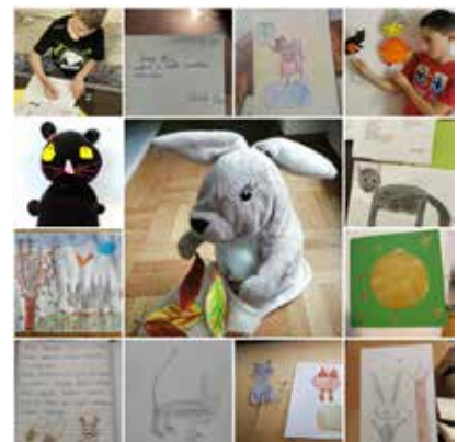
Umetniki, 3. r.