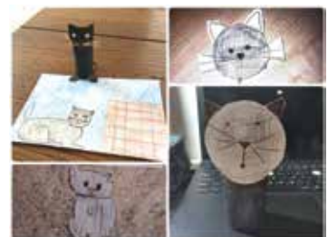
Umetniki, 3. r.