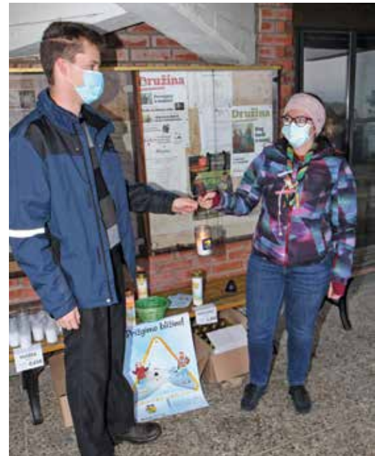
Prižig Betlehemske luči pri cerkvi na Polzeli