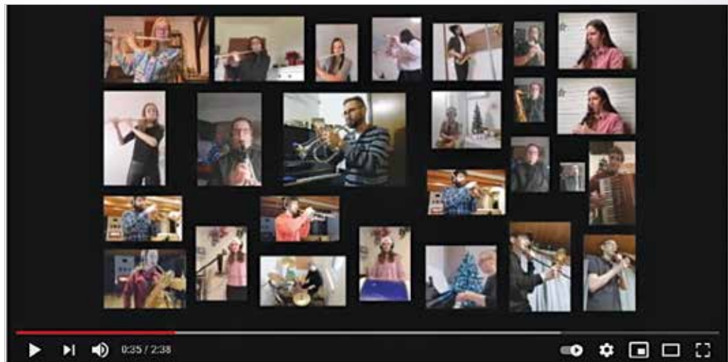
NAJINA MALA SREČA I Pihalni orkester Cecilija, KGD Polzela