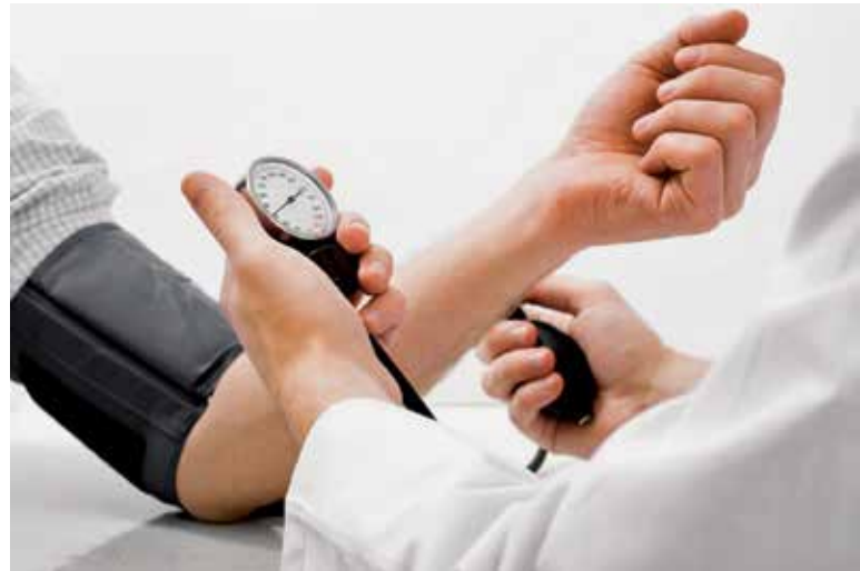
Optimalen tlak v arterijah je 120/80 mmHg, tlak v venah pa je 2–4 mmHg.

Krvni tlak ni ves čas enak in se spreminja zaradi različnih dejavnikov, kot so: položaj telesa, stopnja telesne aktivnosti, razburjenje, strah, spanje, uživanje kave ... Če je tlak zaradi npr. telesne aktivnosti za kratek čas nekoliko povišan, to ne predstavlja težave. Tveganje nastopi, če je krvni tlak dolgo povišan tudi v mirovanju. Takrat govorimo o arterijski hipertenziji. Arterije so elastične, z višjo starostjo in nezdravim življenjskim slogom pa zaradi procesa ateroskleroze postajajo vedno bolj toge. Zaradi hipertenzije se notranjost žil še bolj poškoduje, kar v primeru nezdravljene bolezni vodi v okvaro vitalnih organov, kot so možgani, srce in ledvice, zaradi zapore pomembnih žil, ki jih oskrbujejo.