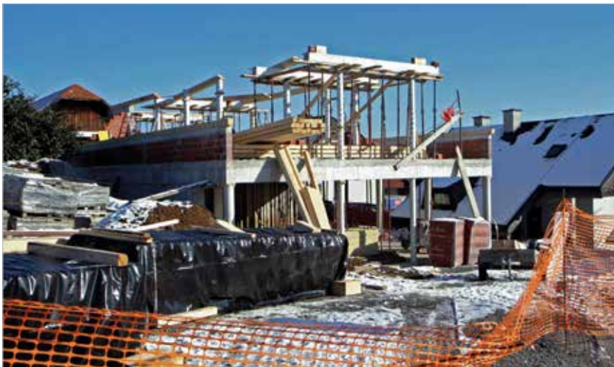
Gradnja novega polzelskega avtosalona Hyundai AC Kralj CAST, d. o. o.

Polzelsko podjetje Hyundai AC Kralj CAST bo v letu 2021 odprlo vrata novega avtosalona.