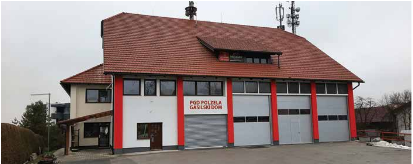
Tik pred novim letom je bila delno končana energetska sanacija gasilskega doma.

Kljub nezavidljivim epidemiološkim razmeram v preteklem letu nam je uspelo večino zadanih aktivnosti zadovoljivo izpeljati. Še vedno potekajo priprave na nabavo novega gasilskega vozila GV-1, opravili smo del gasilskih izobraževanj, poudarek je bil na nabavi in vzdrževanju osebne zaščitne opreme in drugega gasilskega orodja. Tik pred novim letom pa smo delno končali energetska sanacija gasilskega doma, ki je tako dobil novo lepšo podobo pročelja pri garažah, spomladi to leto pa delo nadaljujemo še na vzhodni in južni strani objekta gasilskega doma.