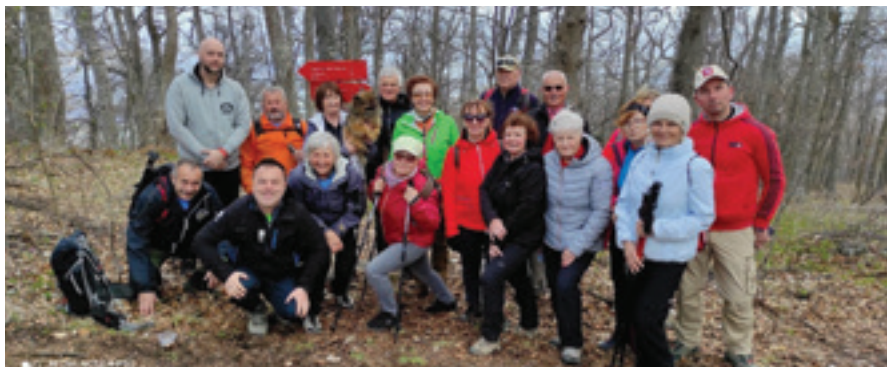
Na vrhu Boča

Boč, imenovan tudi štajerski Triglav, je priljubljena točka sprehajalcev in planincev. Je med zadnjimi vrhovi v Karavankah.