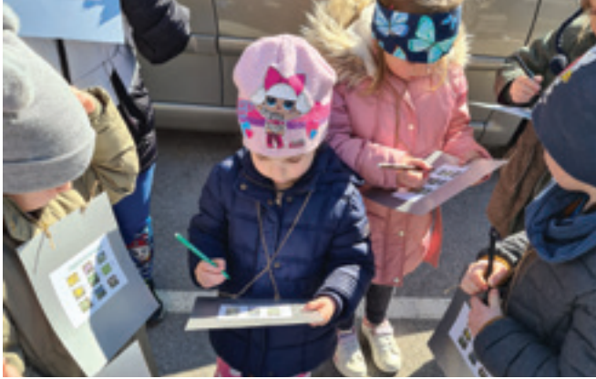
Raziskovanje na terenu

Prvi sonček in topel dan nas je v raziskovanje pognal. Najprej smo spoznali prve znanilce pomladi, nato pa se te odpravili poiskat in prepoznat v bližnjo okolico.