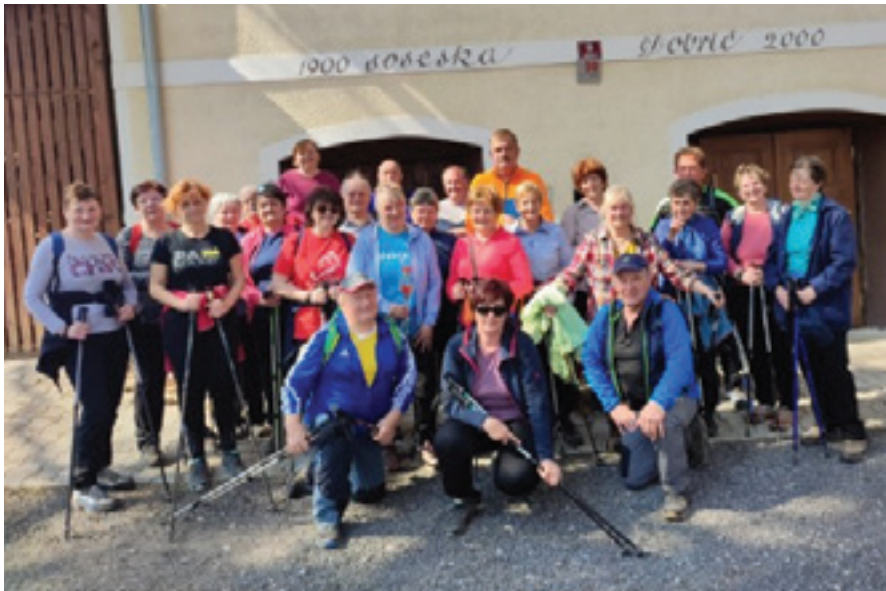
Postojanka pri Dobriški zidanici

Društvo upokojencev Andraž je ob materinskem dnevu 25. marca 2022 povabilo svoje članice na prijeten pohod po zaselkih Brezovec, Dobrič in Hotunje.