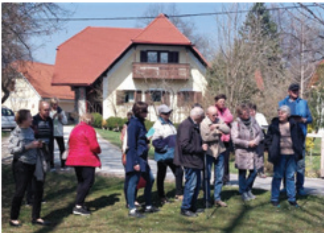
Mlin na Sorževi domačiji se še vedno uporablja za mletje žita.

Obiskovalci zeliščarske skupine "Do zdravja z naravo" smo sklenili, da eno srečanje v mesecu preživimo v naravi. V sredo, 13. aprila 2022, smo se odpeljali v Polže, kjer smo obiskali Soržev mlin.