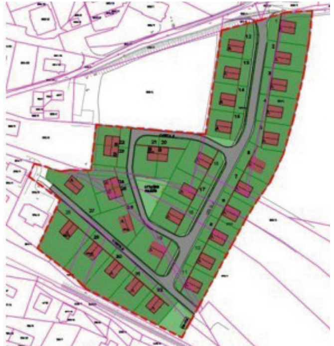
Ureditvena situacija OPPN Pod cerkvijo

Ravnateljica OŠ Polzela je na seji predstavila predlog novih cen programov v Vrtcu Polzela. Zanje je glasovalo vseh 14 navzočih članov. Do zdaj je bila cena za prvo starostno obdobje 462 evrov, po novem bo znašala 517 evrov. Za drugo starostno obdobje je bila do zdaj polna cena 395 evrov. Po novem bo 477 evrov. Cena kombiniranega oddelka znaša 497 evrov.