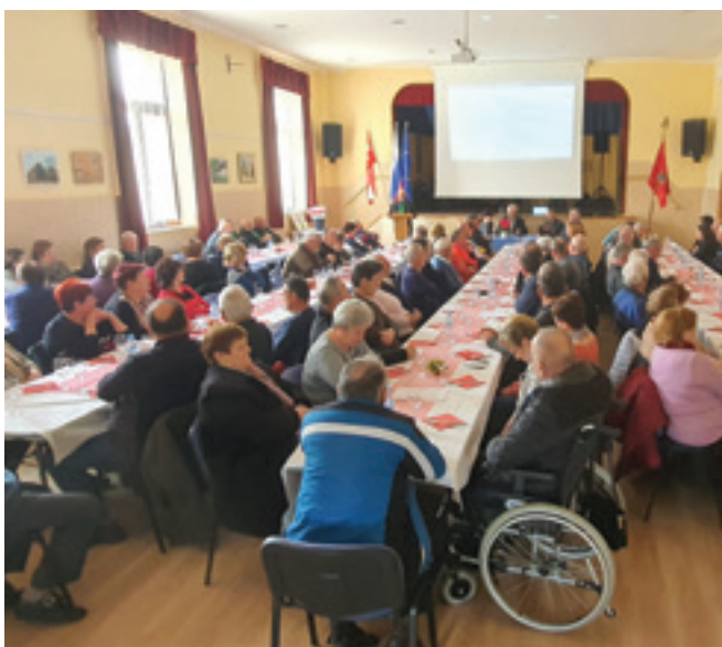
Druženje v Domu krajanov v Andražu nad Polzelo

Društvo upokojencev Andraž je v četrtek, 17. marca 2022, ob 11. uri izvedlo zbor članov društva v prostorih Doma krajanov Andraž. Prisostvovala je več kot polovica vseh članov in vabljenih gostov.