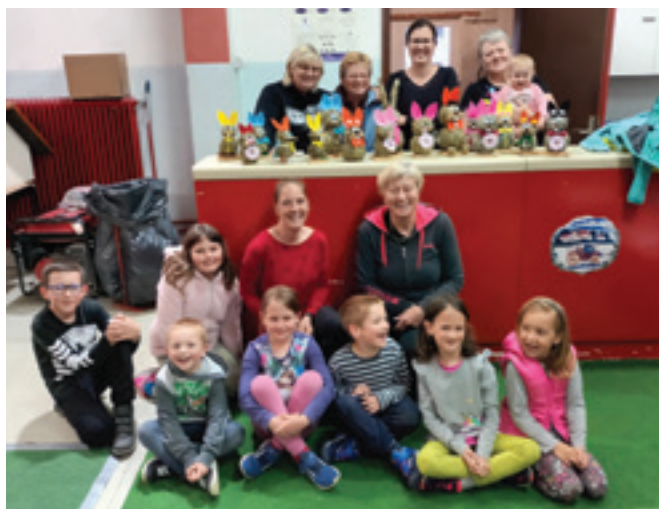
Gasilski dom na Polzeli ni namenjen samo intervencijam, ampak tudi preživljanju prostega časa.

V soboto, 9. aprila 2022, na deževen in turoben dan, smo članice PGD Polzela skupaj z mladino ustvarjale zajčke iz sena in si tako pričarale lepo sobotno popoldne. Mislim, da nam je uspelo, saj smo zajčke ustvarjale prvič.