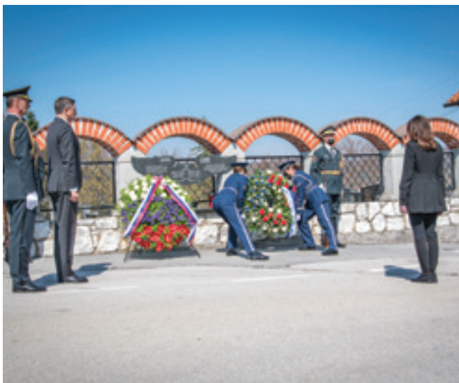
Venec sta k spominski plošči položila predsednik RS in veleposlanica ZDA.