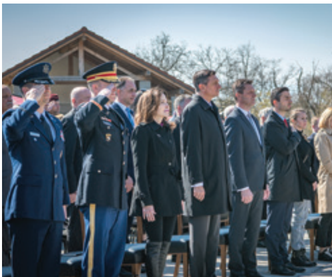
Visoki gostje tradicionalnega dogodka v Andražu nad Polzelo