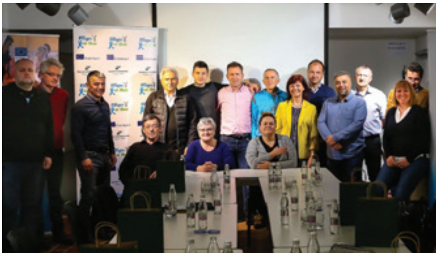
Dogodka so se udeležili predstavniki občinskih športnih zvez in lokalnih športnih društev.

V četrtek, 31. marca 2022, je na gradu Komenda Zveza športnih društev Polzela gostila “Hackathon Villages on the Move”, ki so se ga udeležili predstavniki občinskih športnih zvez in lokalnih športnih društev.