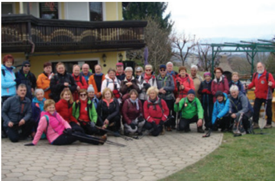
Pohodniki iz Mislinje na obisku v Andražu nad Polzelo

Planinsko društvo Mislinja v sodelovanju z Društvom upokojencev Mislinja že vrsto let organizira manj zahtevne pohode na planinska in gorska območja Slovenije. Vsak prvi torek v mesecu imamo načrtovan skupinski pohod, vsakič se ga udeleži lepo število pohodnikov. Letošnji torek v aprilu smo tokrat v skupini 28 pohodnikov namenili pohodu dela poti »Po poteh Andraža« z vzponom na Goro Oljko (734 metrov).