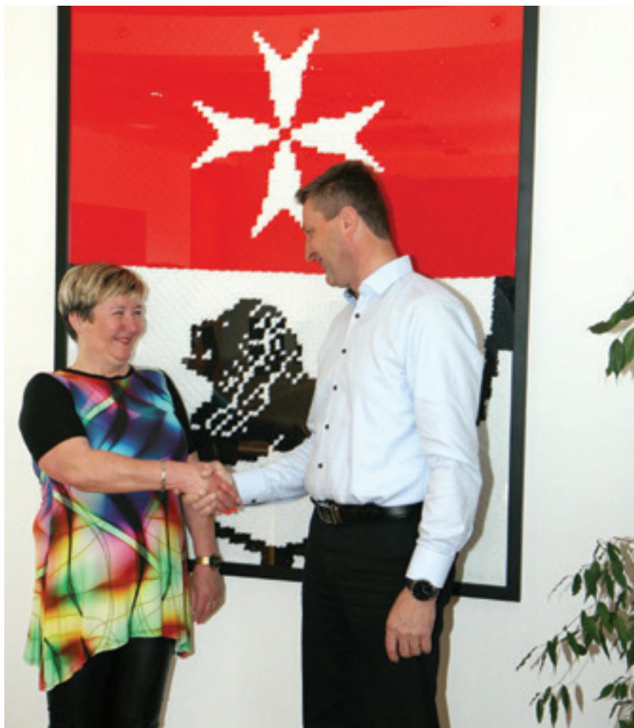
Kvačkan grb krasi sejno sobo Občine Polzela.