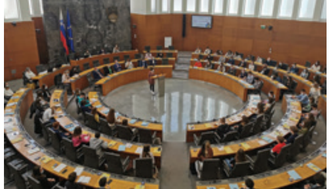
Mladi zasedli državni parlament

Zveza prijateljev mladine Slovenije vodi vseslovenski program Otroški parlament, ki spodbuja mlade k aktivnemu državljanstvu in izražanju lastnega mnenja o pomembnih vprašanjih, ki se nanašajo nanje.