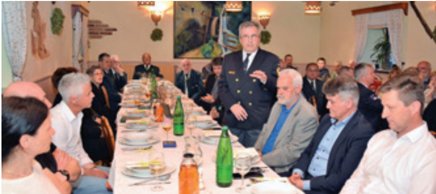
Srečanje družin, ki so hranile orožje, je letos gostila Občina Žalec.