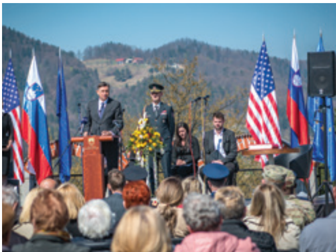
Slavnostni govor predsednika RS Boruta Pahorja