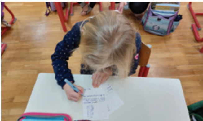
Ustvarjalni teden pisanja z roko

Naša šola se je letos prvič pridružila vseslovenskemu projektu Teden pisanja z roko, ki je potekal od 17. do 21. januarja 2022.