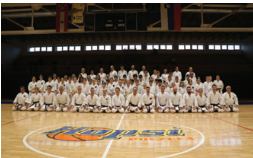
Seminar je v treh dneh obiskalo več kot 100 karateistov.