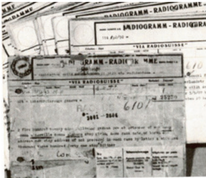
Arhivske kartoteke iz 2. svetovne vojne

V sklopu Službe za poizvedovanje Rdečega križa Slovenije (RKS) preprečujemo stiske oseb, ki so ločene od svojcev zaradi vojne, oboroženih spopadov, nasilja, naravnih in drugih nesreč ter migracij. Služba sodeluje pri iskanju pogrešanih oseb, prenaša družinska sporočila in sodeluje pri obnavljanju družinskih vezi.