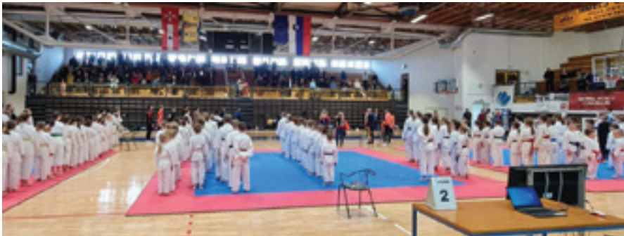
Na tekmovanju je bilo odlično vzdušje.

V nedeljo, 3. aprila 2022, je Karate klub Polzela v domačem kraju gostil šolsko ligo Kofukan. Tekmovanja so se poleg domačih udeležili še številni tekmovalci iz 15 karate klubov, skupaj kar 183. Vsem se zahvaljujemo za udeležbo ter jim čestitamo za vse pogumne nastope in odlične dosežke.