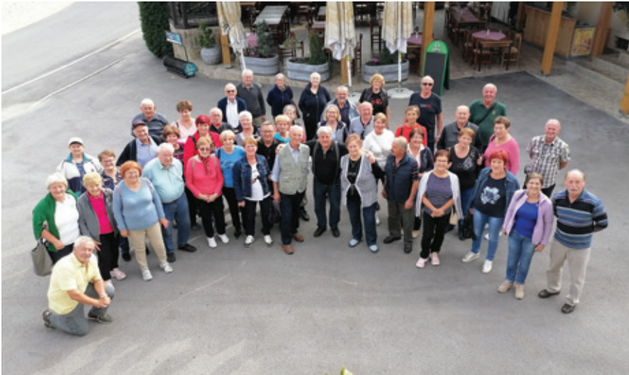
Člani GMD Polzela so bili v oktobru zelo aktivni.

Gobarsko-mikološko društvo Polzela je bilo v jesenskem času zelo aktivno. 24. septembra 2022 smo ob prazniku Občine Polzela pripravili bogato razstavo gob pri Gostilni Cizej na Polzeli. Razstava je bila poučna za učence Osnovne šole Polzela, namenjena pa je bila tudi širši javnosti. Zanimanje zanjo je bilo veliko.