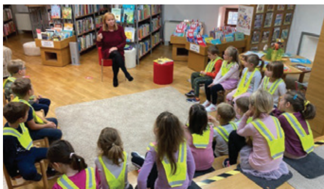
Prvošolci so z zanimanjem spoznavali knjižnico.