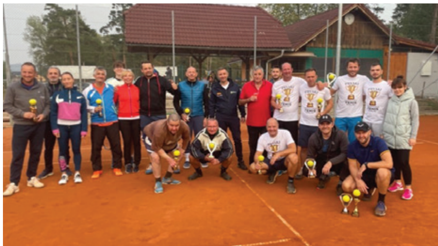
Udeleženci zaključnega turnirja

V soboto, 15. oktobra 2022, smo odigrali zaključni turnir letošnje sezone. Z žrebom smo določili naključne dvojice, ki so se menjale prve tri kroge, pozneje pa smo med najboljšimi izžrebali še fiksne dvojice, ki so se pomerile v polfinalu in finalu.