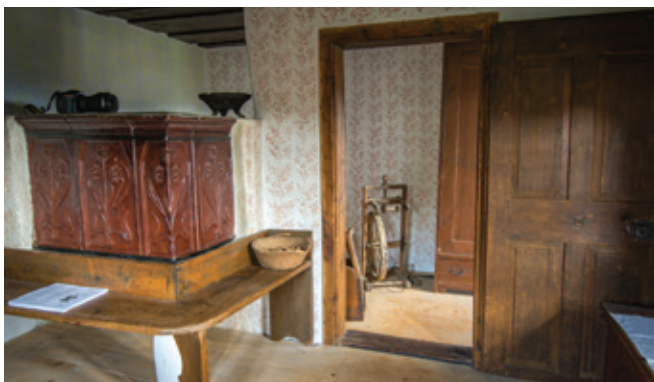
Notranjost priča o načinu življenja in bivanja v preteklosti.