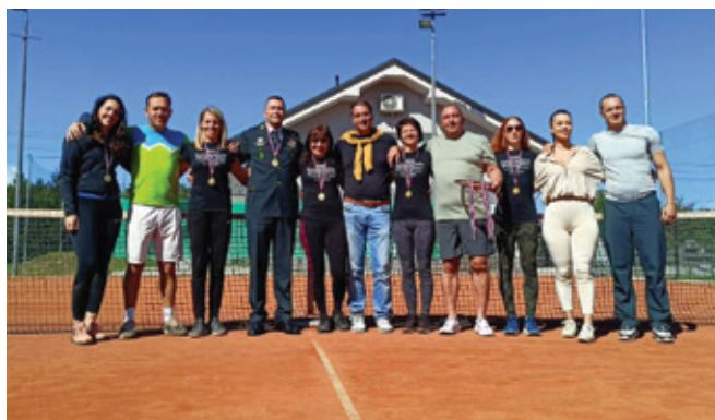
Teniški turnir pripadnic Slovenske vojske bo postal tradicionalen.

Teniški klub Polzela je v petek, 23. septembra 2022, gostil pripadnice Slovenske vojske.