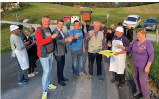
V Jajčah so namenu predali dva nova cestna priključka.

V zaselku Jajče smo 14. oktobra 2022 predali namenu dva cestna priključka.