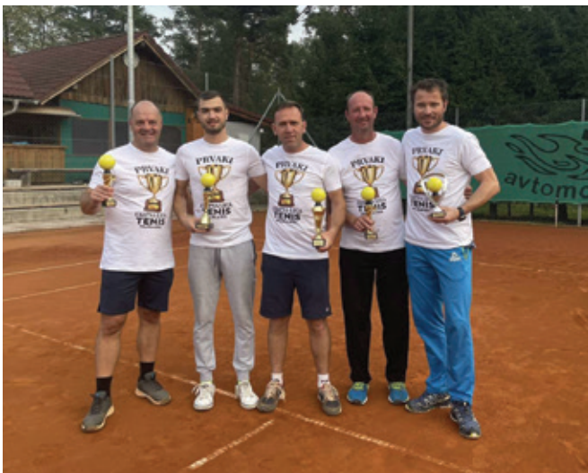
Ekipa Tornado - zmagovalci letošnje ekipne lige

V letu 2022 je teniško ekipno ligo igralo devet ekip, kar pomeni 45 igralcev. Da so bile vse tekme odigrane, se je liga igrala dva meseca, in sicer od junija do začetka avgusta. Zaključek v soboto, 15. oktobra 2022, je potekal v zelo številčni udeležbi in prijetnem vzdušju na igriščih Teniškega kluba Polzela.