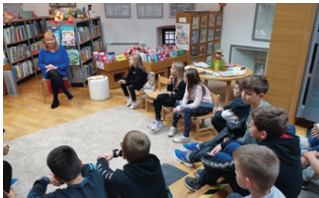
Pestro dopoldne v knjižnici