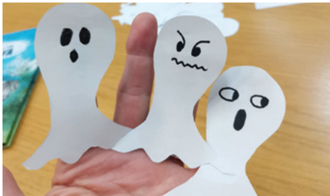
Naprstni duhci prikazujejo različna razpoloženja.