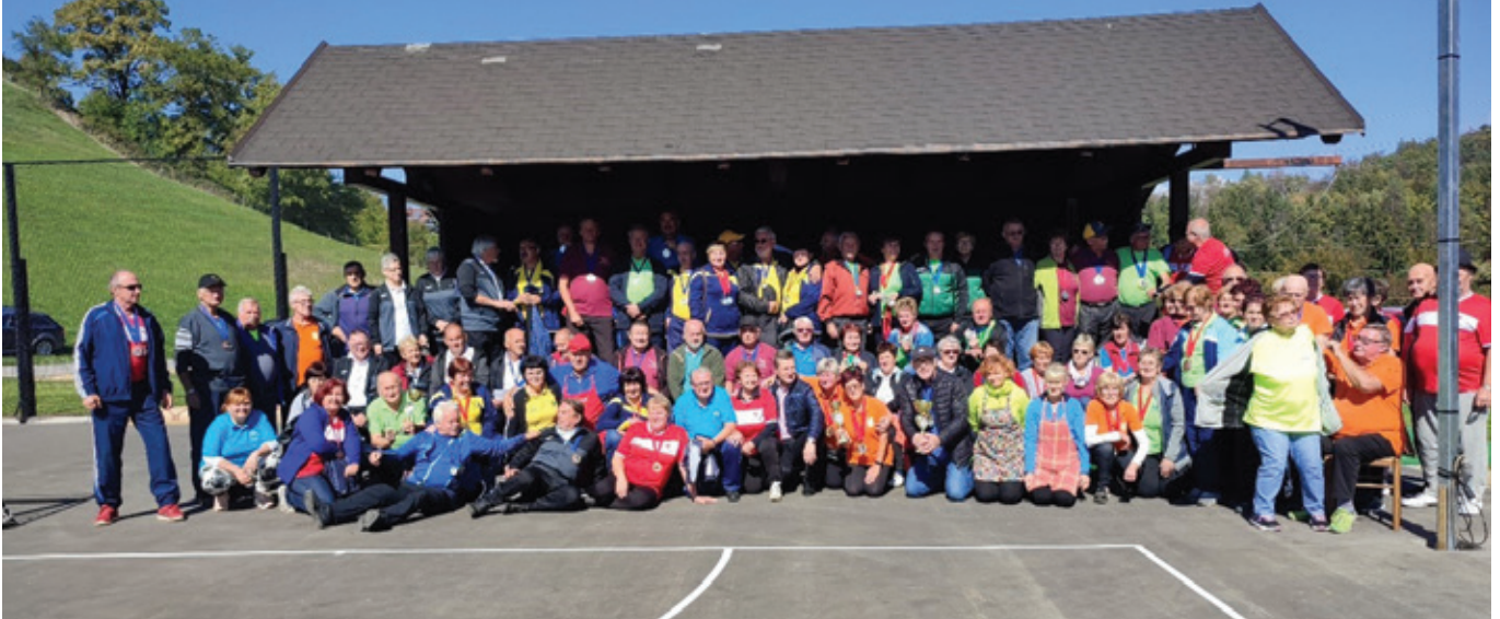
Tekmovanja so se udeležili upokoјenci iz 11 povabljenih društev.

Društvo upokoјencev Andraž je 23. septembra 2022 ob prazniku Občine Polzela na Športnem igrišču Andraž organiziralo že tradicionalno meddruštveno tekmovanje upokoјencev iz Spodnje Savinjske doline ter iz pobratenega društva iz Destrnika.