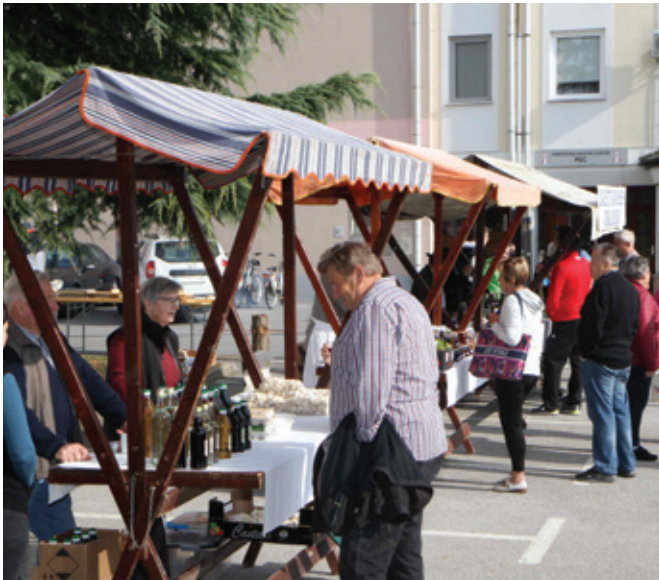
Zbrana sredstva so podarili Gasilskemu poveljstvu Občine Polzela.

Turistično društvo Občine Polzela je v sklopu praznovanja Občine Polzela organiziralo tradicionalno kmečko tržnico Dobrote s kmetij.