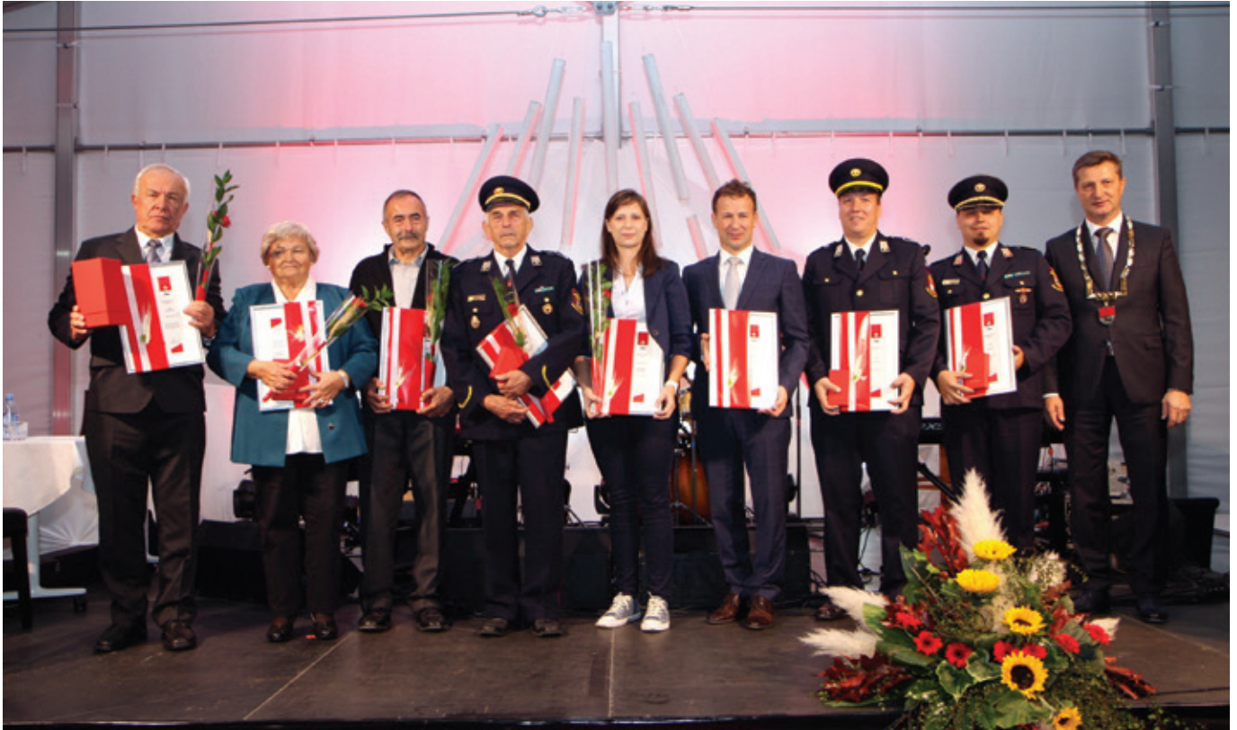
Prejemniki priznanj z županom Jožetom Kužnikom

Prijaznost je bila rdeča nit govora Jožeta Kužnika, župana Občine Polzela, na slavnostni akademiji ob prazniku Občine Polzela, ki je bila na predvečer praznika, 1. oktobra 2022.