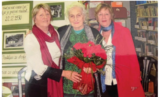
Z obiska pri Neži Maurer