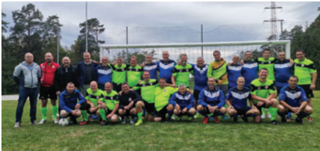
Nogometni ekipi Velikega Gradišča in Polzela

V času aktivnosti ob občinskem prazniku Občine Polzela so po letu 2019 predstavniki Velikega Gradišča ponovno obiskali Polzelo. Nogomet in prijateljstvo je tema, ki nas je povezala do te mere, da se to v zelo prijetnem in pozitivnem duhu nadaljuje.