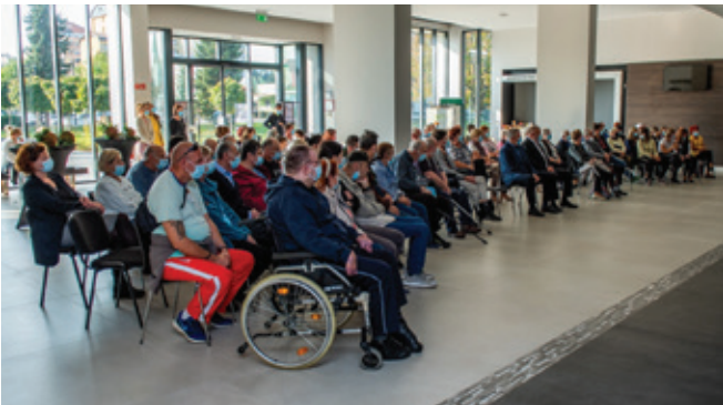
Stanovalci in varovanci na skupnem druženju

Četrtek v oktobru je bil ravno prav sončen, da je bil dan primeren za obiske. Po dolgem času so se namreč v avli Doma II. slovenskega tabora Žalec spet družili stanovalci domov in varovanci društev, ki jim knjižničarke Medobčinske splošne knjižnice Žalec enkrat na mesec pripovedujejo zgodbe, se z njimi pogovarjajo in pojejo. Prireditev ima že tradicionalno naslov Ko spregovori srce, zmore glava, zmorejo roke.