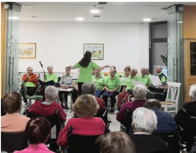
Nastop domskega pevskega zbora Šeneški glas

Dan odprtih vrat Doma upokoencev Polzela že vrsto let združujejo s svetovnim dnevom starejših, ki ga praznujemo prvega oktobra.