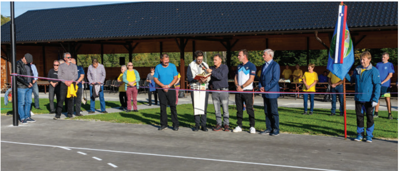
Predaja obnovljenega asfaltnega igrišča

Športno društvo (ŠD) Andraž je ob praznovanju 24. praznika Občine Polzela, tednu evropskega športa in prazniku slovenskega športa (23. september) v petek, 7. oktobra 2022, v sodelovanju z Občino Polzela organiziralo predajo obnovljenega asfaltnega igrišča svojemu namenu.