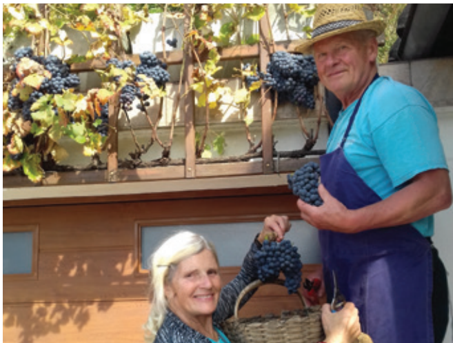
Trta Nejka je letos obrodila 71 grozdov.

Potomka stare trte modra kavčina je bila posajena na gregorjevo leta 2012. Ime je dobila po vnukinji Nejki in je letos bogato obrodila. Raste v Pirhovem vinogradu v Podvinu pri Polzeli.