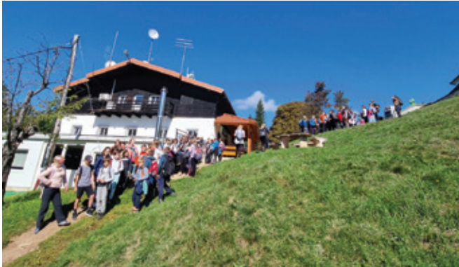
Šestošolci na Gori Oljki

Dan slovenskega športa, ki je potekal 23. septembra 2022, smo učenci in učitelji OŠ Polzela preživali zunaj. Podali smo se na pohod v različne smeri.