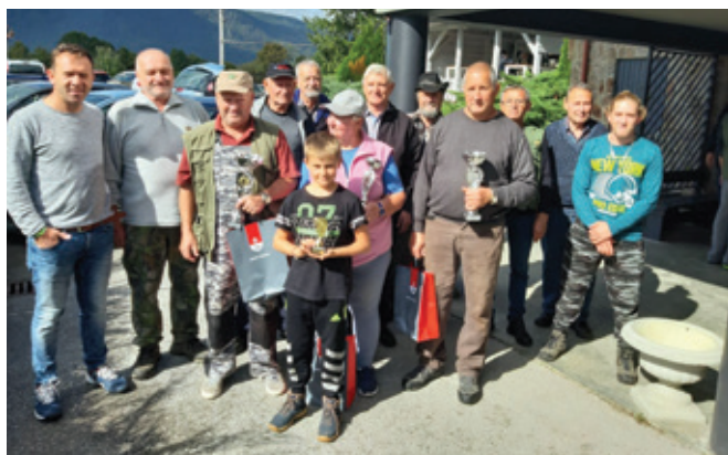
Ribiškega tekmovanja se vsako leto udeleži večje število ribičev.

Zveza športnih društev Polzela je že sedmič zapovrstjo organizirala ribiško tekmovanje za občane Občine Polzela.