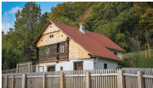
Rojstna hiša bo tudi v prihodnje na voljo za ogledе in različne dejavnosti.