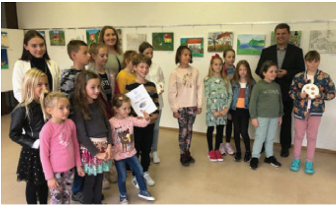
Udeleženci 4. Mini palete na Polzeli

Likovna sekcija Kulturno-umetniškega društva (KUD) Polzela je letos že četrty organizirala Mini paleta 2022. Gre za likovno tekmovanje, prvenstveno namenjeno ustvarjalnosti in likovnemu spodbujanju osnovnošolskih otrok. Mini paleta je projekt, ki se je v štirih letih razvil v izjemno lep dogodek, na katerega se otroci iz več krajev Slovenije z veseljem prijavljajo. Poteka v mesecu oktobru.