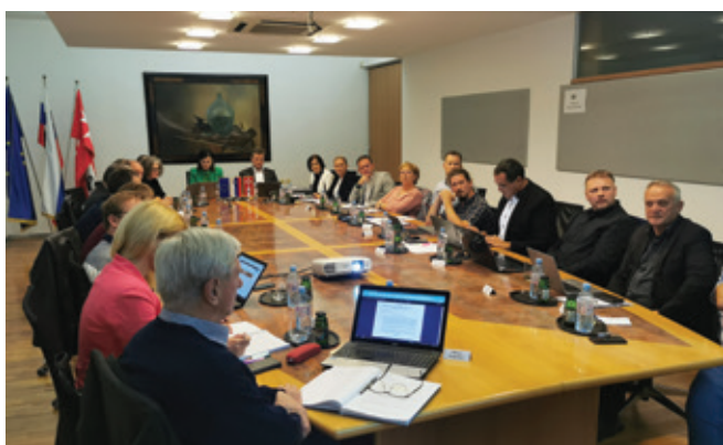
Z zadnje seje Občinskega sveta Občine Polzela

Polzelski svetniki so se v torek, 18. oktobra 2022, zbrali na 28. redni seji, ki je bila obenem tudi zadnja seja v tokratni sestavi. Na dnevnem redu je bilo deset točk. Osrednja pozornost je bila namenjena drugemu rebalansu proračuna.