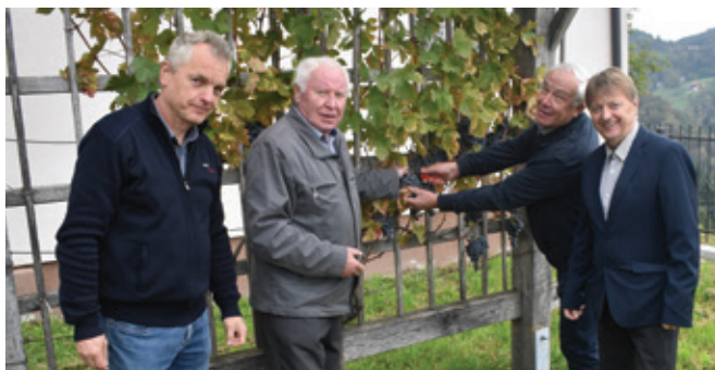
Ob potomki najstarejše trte pri župnišču v Andražu nad Polzelo

Tudi v Andražu nad Polzelo imamo potomko najstarejše trte na svetu, in sicer modre frankinje, ki je bila posajena pri župnišču leta 2009.