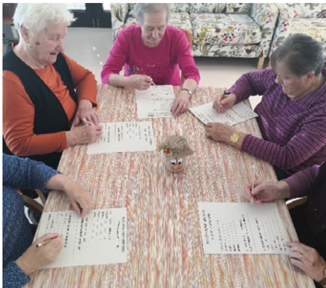
Delovni terapevti na različne načine skrbijo za aktivnost stanovalcev.

Že več kot 55 let poznamo poklic delovnega terapevta, pa vendar nas še vedno redki poznajo. Verjetno tudi zato, ker delovni terapevti praviloma ne delujemo na primarni ravni, bolj na sekundarni in terciarni, kar pomeni, da nas spoznajo le tisti, ki nas nujno potrebujejo. In potem v zgornjem naslovu navedeni moto še kako drži.