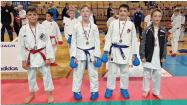
Nino je zmagal v zelo močni konkurenci.

V soboto, 8. oktobra 2022, je v Športni dvorani v Šenčurju potekala tretja pokalna tekma pod okriljem Karate zveze Slovenije.