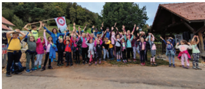
Zabaven pohod s pestrim programom

V nedeljo, 2. oktobra 2022, smo se mladi planinci OŠ Polzela in POŠ Andraž podali na prvi planinski pohod v tem šolskem letu.