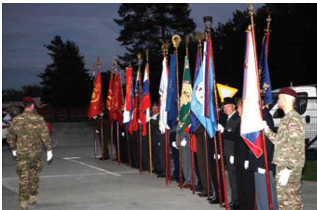
Praporščaki so nepogrešljivi del vsake slavnostne prireditve.