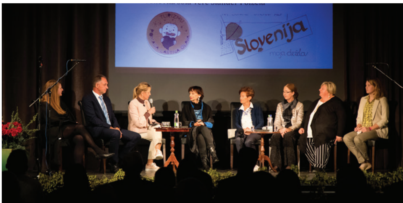
Okrogla miza o turizmu na Polzeli v preteklosti in danes