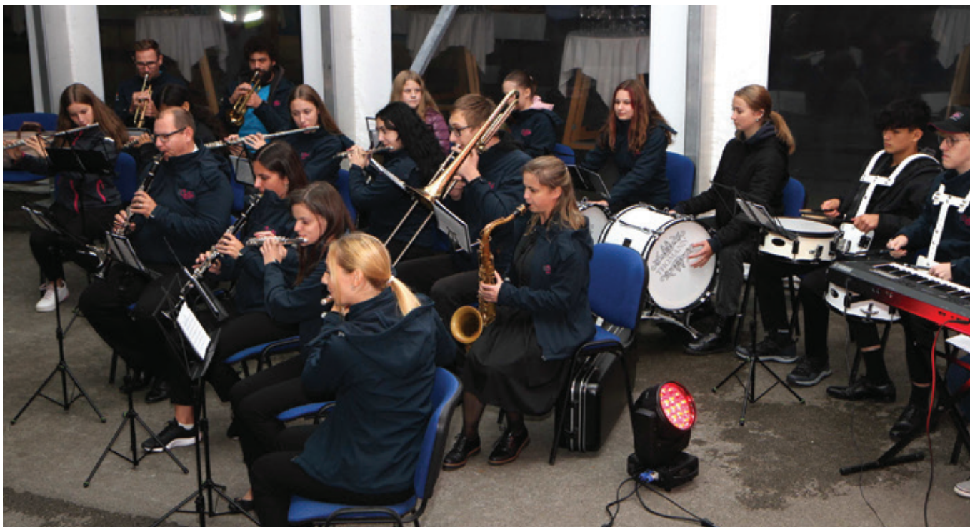
Pihalni orkester Cecilija