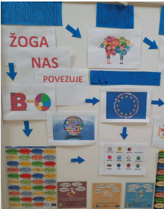
Žoga – letošnji jezikovni izziv.

Žoga je beseda, ki nas je navdihnila ob dnevu jezikov, da smo jo podrobneje spoznali. Je športni pripomoček, ki združuje ljudi ne glede na to, kateri jezik kdo govori.