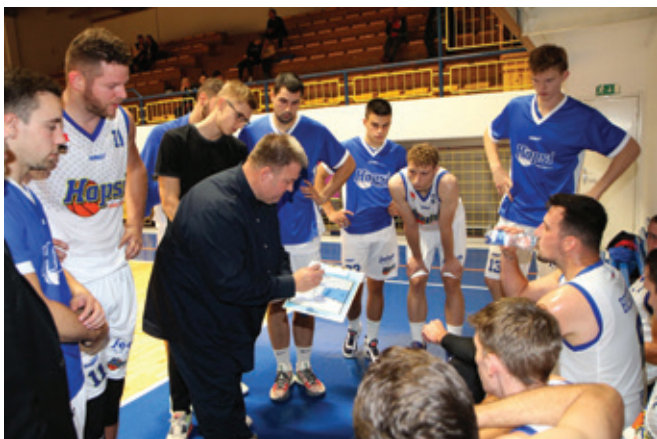
Posvet na klopi

Hopsi so v petek, 21. oktobra 2022, v domači dvorani lovili prvo zmago v sezoni v 4. kolu košarkarske Lige Nova KBM proti ekipi Rogaška, ki pa so jo gostje po podaljšku dobili z rezultatom 83 : 87.