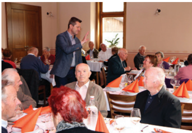
Z družabnega dela srečanja