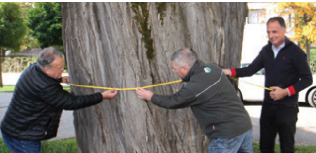
S svojim obsegom 556 cm je robinija pri cerkvi Sv. Marjete najdebelejša v Sloveniji.

Mogočna robinija v centru Polzele je svojevrsten spomenik. Robinija, ki dobro uspeva pred cerkvijo Svete Marjete v centru Polzele, je za to hitro rastočo vrsto, ki večinoma ne dosega niti visokih starosti niti debelin, zelo vitalna in mogočna. Zato zbuja še dodatno pozornost.