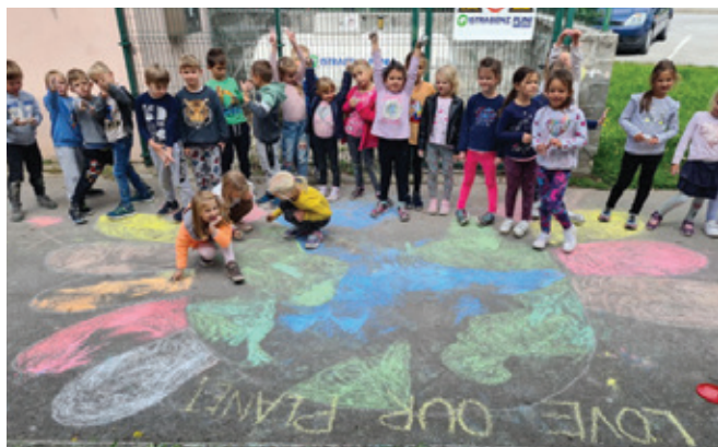
Trajnostna mobilnost za lepšo prihodnost

Evropski teden mobilnosti (ETM) pod geslom »Trajnostno povezani« je tudi v tem šolskem letu med 16. in 22. septembrom 2022 vpeljal v naš vrtčevski in šolski vsakdan precej zanimivih dejavnosti.