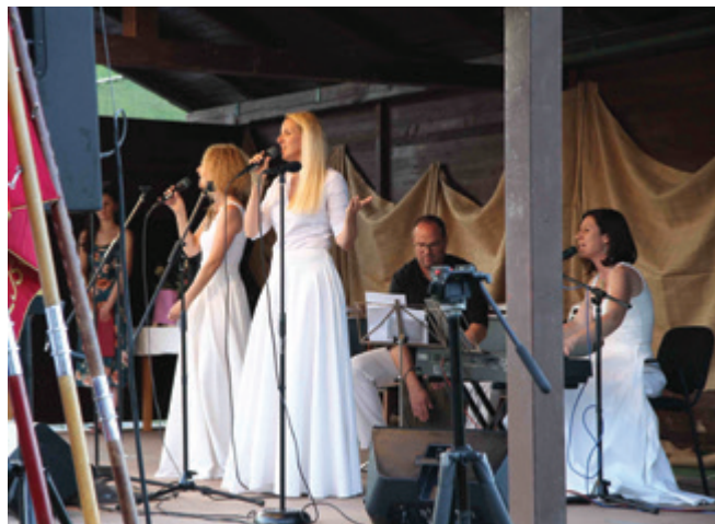
Slovesnost so popestrile pevke skupine Katrinas.