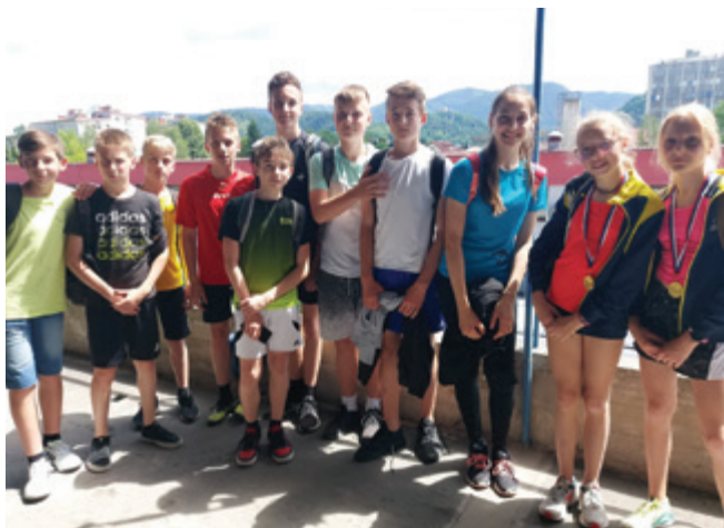
Atleti na področnem tekmovanju

15 učencev naše šole se je v torek, 31. maja 2022, udeležilo atletskega tekmovanja, ki je potekalo na stadionu Kladivar v Celju.