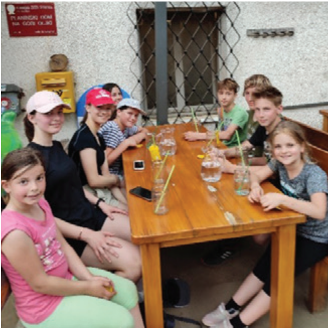
Mladi pohodniki pri domu na Gori Oljki (KT3) med počitkom

Društvo upokojencev Andraž je v soboto, 21. maja 2022, pripravilo tradicionalno 13. rekreacijsko akcijo »12 ur pohodov na Goro Oljko«. Gre za organiziran krožni pohod od startne točke (kontrolna točka KT1), ki je pri kapeli v Hotunjah, mimo kontrolnih točk na vrh Gore Oljke in po drugi poti nazaj do startne točke. Cilj je, da vsak posameznik v 12 urah opravi čim večkrat to pot. Akcija nima tekmovalnega značaja in nobenih starostnih omejitev, temveč vsakdo hodi po svojih željah in sposobnostih.