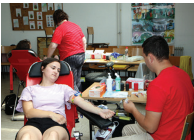
Krvodajalci pri odvzemu krvi v veroučni učilnici Župnije Polzela

Junija letos je žalsko območno združenje Rdečega križa v sodelovanju s prostovoljci krajevnih organizacij Rdečega križa Prebold, Polzela in Vransko organiziralo kar tri krvodajalske akcije. V Hotelu Prebold se je akcije 9. junija 2022 udeležilo 84 krvodajalcev, v veroučni učilnici Župnije Polzela 22. junija 2022 65 in v Kulturnem domu Vransko 23. junija 2022 90 krvodajalcev.