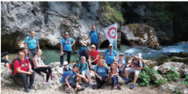
Mladi planinci PD Polzela z mentorico in vodniki

Komaj smo čakali, da se bomo vrnili na prireditveni prostor in se udeležili vabljenih delavnic. Ogljedali smo si reševanje ponesrečenca s padalom, ki je ostal na drevesu, delavnico prve pomoči, izdelovali smo zapestnice in si ogledali delovanje električnega kolesa. Ker je letos 100-letnica Knafelčeve markacije, smo si naredili tatu tega znaka.