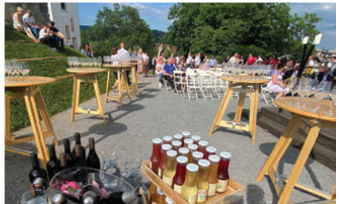
Dvorišče gradu Komenda je kot nalašč za poroke.

Moj moto je zadovoljen gost, ki bo pri nas preživel lepe trenutke, spoznal polnost okusov kulinarčne poezije, se sprostil v čudovitem ambientu grajskih zidov ali na lepih zunanjih terasah, ki ponujajo čudovite razglede. Želim si, da bi se gostje z veseljem vračali in nas priporočali.