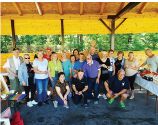
Udeleženci likovne kolonije Poletno tihožitje

Na pragu poletja, v soboto, 4. junija 2022, je likovna sekcija Kulturnega društva Andraž nad Polzelo izvedla likovno kolonijo z naslovom Poletno tihožitje.