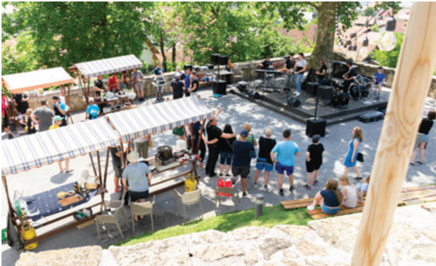
Pasuljada na dvorišču gradu Komenda

V nedeljo, 12. junija 2022, je Mladinsko društvo Polzela v sodelovanju s TIC Polzela in Občino Polzela na dvorišču gradu Komenda organiziralo srečanje kuharic in kuharjev pasulja. Tekmovanja se je udeležilo osem kuharskih ekip, ki so svoje pasulje pozneje tudi razdelile med občanke in občane ter s tem poskrbele za okusno nedeljsko kosilo.