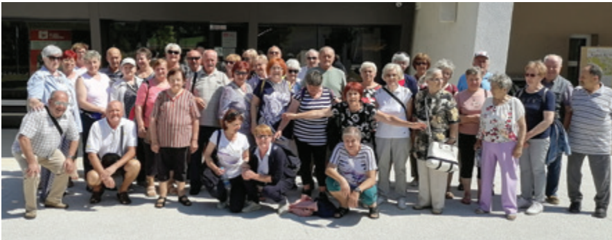
Pred muzejem Lojzeta Slaka in Toneta Pavčka

V sredo, 15. junija 2022, smo bili člani Društva upokoјencev Polzela na strokovni ekskurziji v Beli krajini.