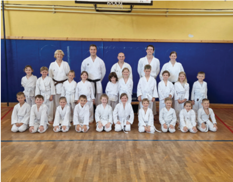
Skupina HU-HA po končanem izpitu

V petek, 10. junija 2022, so karateisti Karate kluba Polzela opravljali izpite za višje pasove. 75 jih je uspešno opravilo izpit in prejelo višji pas.