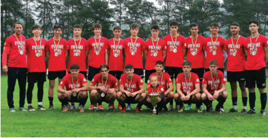
Kadetski prvaki Medobčinske nogometne zveze Celje