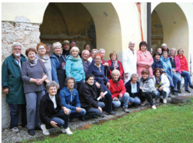
Udeleženci pete likovne kolonije Novi Klošter

V soboto, 28. maja 2022, je v Novem Kloštru v Založah pri Polzeli potekala peta likovna kolonija Novi Klošter, prvič mednarodna, na temo »Plečnik in arhitektura mojega kraja«. Vreme ni bilo najprijetnejše, vendar vztrajnih in optimističnih ljubiteljskih slikarjev to ni motilo. Med 48 ustvarjalci iz mnogih krajev Slovenije je bilo devet udeležencev iz Hrvaške, Madžarske, Mehike in Francije.