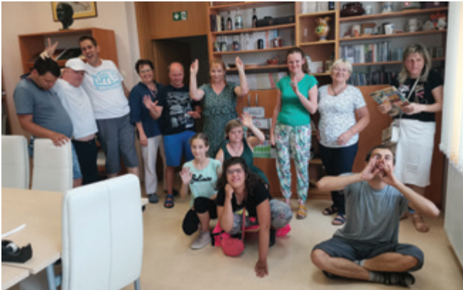
Člani Sožitja Žalec knjižnico redno obiskujejo.

Druženja s člani Sožitja Žalec, ki v žalsko knjižnico prihajajo poslušati zgodbe, so bila to sezono krajša, saj v obdobju številnih prepovedi zaradi covid-19 niso prihajali. Kljub temu pa je bilo vsako druženje posebno zaradi izbranih zgodbic, ustvarjanja in navihanih pogovorov, ki jih sprožajo predvsem fantje, a se jim tudi dekleta rada smejejo.