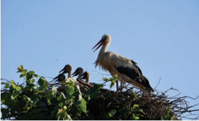
Paru štorkelj so se pridružili štirje mladiči.

Točno 1. aprila 2022 se je na Polzelo v svoje gnezdo na lipo vrnil par štorkelj. Ob prihodu sta štorklji uredili in obnovili svoje gnezdo, kmalu pa so se jima pridružili še štirje člani družine, ki so s svojim nadobudnim oglašanjem več kot očitno opozorili nase.