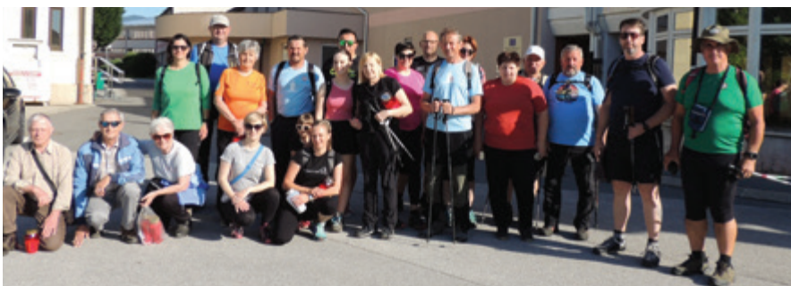
Zbor na parkirišču pri Občini Polzela