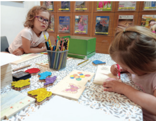
Spodbujanje ustvarjalnosti na pravljичni uri

V četrtek, 19. maja 2022, so najmlajši obiskovalci knjižnice dan pred počastitvijo svetovnega dneva čebel prisluhnili pravljici v Občinski knjižnici Polzela.