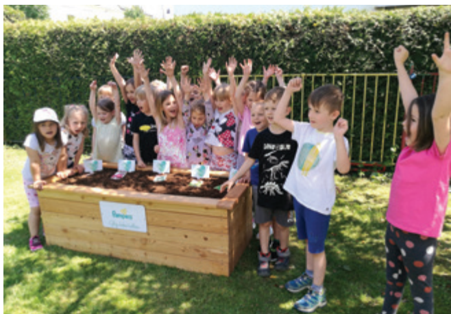
Sejemo in sadimo v visoke grede.

Vrtec Polzela je bil na razpisu Pampers »Glej, kako rastem« med 98 prijavljenimi vrtci po izboru komisije izbran med 20 vrtcev, ki so prejeli visoko gredo za igro in učenje ter spodbujanje osnovnih načel samooskrbe.