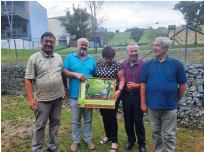
Predaja darila ob občinskem prazniku Občine Destrnik

Občina Destrnik je praznovala občinski praznik in v ta namen izvedla več dejavnosti na športnem in kulturnem področju.