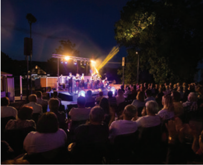
Grajsko dvorišče na gradu Komenda nudi prijeten ambient za organizacijo dogodkov vseh vrst.

še nekatera druga dovoljenja, kot so npr. dovoljenje za zaporo ceste (izda pristojni organ občine oziroma Direkcija RS za infrastrukturo); dovoljenje za uporabo zrakoplova na prireditvi (izda Javna Agencija za civilno letalstvo RS); dovoljenje za začasno ali občasno čezmerno obremenitev okolja na prireditvi, kjer se uporabljajo zvočne ali druge naprave, ki povzročajo čezmeren hrup, kot je npr. glasna glasba (izda pristojni organ občine ali Ministrstvo za okolje in