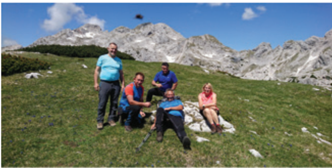
Pohodniki Športnega društva Andraž

Z vzhoda so že kukali prvi jutranji sončni žarki, ko smo se pohodniki planinske sekcije Športnega društva Andraž odpravili na Lučkega Dedca (2023 metrov).