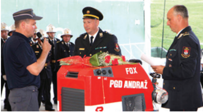
Z novo motorno brizgalno, ki so jo člani PGD Andraž predali svojemu namenu.

Praznovanje dneva gasilcev Gasilske zveze (GZ) Žalec je bilo v soboto, 18. junija 2022, združeno s praznovanjem 50 let delovanja Prostovoljnega gasilskega društva (PGD) Andraž nad Polzelo in prevzemom nove motorne brizgalne znamke Rosenbauer Fox, potekalo pa je na Športnem igrišču v Andražu nad Polzelo. Po dveh letih okrnjenih prireditev je bila ta letos izvedena v enakem obsegu kot pred epidemijo. Prisotnih je bilo več kot 400 gasilk in gasilcev.