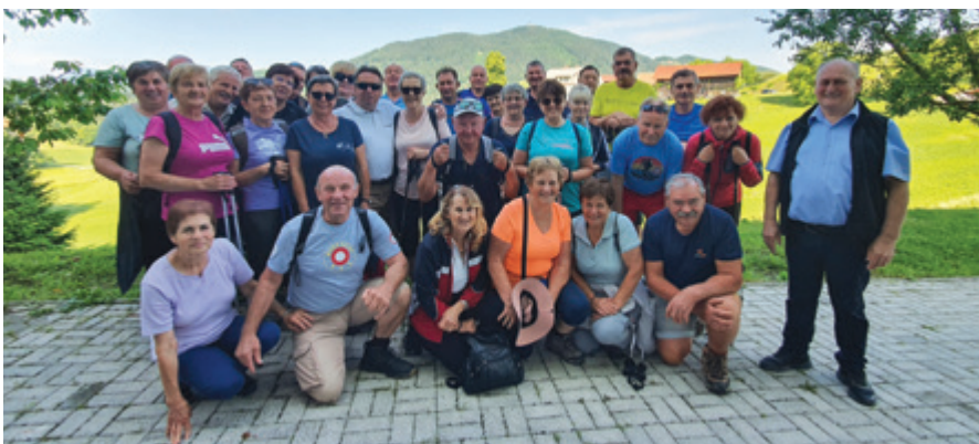
Pohodniki društev upokojencev Andraž in Sv. Urban Destrnik

Društvo upokojencev Andraž že več let dobro sodeluje z Društvom upokojencev Sv. Urban Destrnik. Srečujemo se na občnih zborih, športnih tekmovanjih in pohodih.