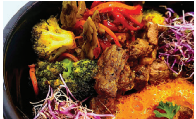
Zaključenim skupinam in gostom na porokah bodo nudili osnovni meni, ki ga bodo prilagajali tudi glede na želje slavlencev in gostov.