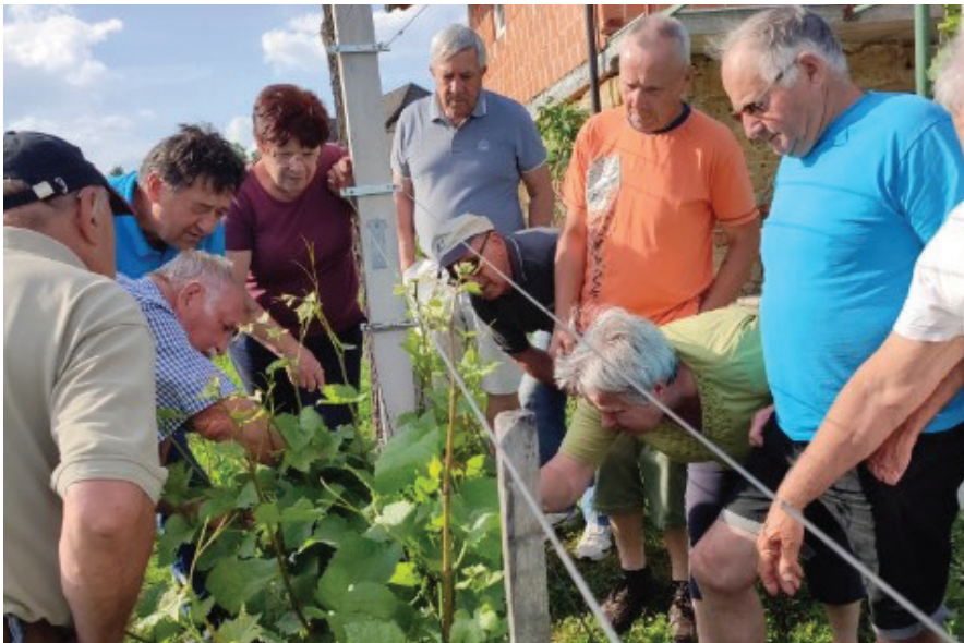
Pletev vinske trte

25. maja 2022 je imel upravni odbor Društva upokojencev Andraž s člani nadzornega odbora, častnega razsodišča in poverjeniki drugi redni sestanek, združen z izobraževanjem.