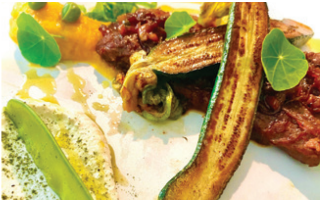
Jedilni list bo prilagojen letnemu času in svežim sezonskim sestavinam. Večina hrane bo sezonske, sveže in ekološke.

Jedilni list bo prilagojen letnemu času in svežim sezonskim sestavinam. Kot sem že omenil, bo večina hrane sezonske, sveže in ekološke. Želimo si restavracije s čim manj odpadki, brez plastike. Zaključenim skupinam in gostom na porokah bomo nudili naš osnovni meni, ki ga