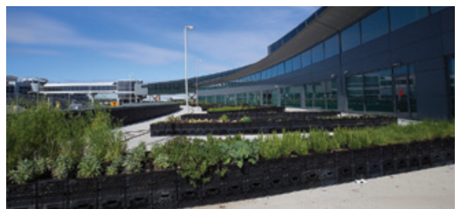
Urbani vrt na letališču JFK v New Yorku

V velikih mestih se vse bolj širi mestno vrtnarjenje (angl. urban farming), ki nekaterim pomeni povsem nov