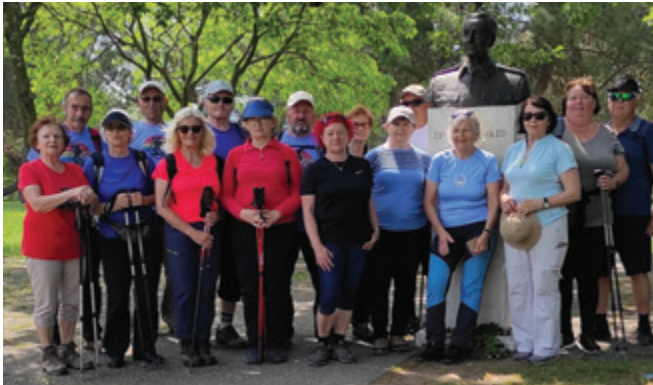
Ob spomeniku Alešu Beblerju - Primožu

V petek, 13. maja 2022, se nas je 19 pohodnikov v sklopu Planinskega društva Polzela in Društva upokojencev Polzela odpravilo na pohod po zanimivi krožni poti, ki nas je vodila iz središča Ankarana na Črni Vrh, Hrvatine, Božice in čez Samotarski hrib spet nazaj proti morju. Od tam se nam je razprl čaroben pogled na Luko Koper in obalo Sv. Katarine z naravnim parkom.