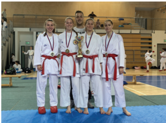
Zmagovalna ekipa s trenerjem

V nedeljo, 12. junija 2022, je v športni dvorani ŠIC Ljutomer potekalo ekipno državno prvenstvo v karateju.