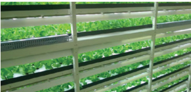
Robotska tovarna solate na Japonskem

Druga plat urbanega kmetijstva pa so tako imenovane tovarne zelenjave, katerih glavni namen je ustvarjanje dobička. Te tovarne zelenjave so najbolj dovršena kmetijska pridelava, ki v tem trenutku obstaja. V njih je vsak proces računalniško podprt, če že ne v celoti voden. V tovarnah zelenjave se zbira ogromna količina podatkov (o rastnih razmerah, porabi energentov in gnojil ...), ki se analizirajo in obdelujejo z različnimi modeli strojnega učenja. Vse to zbiranje in obdelava podatkov je namenjeno optimiziranju »receptov« za gojenje rastlin. Lahko bi tudi rekli, da s pomočjo vseh senzorjev, ki so nameščeni v teh tovarnah zelenjave, digitalizirajo fiziološke procese gojenih rastlin.