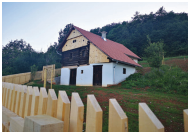
Slavnostno odprtje obnovljene rojstne hiše Neže Maurer bo septembra 2022.

Člani občinskega sveta Občine Polzela so leta 2001 sprejeli odlok o razglasitvi rojstne hiše pesnice in pisateljice Neže Maurer za kulturni spomenik lokalnega pomena z lastnostmi etnološkega spomenika. Občina Polzela se je obnove, vredne nekaj manj kot 217.000 evrov, lotila takoj, ko je zanjo lani na razpisu prejela nepovratni denar. Ministrstvo za kulturo ter ministrstva za kmetijstvo, gozdarstvo in prehrano v sklopu Lokalne akcijske skupine Spodnje Savinjske doline so za naložbo prispevala 139.000 evrov. Preostanek denarja, torej nekaj manj kot 78.000 evrov, je Občina Polzela zagotovila v proračunu.