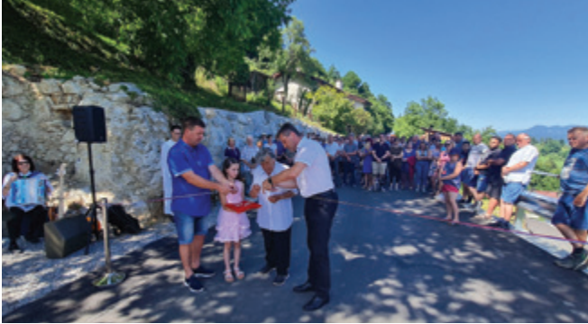
Odprtje za krajane pomembnega odseka v prijetnem vzdušju.

V nedeljo, 19. junija 2022, popoldne so se v Dobriču v senci košatega oreha v bližini lepo obnovljenega Krašovčevega križa zbrali krajanje Dobriča na odprtju nove asfaltirane ceste skozi Dobrič. Zaradi strmega in skalnatega terena je ta odsek v dolžini 1300 metrov najzahtevnejši odsek, kar se je pokazalo tudi med gradbenimi deli z nekaj zapleti. V skupno zadovoljstvo so bila vsa dela uspešno končana in cesta skozi Dobrič je zdaj varnejša in udobnejša za uporabnike.