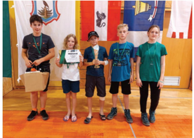
V kategoriji B so učenci osvojili odlično drugo mesto.

V nedeljo, 22. maja 2022, je bilo na območju med Taborom in Preboldom slovensko planinsko orientacijsko tekmovanje, na katero se je uvrstila tudi ekipa učencev iz naše šole.