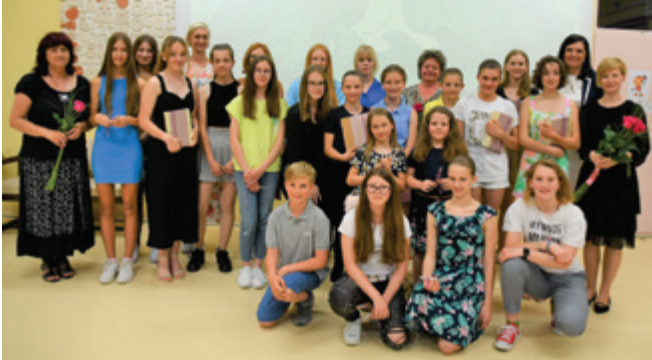
Nastopajoči na literarnem večeru z mentoricami

»Pridi, dala ti bom pesem« je bil krovni naslov letošnjega literarno-glasbenega večera učencev OŠ Polzela, ki je potekal v sredo, 1. junija 2022, v avli Osnovne šole Polzela.