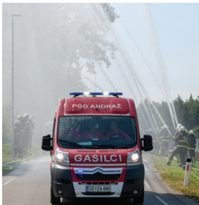
Gasilski vodni špalir