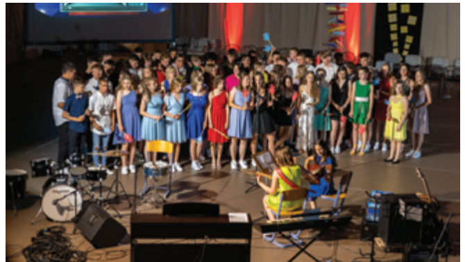
Valeta letnika 2007

V sredo, 15. junija 2022, se je v športni dvorani OŠ Polzela ob peti uri popoldne začela valeta letnika 2007.