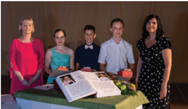
Dobitniki zlatih priznanj