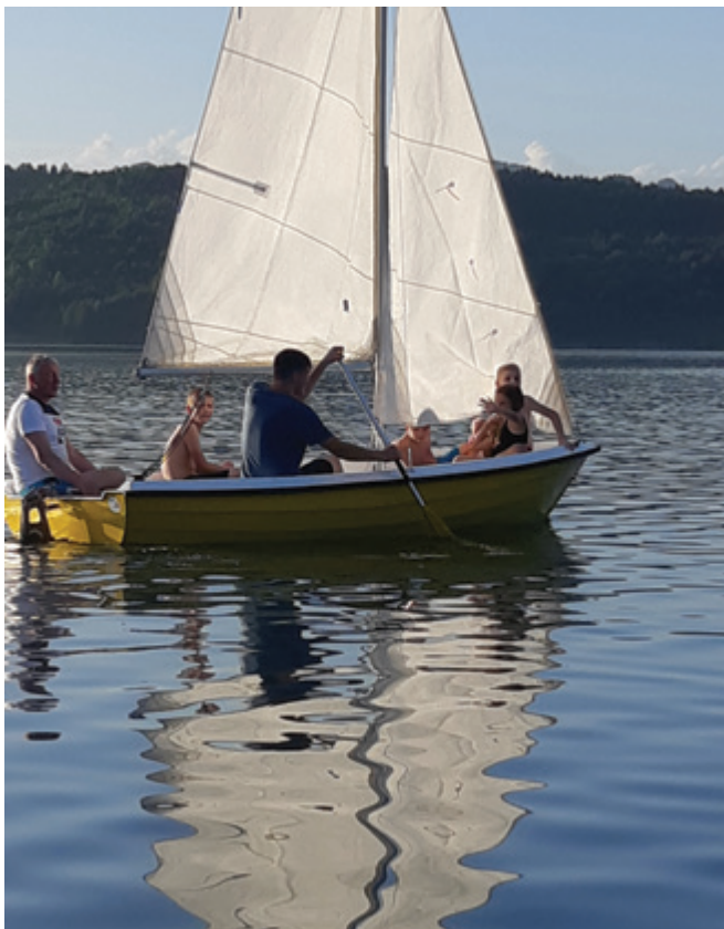
Osvajanje prvih jadralskih veščin

Junija smo se člani Jadralnega društva Maltezer na Velenjskem jezeru družili s člani kluba vodnih športov iz Velenja. Srečanje smo izkoristili tudi za izvajanje strokovnega izobraževanja za osnovnošolce.