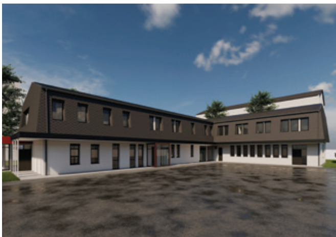
Idejna zasnova prenove

25. julija 2022 se je začela energetska sanacija Zdravstvenega doma na Polzeli, ki bo zajemala izvedbo toplotnoizolacijske fasade, zamenjavo stavbnega pohištva, toplotno fasado ostrejšja in zamenjavo strešne kritine.