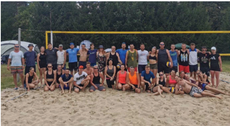
Udeleženci odbojarskega turnirja

V Društvu zYpper smo v soboto, 9. julija 2022, pripravili že drugi turnir odbojke na mivki v Občini Polzela, natančneje na Bregu pri Polzeli.