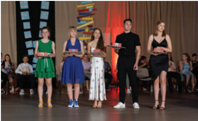
Dobitniki srebrnih priznanj