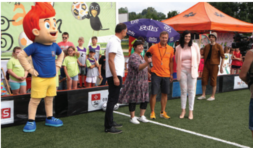
Žogarija bo na sporedu v nedeljo, 30. oktobra 2022, na TV Slovenija 2.

Na športnem igrišču Polzela je 22. junija 2022 dopoldne potekal finale otroške športno-razvedrilne prireditve Žogarija. Na Polzelo so prišli zmagovalci lanskih dogodkov: Osnovna šola Ivanjkovci, Osnovna šola Dušana Semedela Koper, Osnovna šola Notranjskega odreda Cerknica, Osnovna šola Sostro, Osnovna šola Murska Sobota III, Osnovna šola Ob Rinži Kočevje in kot šola gostiteljica Osnovna šola Polzela. Bilo je veselo in aktivno. Žogarijo je posnela RTV Slovenija