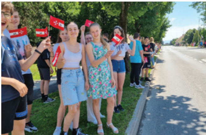
Športno navijanje vrtca in šole

Tadej Pogačar in drugi izjemni kolesarji so 17. junija 2022 poskrbeli, da smo na OŠ Polzela komaj čakali na čas, ko se bomo lahko postavili na rob ceste skozi Polzelo in dočakali, da se mimo nas odpelje celotna karavana spremljevalnih vozil in kolesarjev.