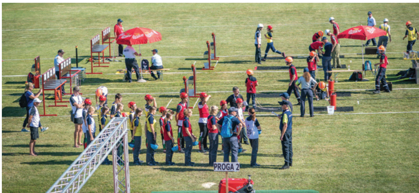
Uradni trening 21. julija 2022

Zgornji stavek poseblja resnični olimpijski duh in so ga na lastni koži izkusile mladinke iz PGD Andraž, ki so se že večkrat izkazale na najrazličnejših tekmovanjih z izvrstnimi rezultati. Ti so jim prinesli sodelovanje na Gasilski olimpijadi Celje 2022, ki je bila od 17. do 24. julija 2022.