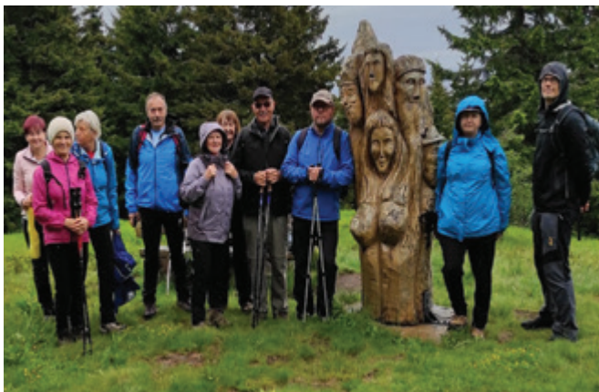
Na Košenjaku ob leseni skulpturi

V petek, 10. junija 2022, se nas je zbralo 11 članov Planinskega društva Polzela in pohodniške sekcije pri Društvu upokojencev Polzela pred občinsko stavbo na Polzeli. Odpravili smo se proti Dravogradu. Naš pohod bi se moral začeti na parkirišču pri cerkvi sv. Janeza na Ojstrici. Pot bi nadaljevali proti bivaku Piramida in naprej proti vrhu ob meji z Avstrijo, vendar smo se zaradi slabega vremena peljali do planinskega doma na Košenjaku.