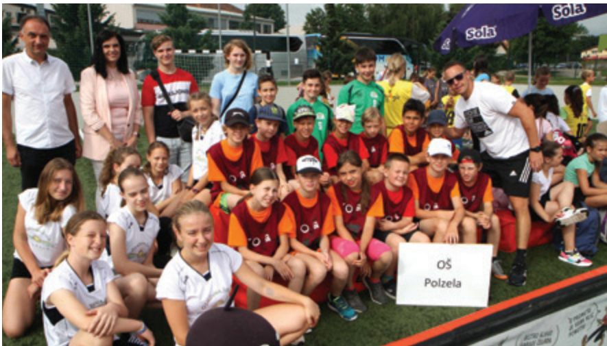
Osnovna šola Polzela je bila deležna številnih pohval za odlično organizacijo.