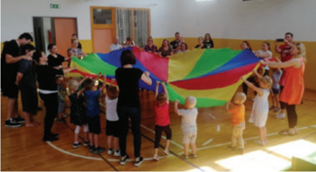
Andraški konec vrtca

V začetku junija smo v vrtec povabili otroke in njihove starše.