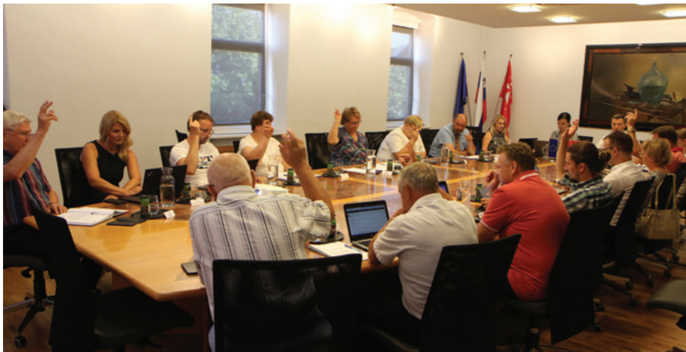
Na zadnji seji občinskega sveta