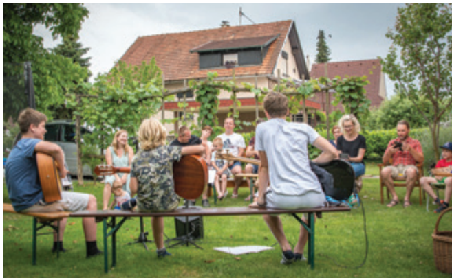
Z nastopa ob zaključku glasbene delavnice