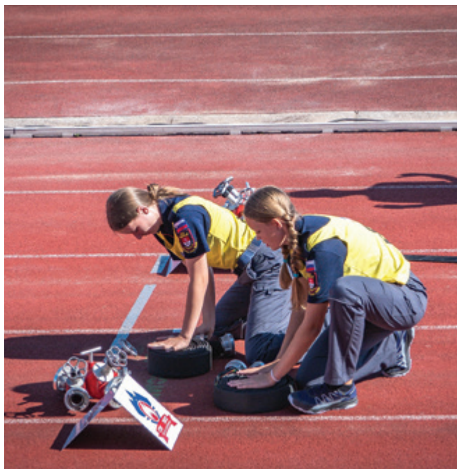
Prava kombinacija kondicije, vztrajnosti in športne sreče pri izvajanju vaj prinese odličen rezultat.