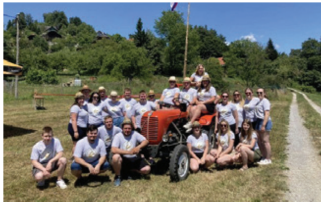
Tekmovalci prvih kmečkih iger v Založah

V nedeljo, 3. julija 2022, smo v okviru Društva podeželske mladine Polzela organizirali prve kmečke igre. Dogodek se je začel ob 14. uri na jezeru Tajht v Založah.