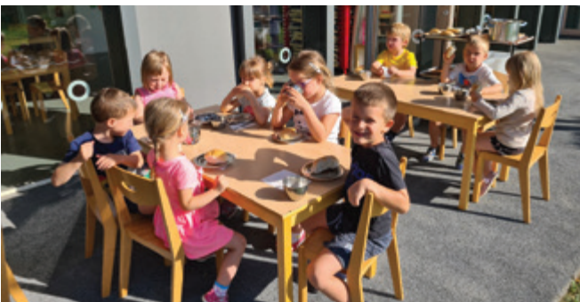
Zajtrk na vrtčevski terasi

Juhuu, uradni del leta smo končali, zdaj pa je čas za zabavo.