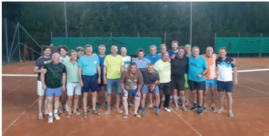
Ekipi Polzele in Športnega društva Trnovo

Tradicija se nadaljuje, zato smo se tokrat zbrali na Polzeli in v goste povabili teniške prijatelje iz Športnega društva Trnovo. Vsaka ekipa je sestavila šest parov. Velika želja po zmagi me je vodila k temu, da sestavim najmočnejšo ekipo do zdaj.