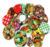
Pokrovi 82mm 10/1 1,60€