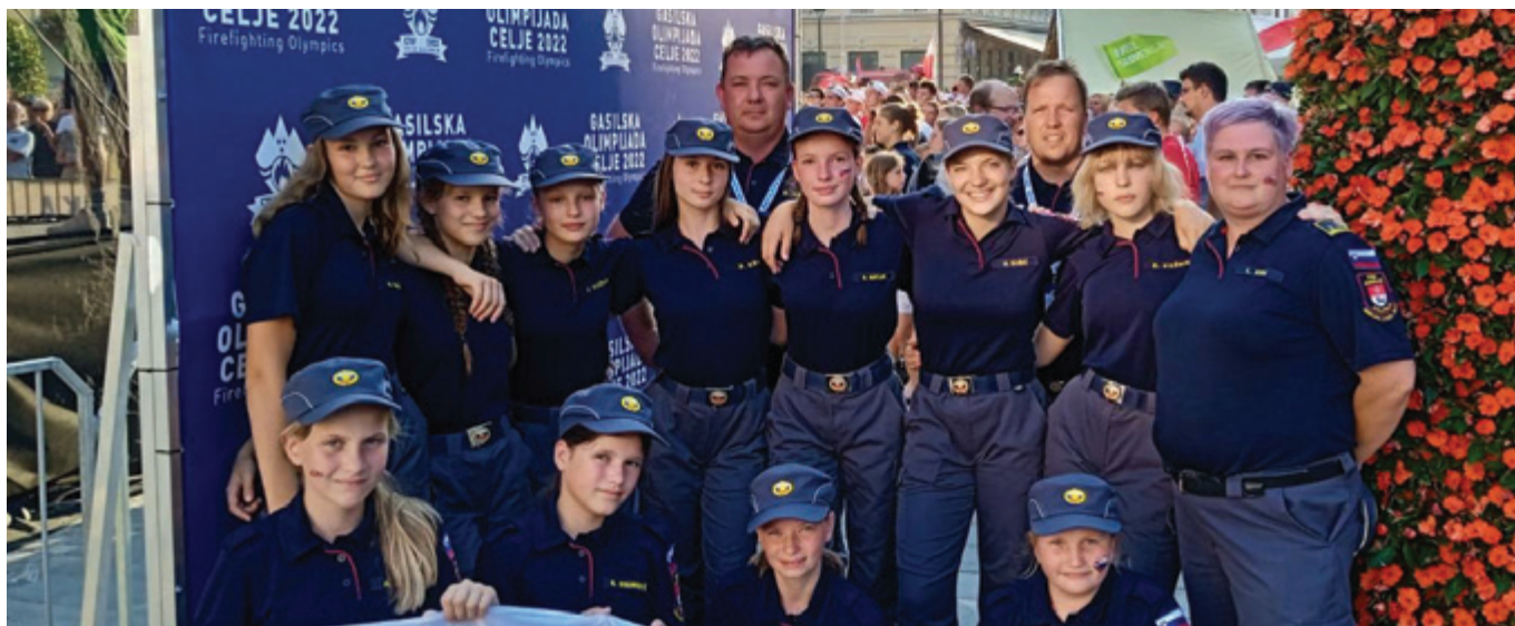
Popolna postava z gasilske olimpijade