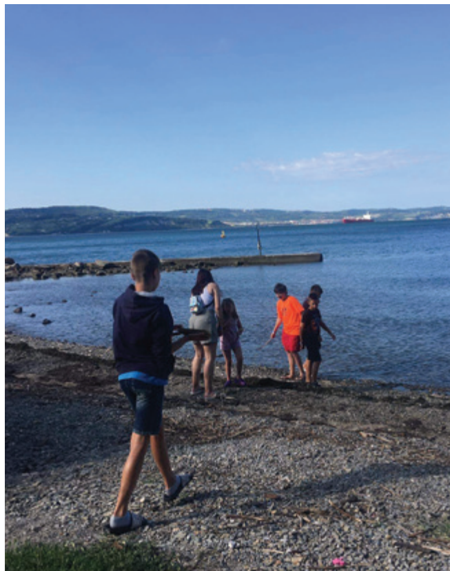
Občina Polzela vsako leto sofinancira letovanje otrok.