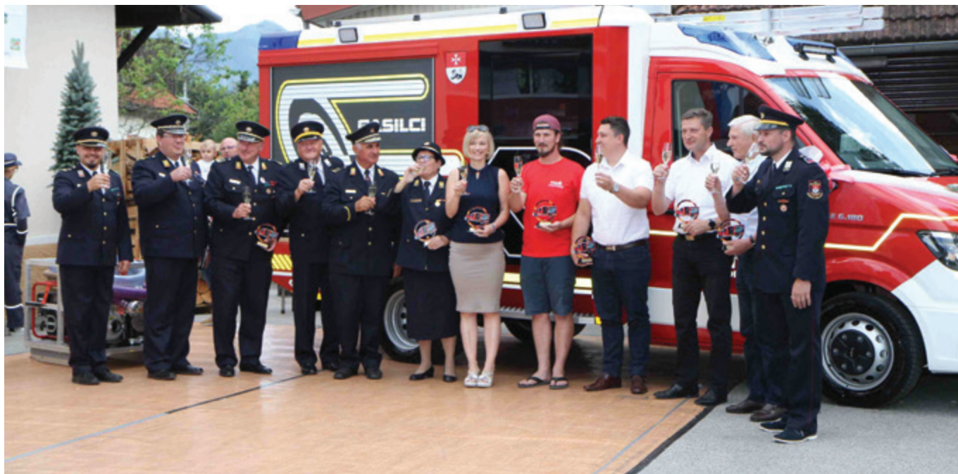
Ob novem gasilskem vozilu GV-1

Za gasilce Prostovoljnega gasilskega društva (PGD) Ločica ob Savinji je bila sobota, 9. julij 2022, pomemben dan, saj so namenu predali novo gasilsko vozilo GV-1.