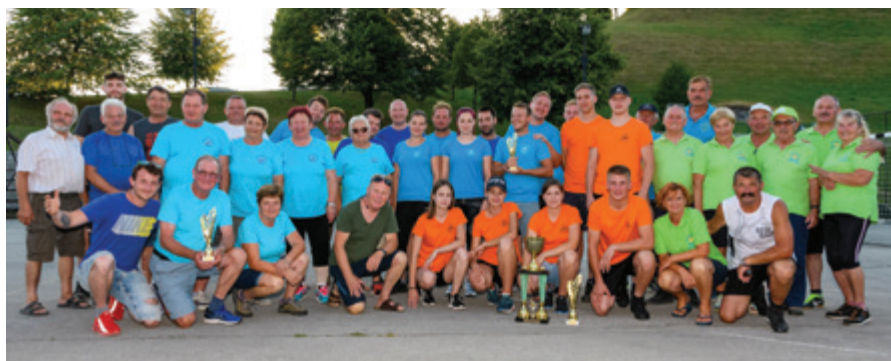
Sodelujoči tekmovalke in tekmovalci

Športno društvo Andraž praznuje svoj praznik 29. junija. To je dan, ko je svoj praznik praznovala nekdanja Krajevna skupnost Andraž nad Polzelo in spominja na leto 1942, ko je v zaselku Lovče potekal prvi strelski spopad druge svetovne vojne na območju Andraža nad Polzelo in Dobriča.