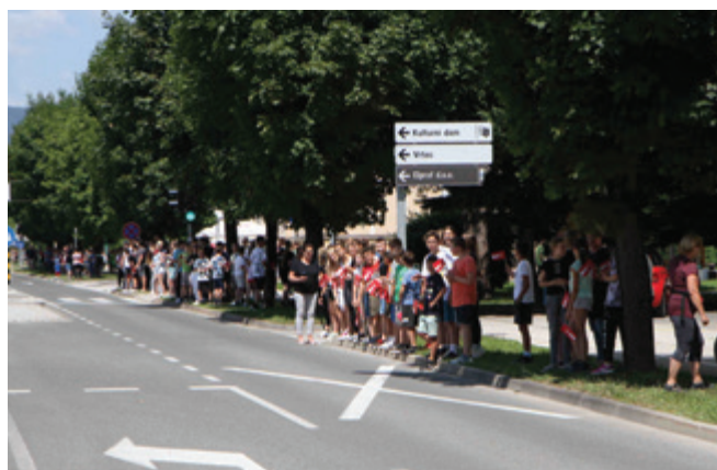
Vzdušje ob trasi je bilo športno in navijaško.

V sklopu priprave na dirko smo na TIC Polzela pripravili napovedni članek v Polzelanu, navijačem iz Osnovne šole Polzela smo priskrbeli navijaške zastavice z grbom občine, organizatorju dirke smo posredovali fotografije in napisali besedila za objavo na spletni strani dirke ter skupaj s soglasjem lastnika zemljišča posredovali podatke o lokaciji – grad Komenda, ki smo ga želeli izpostaviti v vnaprej posnetem posnetku Polzele iz zraka. Ker je bila dirka ves čas snemana tudi v živo, smo pričakovali, da bodo kamere posnele še več navijaškega dogajanja neposredno ob progi. Vendar so približno tri minute, kolikor so kolesarji kolesarili skozi Polzelo, hitro minile.