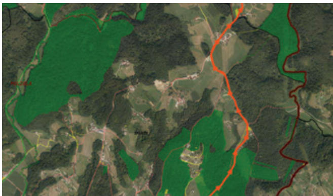
Občina se bo zadolžila za obnovo ceste Založe-Podsevčnik.

Svetniki Občine Polzela so se v sredo, 7. julija 2022, sestali na izredni seji. Po potrditvi dnevnega reda so obravnavali še tri točke.