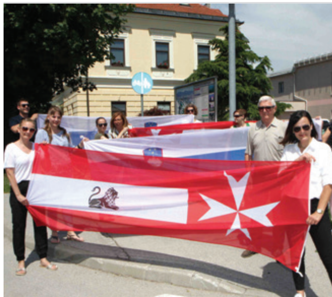
Glasno smo navijali za slovenske kolesarje.

V juniju so skozi Polzelo v sklopu kolesarske dirke »Po Sloveniji« kolesarili najboljši svetovni kolesarji s Tadejem Pogačarjem na čelu, ki je zmagal tako v tretji etapi (savinjski), kakor tudi v celotni dirki.