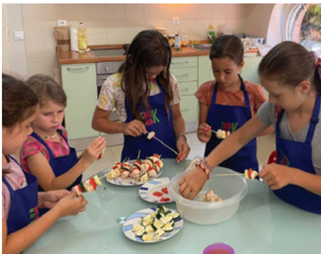
Delavnica kulinarike iz časa delovanja Kloštra

Zadnji teden junija je skupina 27 otrok šotorila na dvorišču graščine Novi Klošter. Program je bil obogaten s športom, igrami in druženjem ter kulturno povezan z zgodovino tega dvorca.