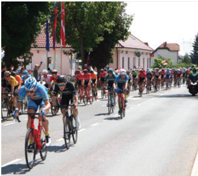
Najboljši kolesarji na svetu na dirki skozi Polzelo