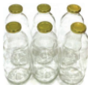
Steklenice Juice s pokrovom 6kom 4,90€