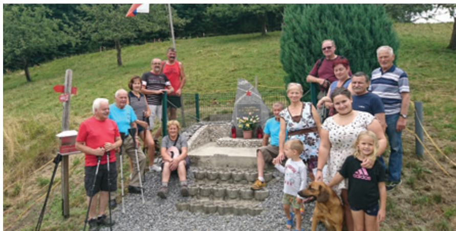
Ob spominskem obeležju na Lovčah

V soboto, 2. julija 2022, ob 7.30 smo se člani KO ZB za vrednote NOB Andraž in drugi, ki spoštujejo tradicije narodnoosvobodilnega boja, podali na pohod po spominskih poteh Andraža nad Polzelo.