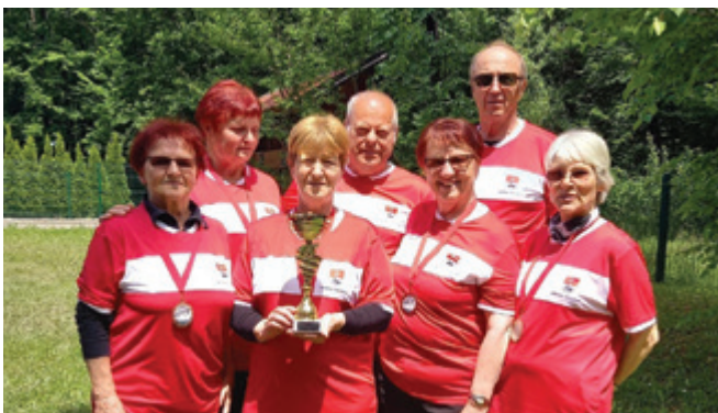
Uspešni balinarji DU Polzela so se uvrstili na državno prvenstvo.

Pozdravljeni vsi, ki prebirate glasilo Polzelan. V imenu športno aktivnih v Društvu upokojencev Polzela vas vabim, da se nam pridružite.