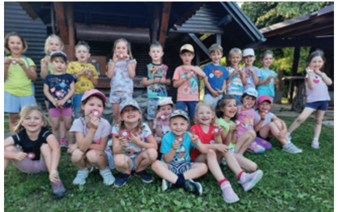
Naši najmlajši planinci

V Vrtcu Polzela in podružnici Andraž smo se v tem šolskem letu podali na tri pohode v sklopu interesne dejavnosti Ciciplaninci v Škratovem vrtcu, ki šteje kar 34 predšolskih otrok.