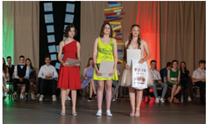
Dobitniki posebnih priznanj