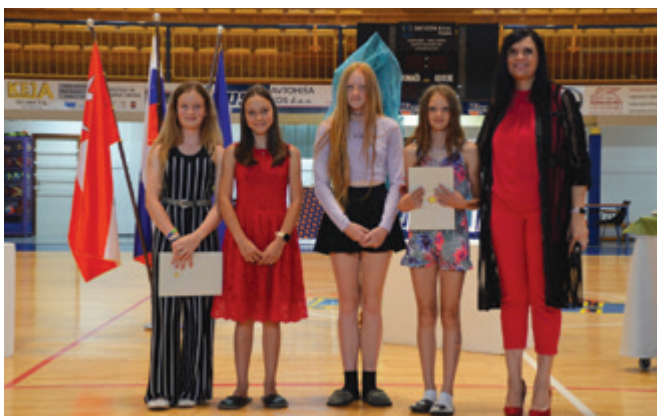
Uspešne šestošolke in glasbena točka tretješolk

Proslava ob dnevu državnosti s podelitvijo priznanj najuspešnejšim učencem.