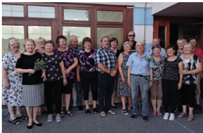
Gremo na počitnice!

V prvih dneh julija smo se srečali zadnjič v tem šolskem letu. Zaključek je bil lep in slovesen, saj končujemo že sedmo leto naših druženj.