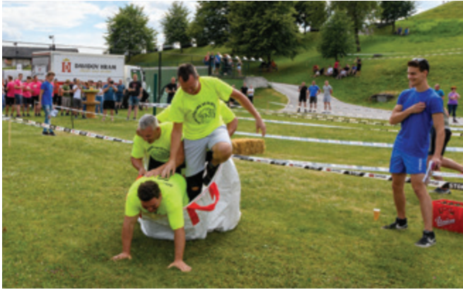
Pri vaji poskočni bigi bagi

V Andražu nad Polzelo je 9. julija 2022 v organizaciji Mladinske sekcije Andraž tradicionalno že šestič zapored potekal zabavni dogodek Biergajbenlauf.