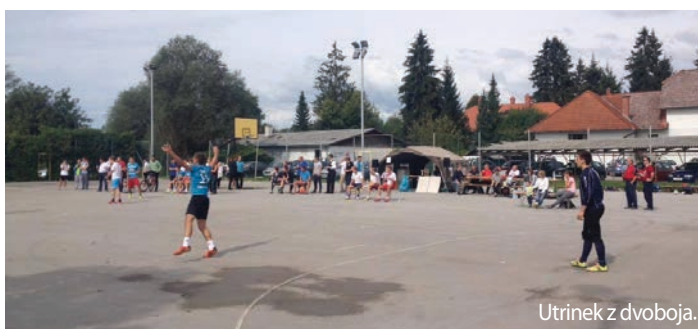
Utrinek z dvoboja.