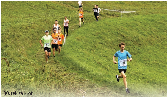
30. tek za krof.