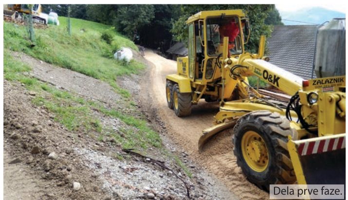
Dela prve faze.