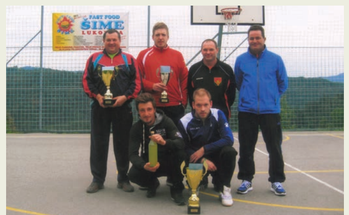
Vodje najboljših ekip so prejeli lepe pokale.