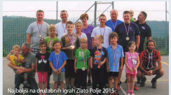
Najboljši na družabnih igrah Zlato Polje 2015.