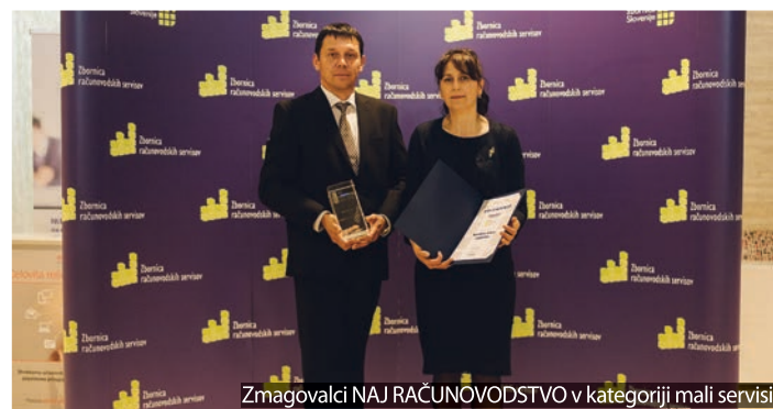
Zmagovalci NAJ RAČUNOVODSTVO v kategoriji mali servisi.