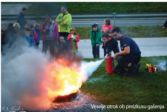
Veselite otrok ob preizkusu gašenja.

Z namenom informiranja in ozaveščanja je Gasilska zveza v sodelovanju z Upravo RS za zaščito in reševanje ter Slovenskim združenjem za požarno varstvo pripravila promocijsko gradivo, ki nudi več informacij o omenjeni tematiki. Natisnili so 100.000 zgibank za odrasle Evakuacija iz stanovanja, 5.000 tematskih plakatov, namenjenih otrokom in 100.000 zgibank za otroke ter še kup dodatnih tako ali drugače informativnih letakov, ki so ljudi informirali o požarni problematiki.