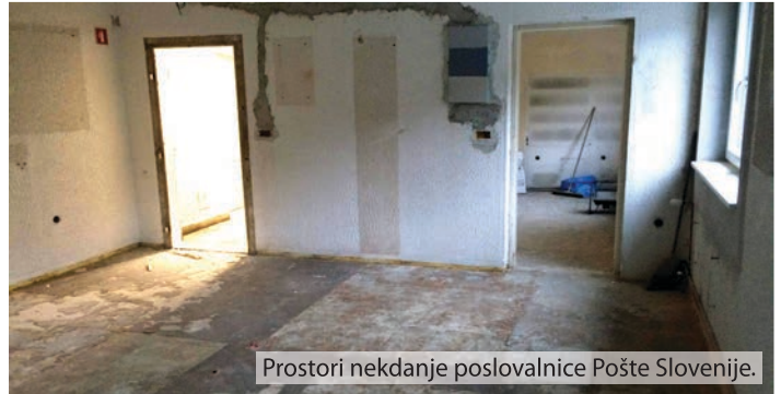
Prostori nekdanje poslovalnice Pošte Slovenije.