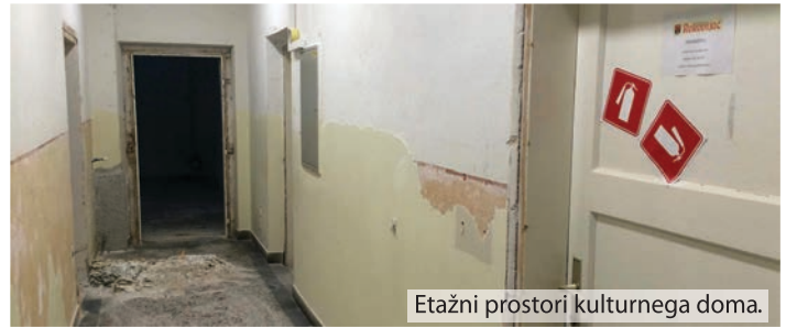
Etažni prostori kulturnega doma.