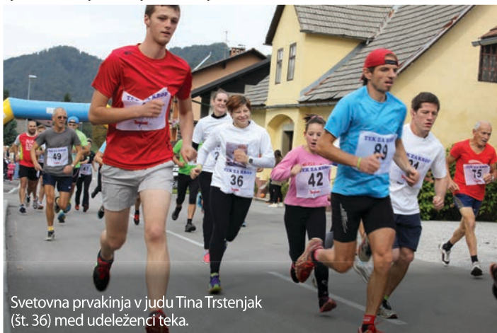
Svetovna prvakinja v judu Tina Trstenjak (št. 36) med udeleženci teka.