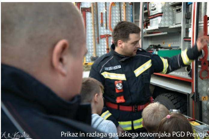
Prikaz in razlaga gasilskega tovornjaka PGD Prevoje.

"Letošnja tema meseca požarne varnosti je vsekakor pomembna v urbanih središčih in večjih mestih, v našem okolišju pa so večinoma enostanovanjske hiše. Kljub temu je pomembno, da poznamo evakuacijski plan in se znamo orientirati proti zbirni točki glede na stenske označbe, ki nam prikazujejo pot eva-