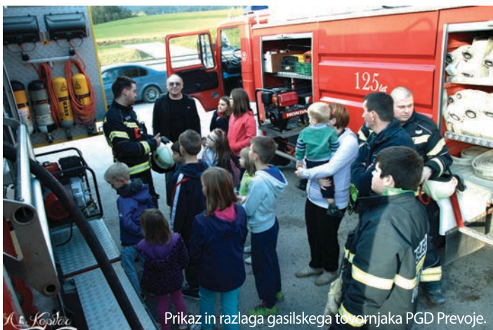
Prikaz in razlaga gasilskega tovornjaka PGD Prevoje.

V prostovoljnem gasilskem društvu Prevoje je v soboto, 17. oktobra 2015, potekal dan odprtih vrat, kjer so v sklopu meseca požarne varnosti opozorili na pomen evakuacije, ki jo ima le-ta za varnost in preživetje oseb, v primeru požara in drugih nesreč. Pripravili so predavanje na temo evakuacija, predstavitev gašenja z možnostjo samostojnega gašenja in prikaz maščobne eksplozije.