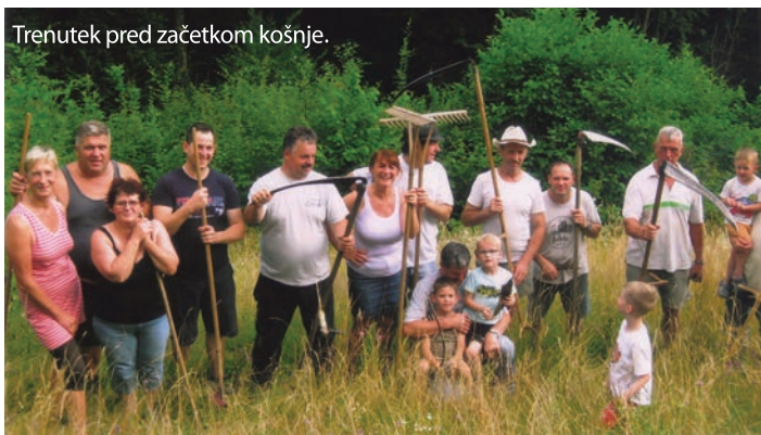
Trenutek pred začetkom košnje.