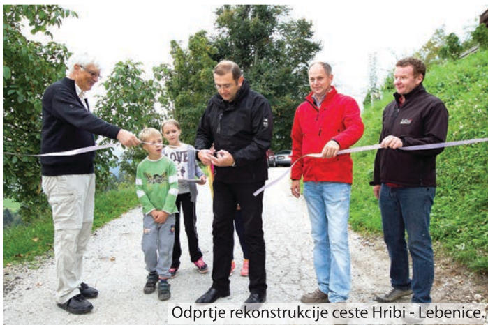
Odprtje rekonstrukcije ceste Hribi - Lebenice.

Septembrskemu dogajanju ob občinskem prazniku se je v sredo, 23. septembra 2015, pridružilo tudi odprtje rekonstrukcije dela ceste Hribi – Lebenice. Občina Lukovica je avgusta pristopila k rekonstrukciji ceste v dolžini preko 400 m. Dela v prvi fazi so zajemala zamenjavo spodnjega stroja ceste vključno z izvedbo ustreznega odvodnjavanja, v drugi fazi pa je sledila izvedba asfaltne prevleke v celotni dolžini predhodno izvedenih gradbenih del.