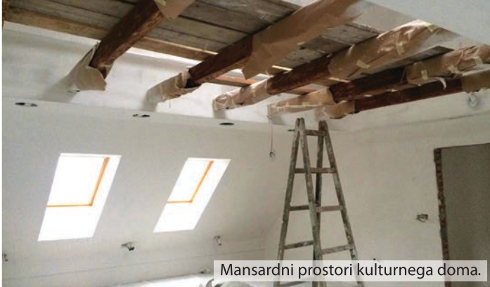
Mansardni prostori kulturnega doma.

V lanskem septembru so se na kulturnem domu v Lukovici zaključila dela energetske sanacije. Dobro leto dni pozneje se v njem ponovno dogaja, saj se zaključuje obnova mansardnih prostorov in v pritlični etaži obnova prostorov, v katerih je bila nekdaj poštna poslovalnica.