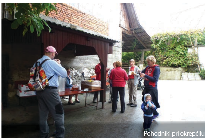
Pohodniki pri okrepčilu.