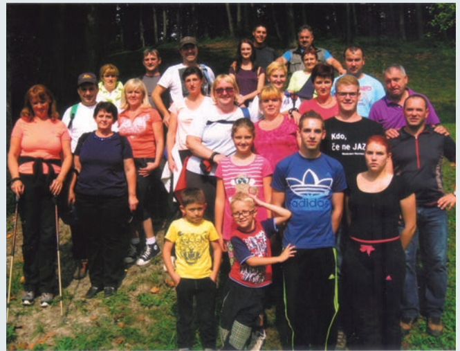
Skupna fotografija na zaselku Brezje nad Trnjavo.

Tretjo nedeljo v septembru so Zlatopoljci izkoristili za prijeten družinski pohod. Prek trideset pohodnikov je krenilo proti zadnji zlatopoljski vasi Brezovici, kjer se ob robu vasi pot spusti strmo navzdol.