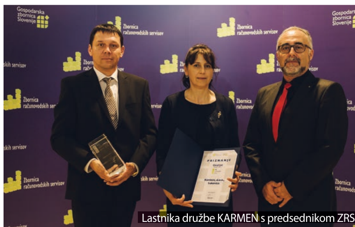
Lastnika družbe KARMEN s predsednikom ZRS.