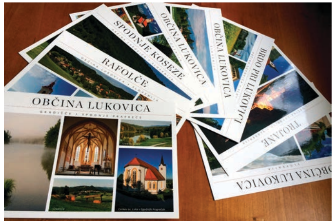
Osem novih razglednic iz občine Lukovica v letu 2015.