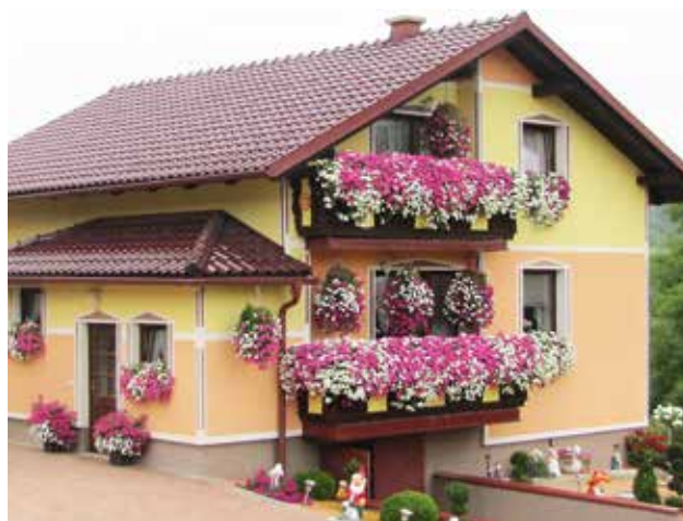
1. balkon, ČRNKO CVETKA, Neradnovci 62