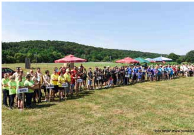
Zbiranje ekip v Peskovcih