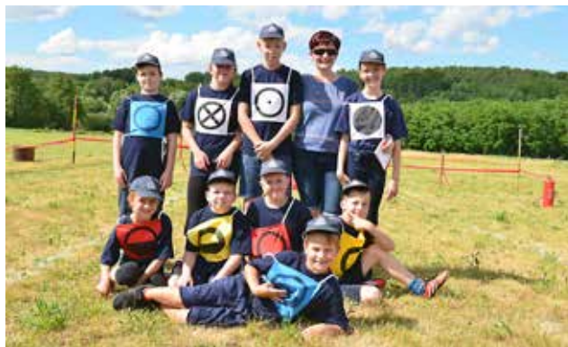
Pionirji PGD Gornji Petrovci