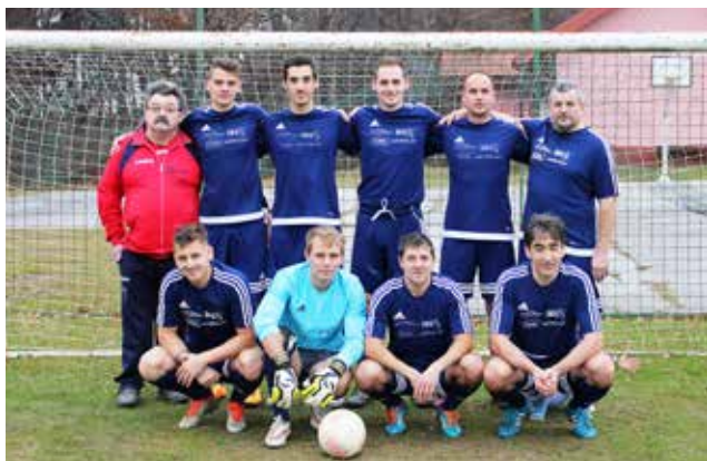
Članska ekipa Srebrni breg Martinje