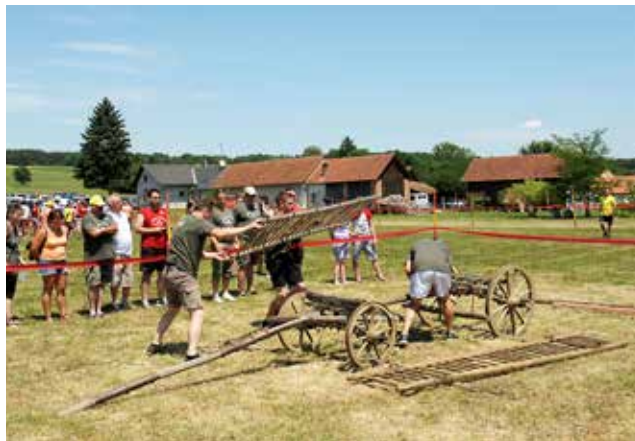
Sestavljanje kmečkega voza