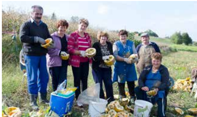
Obiranje bučnega semena v Neradnovcih