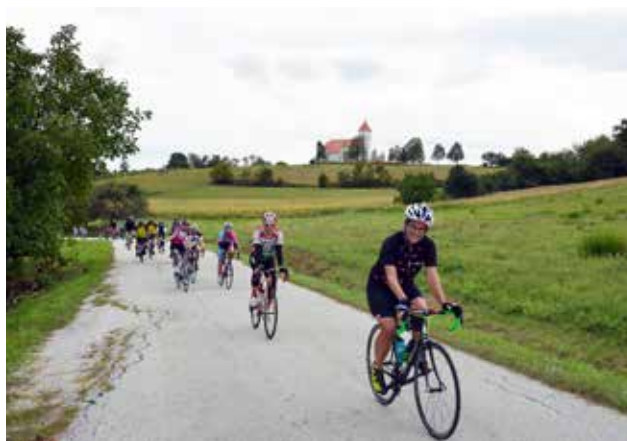
Premagovanje goričkih gričev