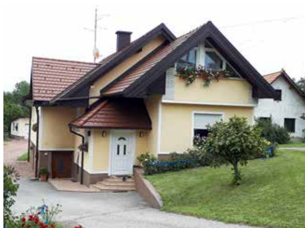
2. hiša, KEREK ZORICA in JOŽE, Križevci 100