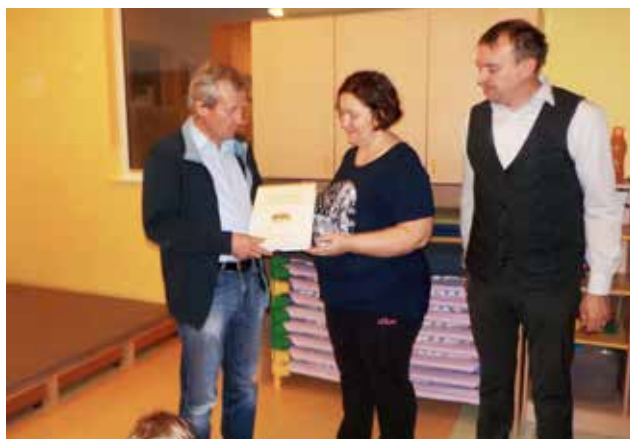
Tudi vrtec je prejel knjigo, Brez čebel ne bo življenja