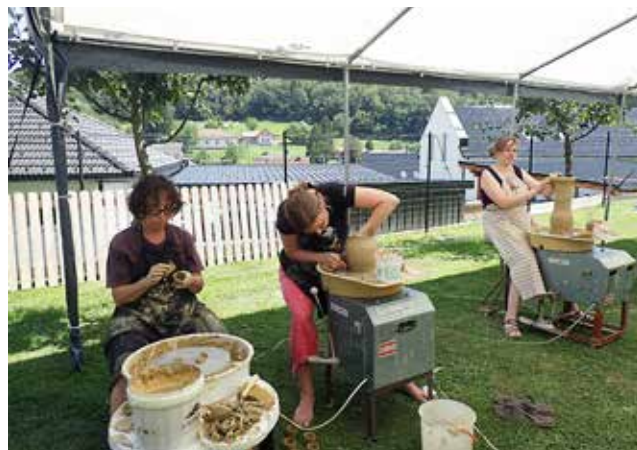
Ob lončarskem vretenu