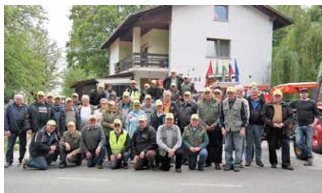
Relly 1. maj