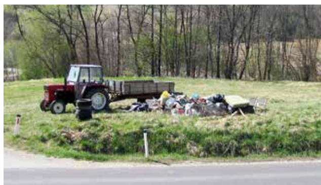
Tako so se nabirale smeti v Stanjevcih