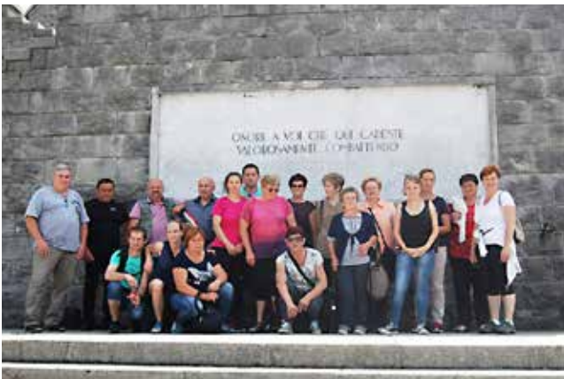
Društvo žena Kukeč na izletu v Kobaridu