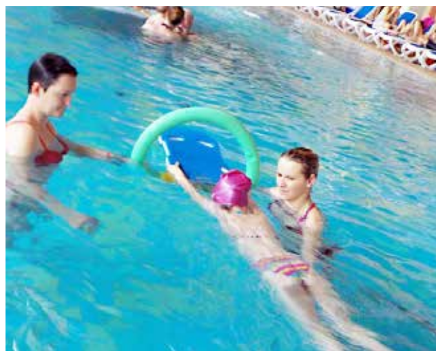
Malčki vrtca Jurček na plavalnem tečaju