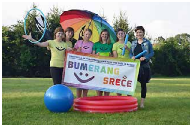
Animacijska skupina Bumerang Sreče

Za konec pa se lahko pohvalimo, da je naša pridna animacijska skupina, ki se je oblikovala konec prejšnjega leta poskrbela za animacijo na skoraj 30 dogodkih, od tega na skoraj vseh večjih festivalih v Pomurju (Pustovanje v Dobrovniku, Pomurski