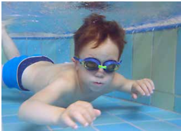
Malčki vrtca Jurček na plavalnem tečaju

V šolskem letu 2016/2017 se je programa udeležilo 13 otrok. Tečaj je potekal v kopališču Vivat v Moravskih Toplicah. Izvajala ga je vaditeljica plavanja, Ta-