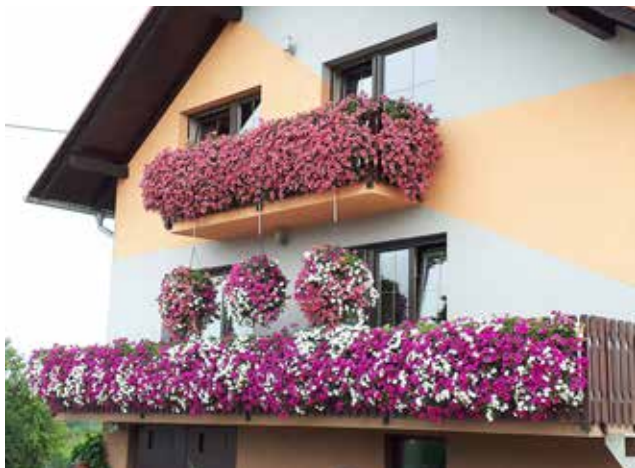
3. balkon, SMODIŠ ZLATICA, Stanjevci 4