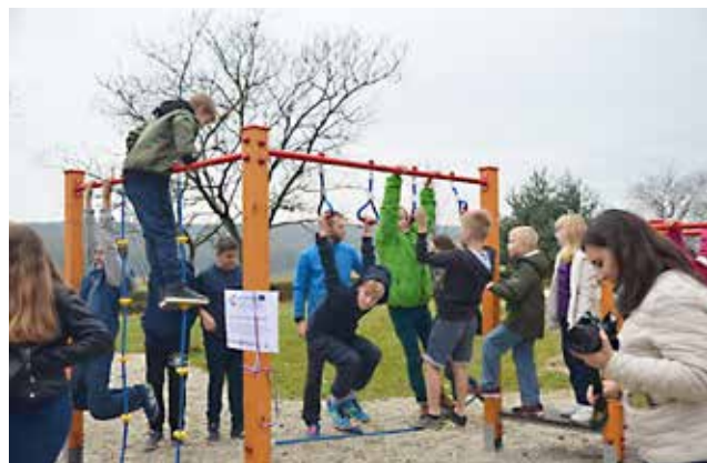
Otvoritev Zelenega parka v Prosenjakovcih

le-teh. Lokacije za vadbo bodo omogočale uporabo domačinom in obiskovalcem Krajinskega parka Goričko ter Narodnega parka Órség. Prva otvoritev je bila v slovenskem Porabju, na Dolnjem Seniku.