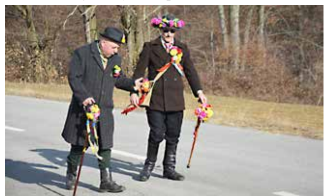
Borovo gostüvanje, 19.02.2017