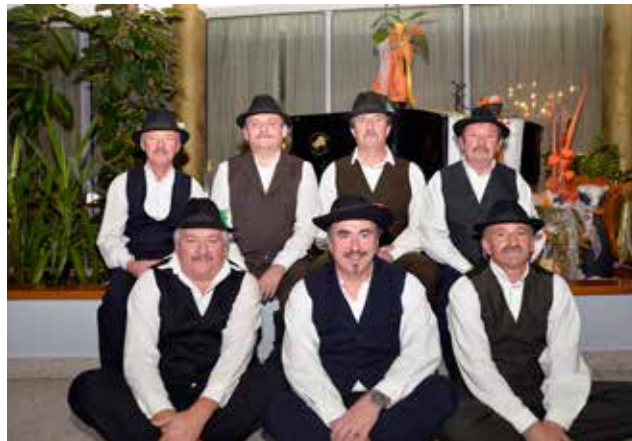
Tako so si člani KUD - a v novembru puščali brke