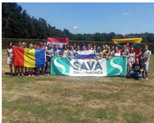
Mladi iz Litve, Romunije, Hrvaške in Slovenije v Lendavi