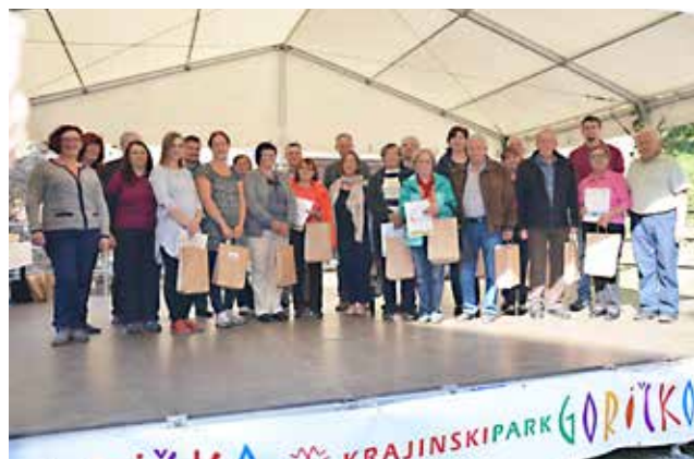
Prejemniki nagrad, priznanj in pohval v akcijah NAJ travnik, sadovnjak, ogracek in brajda ter naziva SKRBNIK narave 2017, foto: Mojca Podletnik