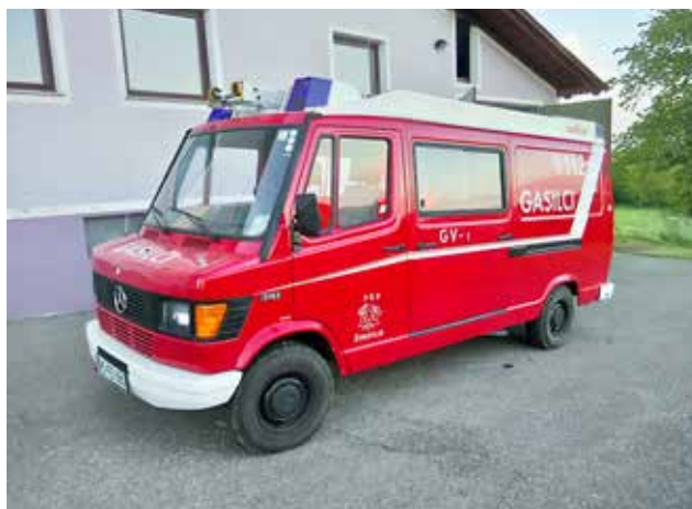
Novo gasilsko vozilo PGD Ženavlje