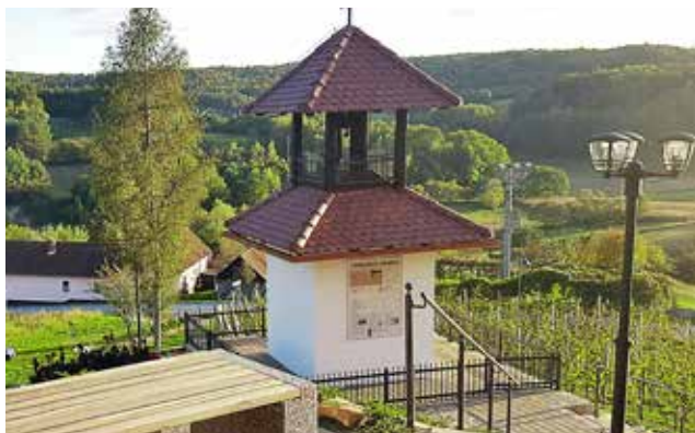
Evangeličanski zvonik v Boreči