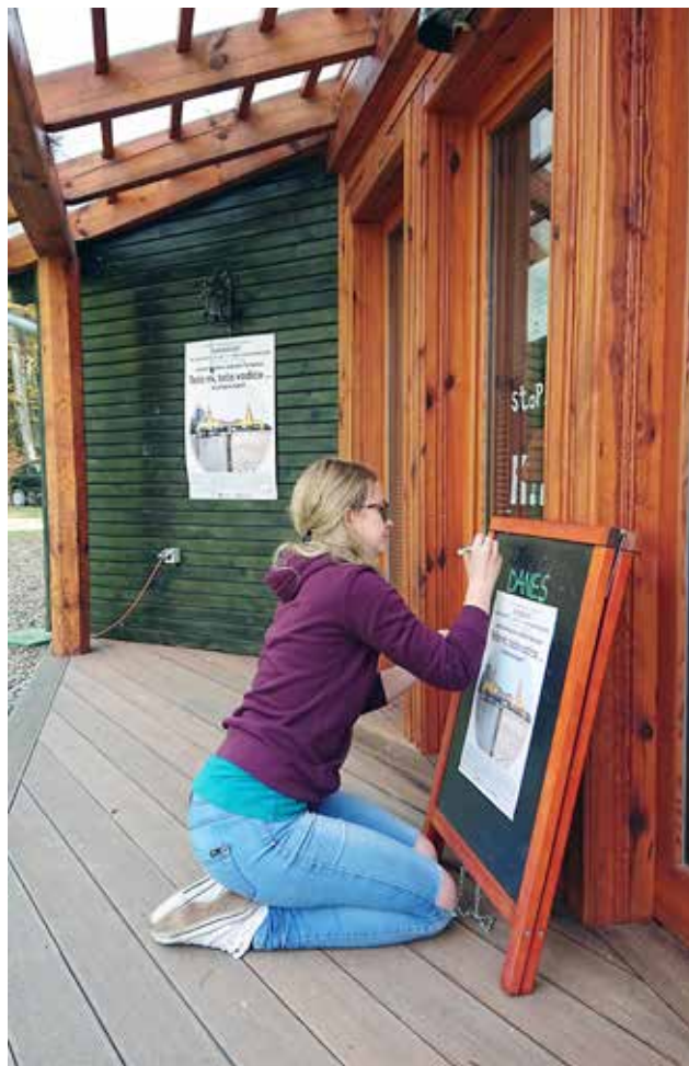
Priprava table za sprejem obiskovalcev predavanja v vidrinem centru