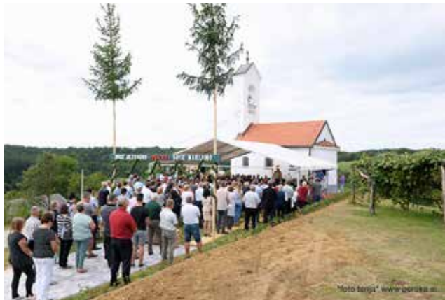
Slovesnost ob 70. obletnici kapele v Martinju, 20.08.2017