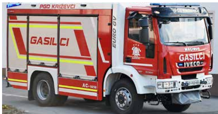
Nova gasilska cisterna AC 16/50

Prevzem nove avtociSterne bo naslednje leto ob 110-ti obletnici PGD Križevci. Že sedaj vsi lepo vabljeni na prireditev, kajti zabavo ob prireditvi bo popestril ansambel Saša Avsenika.