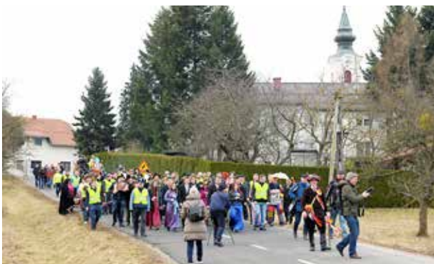
Borovo gostüvanje, 19.02.2017