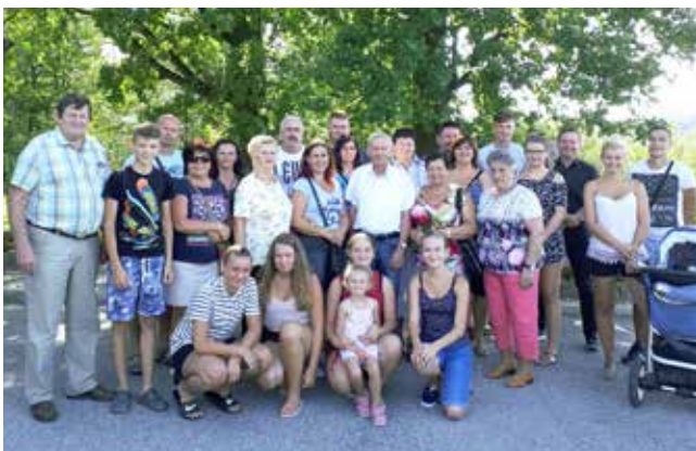
Predstavniki občine Budimir pred občinsko stavbo