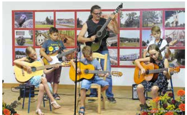
Mladi kitaristi delavnice »Prvi prijem«