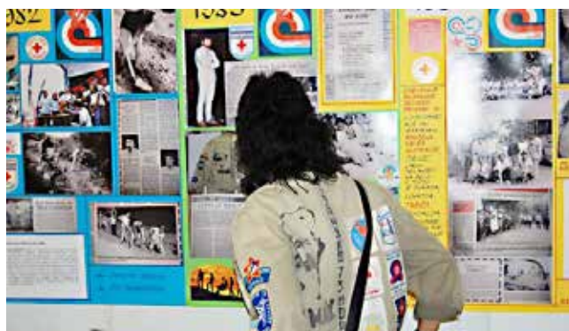
Razstava v šoli

obeležje, ki so ga pritrdili ter odkrili ob tej priložnosti ob vhodu v prostore Osnovne šole Gornji Petrovci z geslom: »Mi gradimo Goričko – Goričko gradi nas!« V družabnem delu srečanja je nastopila glasbena skupina domačega Turističnega društva Vrtanek.