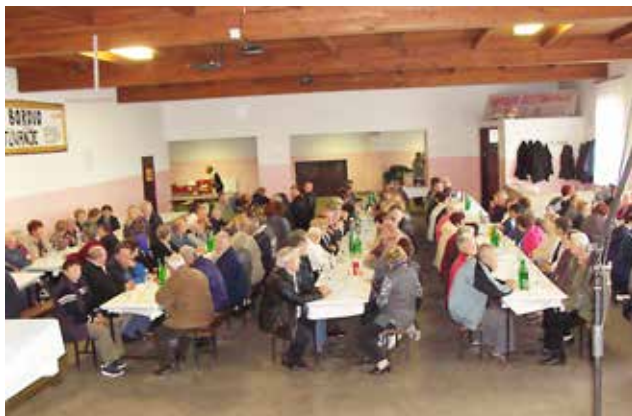
Kostanjev piknik v Križevcih