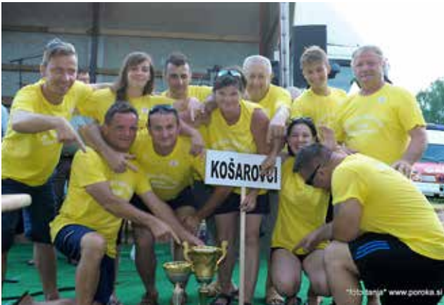
Zmagovalna ekipa vasi Košarovci

so sledile. Tekmovalci so se pomerili v naslednjih igrah: košnji trave, vleki vrvi, sestavljanju kmečkega voza, pokanju balonov, zabijanju žeblicev, metanju mokre gobe čez oviro in igri presenečenja - igri z žogo, ki jo vsako leto na samih igrah določi župan. Tekmovanje je bilo dolgo in naporno. Ob koncu iger pa je slavila ekipa vasi Košarovci, ki je prejela tudi prehodni pokal. Drugo mesto je zasedla ekipa vasi Križevci in tretje mesto ekipa vasi Kukeč. Skozi celi dan je obiskovalce zabaval ansambel Cocktail.