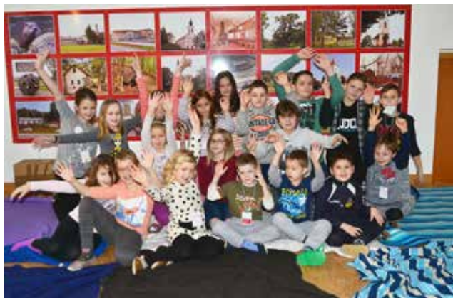
Zimski tabor v Stanjevcih

Pozna jesen se počasi preveša v zimo in najbolj čaroben mesec je tik za ovinkom. To pa pomeni