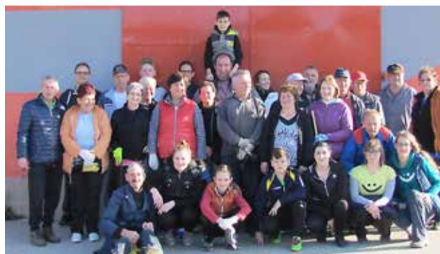
Čistilna akcija v Stanjevcih