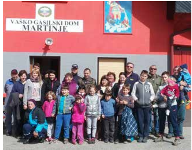
Čistilna akcija v Martinju