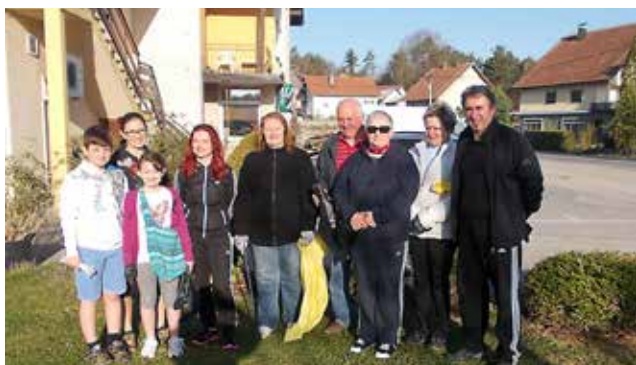
Čistilna akcija v Gornjih Petrovcih