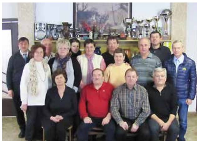
Krvodajalci RK KORK Gornji Petrovci, 30.01.2017