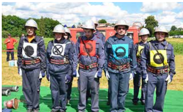
Gostitelji letošnjega gasilskega tekmovanja, PGD Adrijanci