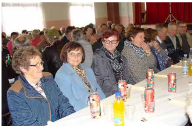
Kostanjev piknik v Križevcih