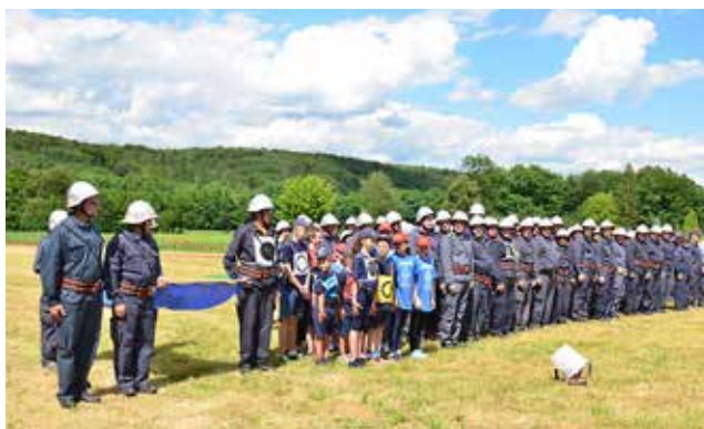
Zbiranje gasilskih ekip v Adrijancih