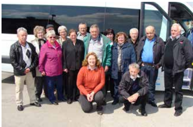
Udeleženci prvomajskega piknika v Črenšovcih