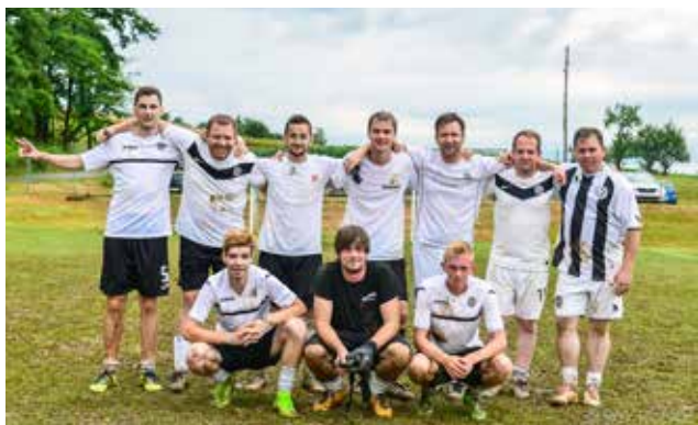
Ekipa KMN Gornji Petrovci po tekmi

Tradicionalni občinski turnir v malem nogometu se je odvijal letos v Neradnovcih v nedeljo, 25.06.2017. Sodelovalo je 8 ekip: Šulinci, Križevci, Martinje, Adrijanci, Neradnovci, Stanjevci, Gornji Petrovci in Lucova. Na koncu prireditve je prvo mesto zasedla ekipa Gornjih Petrovec, druga je bila ekipa