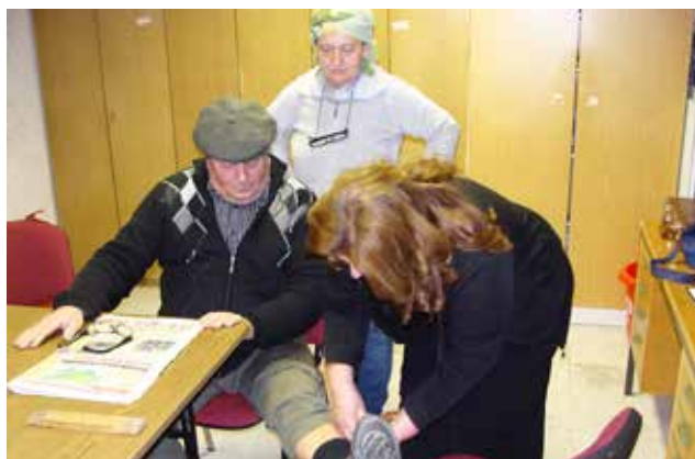
Dramska skupina društva upokojencev Občine Gornji Petrovci