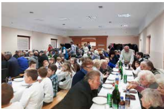
Srečanje starejših občanov nad 70 let v Gornjih Petrovcih, 19.11.2017