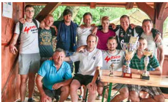
Zmagovalna ekipa KMN Gornji Petrovci