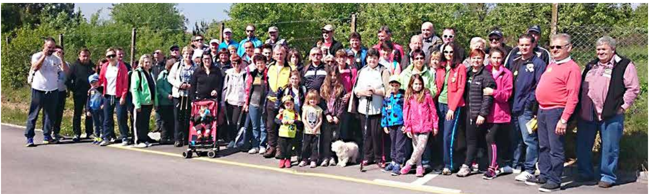
11. pohod na Kukeču