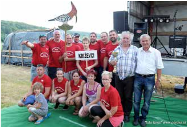
Drugo mesto ekipa Križevci