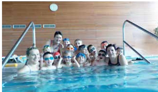
Malčki vrtca Jurček na plavalnem tečaju