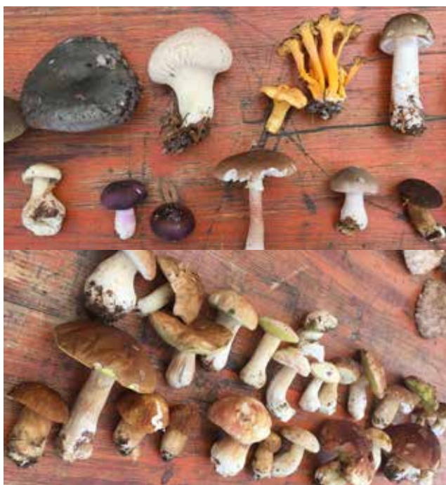
Razstava nabranih gob