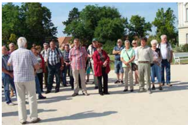
Izlet na Madžarsko