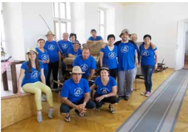
Člani KUD Goričko na izletu na gradu Velika Nedelja