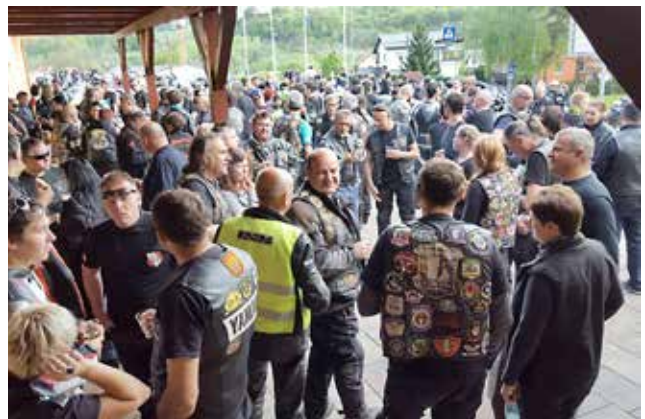
Motoristi pri vaški dvorani v Gornjih Petrovcih