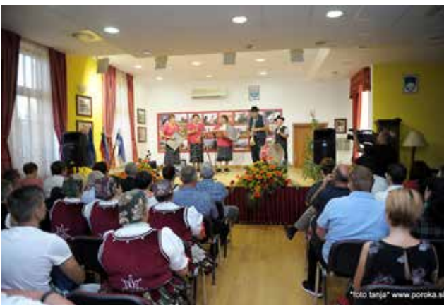
Ljudski pevci in godci TD Vrtanek