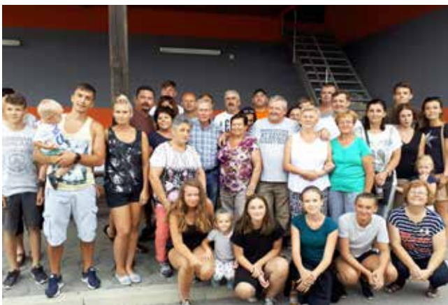
Gostje iz Budimira v Lucovi

Priznanja za najlepše urejen balkon v letu 2017 so prejeli: