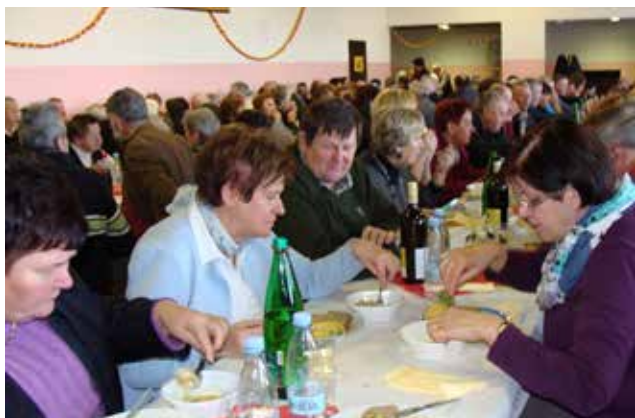
Občni zbor društva upokojencev Občine Gornji Petrovci