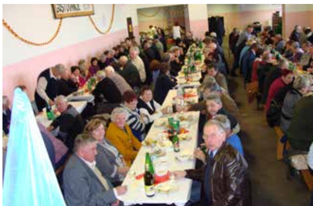
Občni zbor društva upokojencev Občine Gornji Petrovci