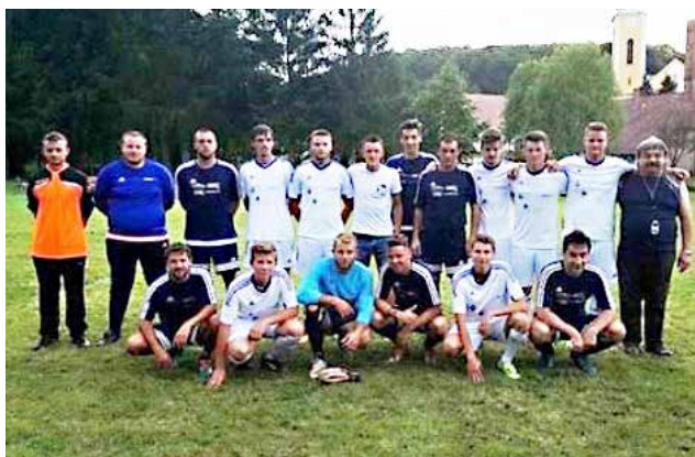
Srečanje nogometašev na Gornjem Seniku

sezone 2017/2018 v Mednarodni veteranski ligi A - SLO - H. Veterani ŠD Srebrni breg Martinje kot edini iz Občine Gornji Petrovci tekmujejo v veteranski ligi od samega začetka nastanka lige. V tekmovalni sezoni 2017/2018 tekmuje v Mednarodni veteranski ligi šest ekip. Veterani ŠD Srebrni breg Martinje smo 3. na lestvici po nepolnem zaključku