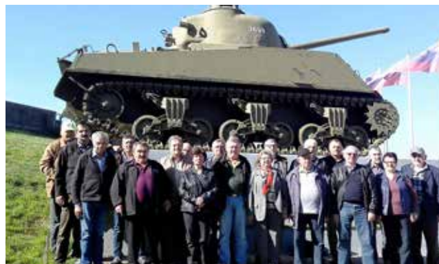
Izlet v Pivko