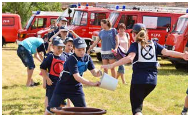
Tekmovanje pionirjev v vaji z vedrovko