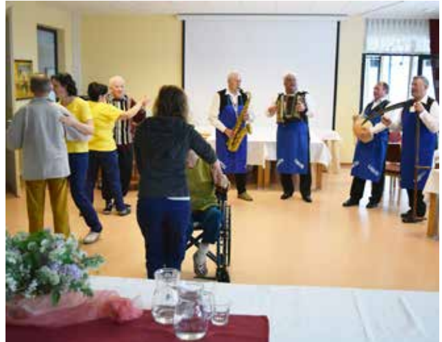
Veselo rajanje slavlencev v DOSOR - ju

Besedilo in fotografije: Filip Matko Ficko