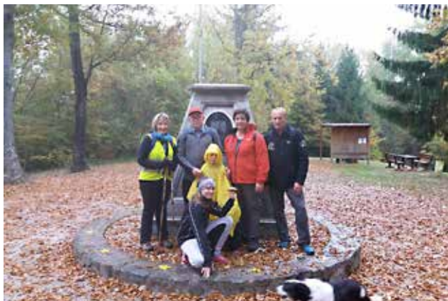
Pohod na Tromejnik