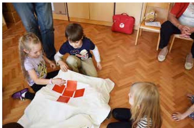
Zaključek zgodbice Medvedek Henry v vrtcu

Gibanje Rdečega križa in Rdečega polmeseca v svetu združuje: Mednarodni odbor Rdečega križa s sedežem v Ženevi, Mednarodna federacija nacionalnih društev Rdečega križa in Rdečega polmeseca s sedežem v Ženevi ter nacionalna društva Rdečega križa in Rdečega polmeseca (v Izraelu Rdeči kristal) v kar 190 državah sveta. Del tega gibanja je tudi Rdeči križ Slovenije, s 57 območnimi združenji Rdečega križa po državi in eno izmed teh je RKS - Območno združenje Rdečega križa Murska Sobota, ki združuje krajevne organizacije Rdečega križa v občinah: Beltinci, Cankova, Gornji Petrovci, Grad, Hodoš, Kuzma, Mestni občini Murska Sobota, Moravske Toplice, Puconci, Rogašovci, Šalovci