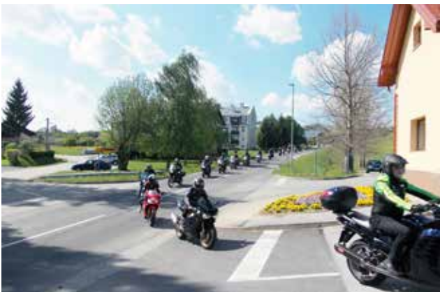
Motoristi pri vaški dvorani v Gornjih Petrovcih