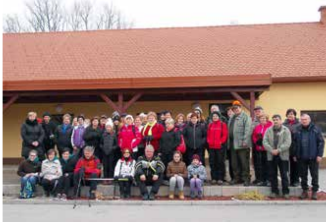
Prešernov pohod 2017 - start pri vaški dvorani

Ob tem pa smo vsako leto sodelovali na vseh drugih kulinarčnih, adventnih ali velikonočnih delavnicah ali kulinarčnih tekmovanjih, ki so jih organizirala druga društva iz naše ali sosednjih občin. Vrsto let smo uspešno sodelovali tudi z Biotehniško srednjo šolo v Rakičanu in sodelovali na številnih njihovih