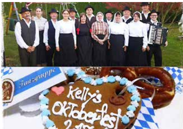
Gostovanje v sosednji Avstriji, 24.10.2017

KUD Goričko je v letošnjem letu imelo skupno