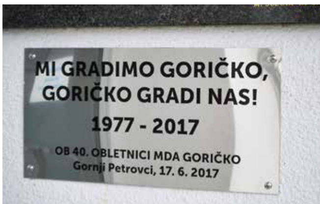
Novo spominsko obeležje na pročelju šole