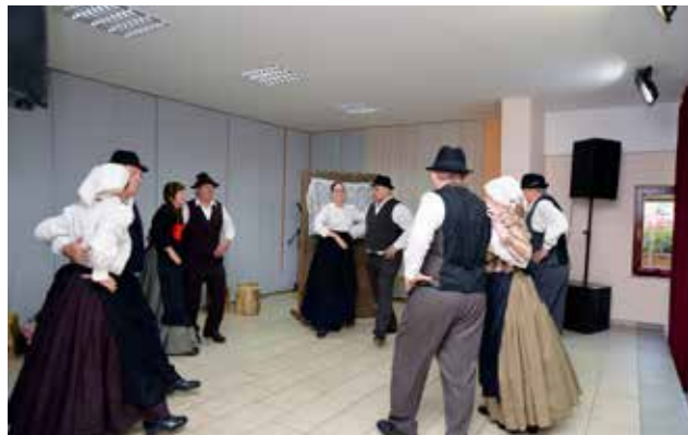
Nastop folklorne skupine na Retašadi v Gornjih Petrovcih, 21.10.2017