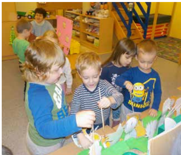
Srečanja na delavnicah projekta »V objemu besed« v vrtcu Jurček pri OŠ Gornji Petrovci

V okviru projekta smo izvedli deset srečanj. Na vsakem srečanju smo obravnavali drugo zvrst knjig; od leposlovnih, naravoslovnih do gibalnih zgodb. Po obravnavi knjige pa so sledile delavnice, ki so se na knjigo navezovale. Na naše zadnje srečanje smo pova-