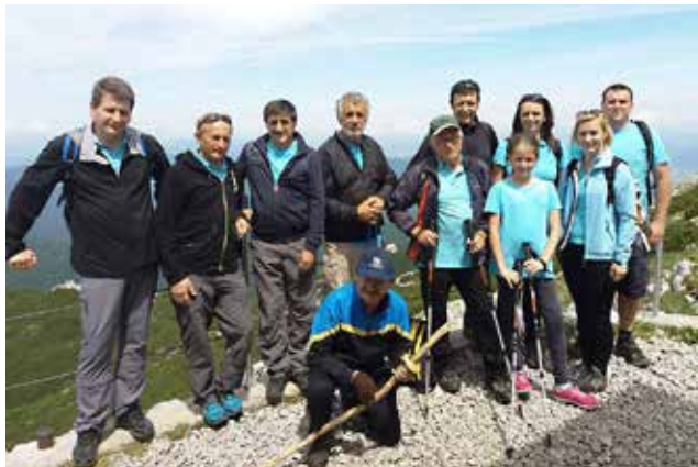
Pohod na Snežnik

Pred nekaj tedni, natančno 22. 10. 2017, je potekal pohod na Tromejnik (27 km). Kljub slabemu vremenu, smo se tisti »vztrajni«, pohoda udeležili. Bilo nas je 7 pohodnikov in naša zvesta spremljevalka, psica Pika. Tudi ona vztraja, čeprav lije dež in je mrzlo. Zbrali smo se v zgodnjih jutranjih urah in odpravili mimo balona v Ženavljah, gostilne Sukič v Martinju, kjer je prva jutranja kavica, dalje po vasi Trdkova, naprej po gozdu do betonskega mejnika, ki deli tri