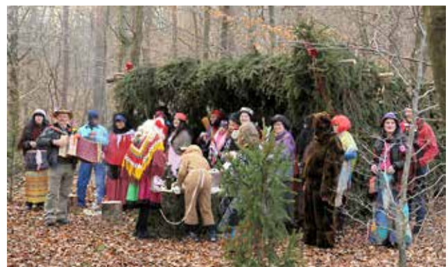
Borovo gostüvanje, 19.02.2017