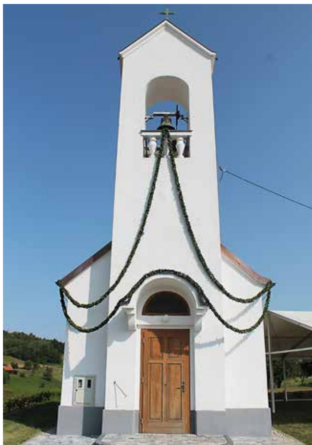
Kapela v Martinju

Prva obnova kapele je bila opravljena v sedemdesetih letih, ko so zamenjali fasado. Drugo večjo obnovo je kapela doživela leta 1997, torej ob njeni 50 - letnici. Takrat se je naredila bakrena streha s križem na zvoniku, nov notranji omet, električna inštalacija in elektrifikacija zvona. Lesena tla je zamenjal granit. Novo barvno podobo je dobila fasada. Čez nekaj let smo nabavili nove hrastove klopi in