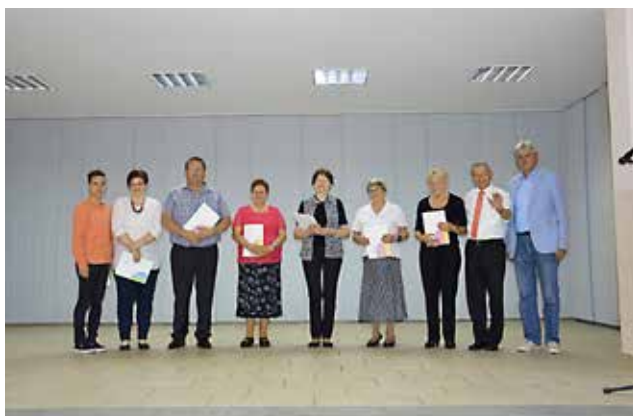
Vsi nastopajoči na območnem srečanju v Gornjih Petrovcih