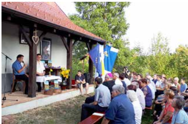
Predstavitve knjige pri Centru kulture in sožitja Srebrna hiša v Martinju