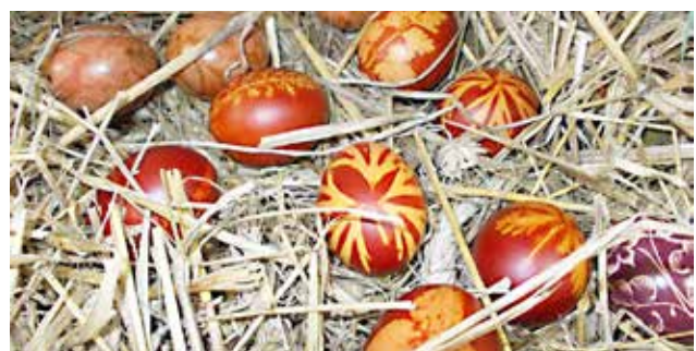
Razstavljene pisanice na razstavi v Peskovcih