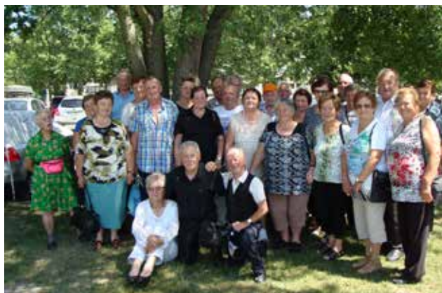
Udeleženci srečanja pomurskih upokojencev