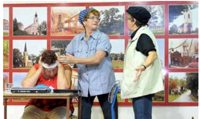
Igra Dja man za se paper v izvedbi gledališke skupine ZSM Števanovci