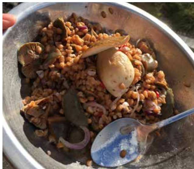
Gobova jed s kašo