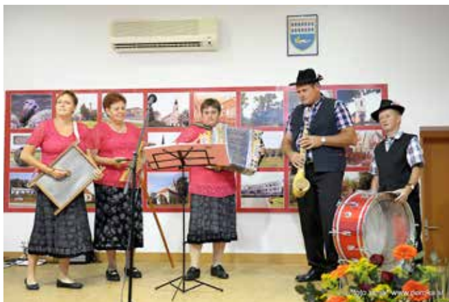
Ljudski godci in pevci TD Vrtanek na svečani seji občinskega sveta Občine Gornji Petrovci v Stanjevcih, 18.08.2017