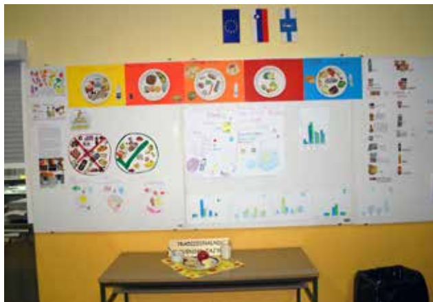
Razstava otrok ob tradicionalnem slovenskem zajtrku