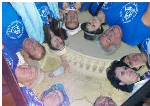
Na gradu Velika Nedelja

V našem društvu, ki šteje 26 članov, od tega 2 muzikanta, smo vedno veseli, če se nam pridruži kakšen nov ljubitelj plesa ali igre. Zato vabimo vse, ki bi se nam radi pridružili, da nas poiščejo na kakšnih vajah in nam pokažejo svoje znanje. Najpomembnejša pa sta dobra volja in vesela narava. Pričakujemo vas!