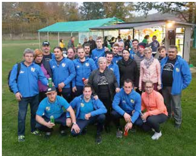
Igralci ŠD Neradnovci in zvesti navijači