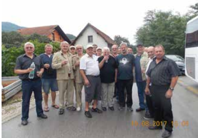
Adrijanci na strokovni ekskurziji v Savinjski dolini

Mogoče se kdo vpraša, zakaj zeleno zlato, tako namreč pravijo hmelju, ki je potreben za pripravo piva in od tod tudi ime Dolina zelenega zlata, kakor poimenujejo Savinjsko dolino.