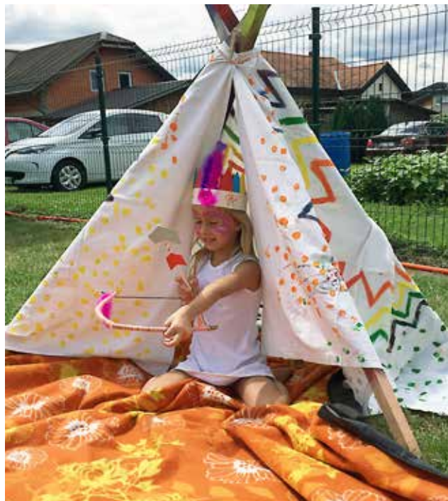
Pomurski športni festival Melinci 2017