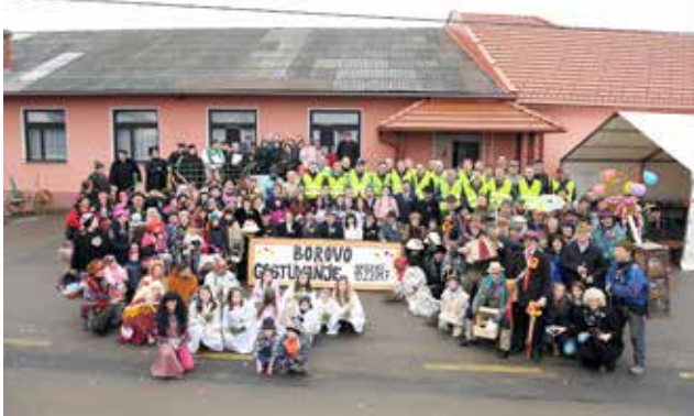
Borovo gostüvanje, 19.02.2017

smo najprej naredili eno skupinsko fotografijo, nato pa je svatba krenila na pot proti prireditvenemu prostoru v bližnjem gozdu. Obiskovalci so se med potjo in v gozdu lahko družili z različnimi pustnimi maskami. Sodelovalo je več kot sto različnih tradicionalnih in tudi novjših mask kot so: svatje, ženini in nevesta, družice, turbaš oziroma pozvačin, ciganke, lovci, drvarji, razni nekdanji obrtniki, sodniki, bili so tudi medvedje, vrage, čarovnice, »tauvaji«, za glasbo sta poskrbela harmonikarja in vile, ki so pele, gostinci so skrbeli za jedačo in pijačo, vse skupaj pa so skrbno varovali borovi miličniki. Veselo rajanje je trajalo vse do poldneva. Točno ob 12.00 uri je sledilo sekanje bora, katerega vrh je bilo potrebno skrbno varovati