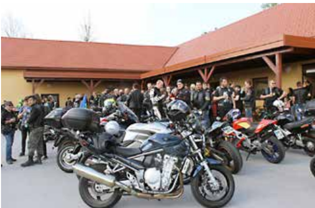
Motoristi pri vaški dvorani v Gornjih Petrovcih