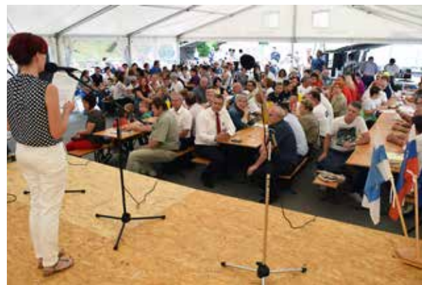
Prireditve pod šotorom