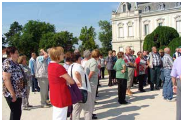
Izlet na Madžarsko