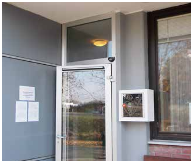
Defibrilator na vhodu v Zdravstveno postajo Gornji Petrovci