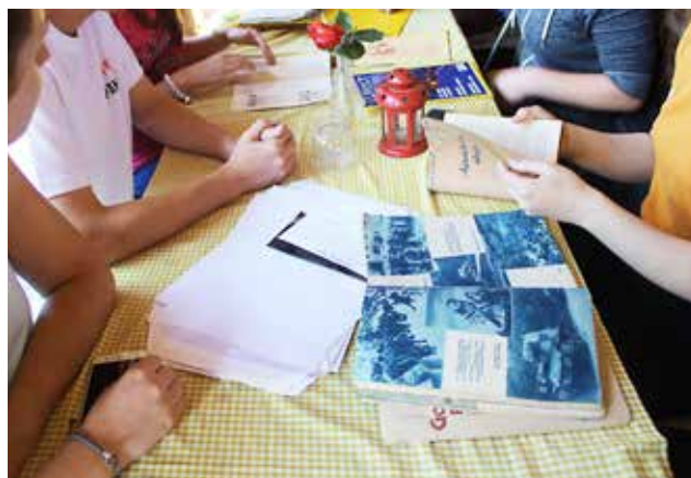
Delo dijakov na terenu

Sámo odprtje razstave so popestrili plesalci KUD Goričko iz Gornjih Petrovcev, pozdravil pa nas je