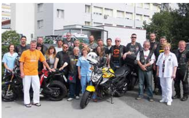
Krvodajalci MK Gronska strejla, 05.06.2017