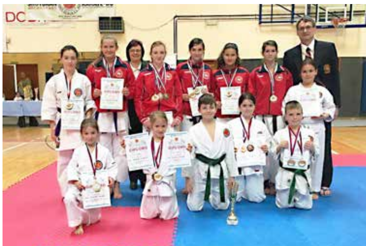
Člani Shotokan karate - do kluba Gornji Petrovci

Murski Soboti, Rušah, Domžalah, Izoli in strokovno izpopolnjevalni treningi v Mariboru in fizične priprave na Boču. Najzanimivejše izobraževanje je vsekakor v Izoli, ki poteka poleti in se imenuje IZOLA CAMP. Letos smo trenirali skupaj s karateisti iz: Belgije, Nizozemske, Italije, Avstrije in Rusije. S tem izkoristimo lepo vreme, morski zrak in vodo.