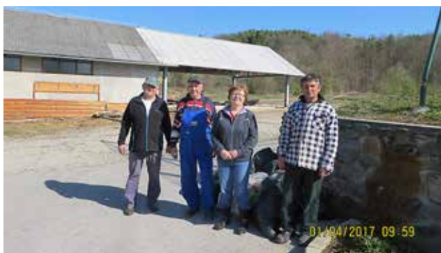
Čistilna akcija v Lucovi