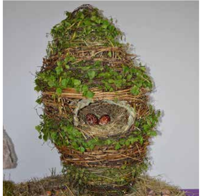
Velikonočni aranžma Društva žena Kukeč