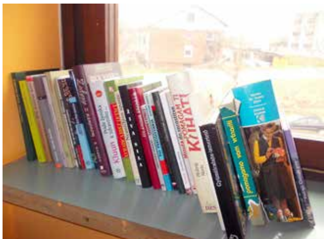
Knjižna polica v čakalnici