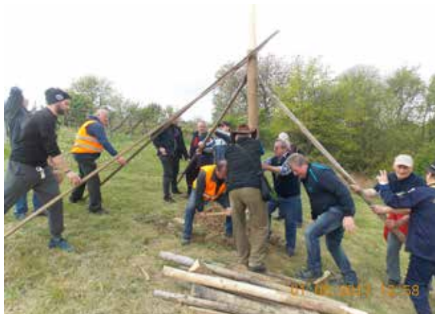
Postavitev mlaja v Adrijancih

No in sedaj, ko mlaj ponosno stoji in na njem v pomladnem vetru plapola slovenska zastava, se od-