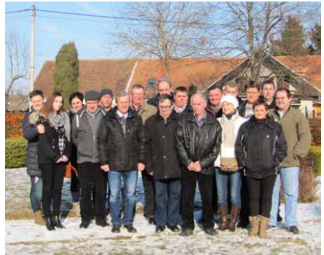
Krvodajalci RK KORK Ženavlje, 09.01.2017