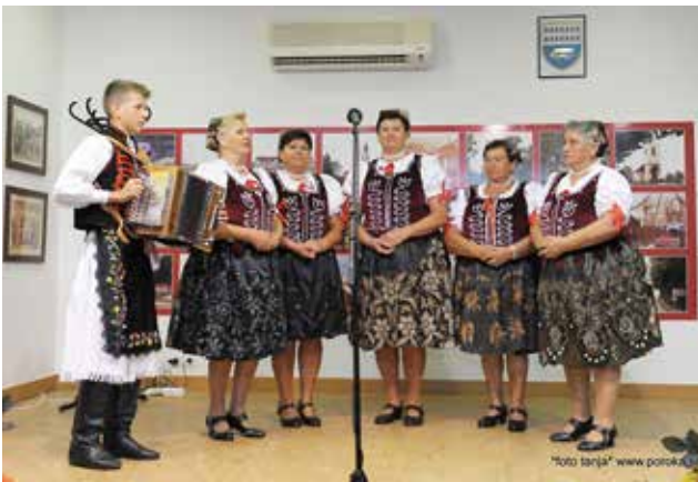
Pevski zbor kulturnega društva iz Budimira