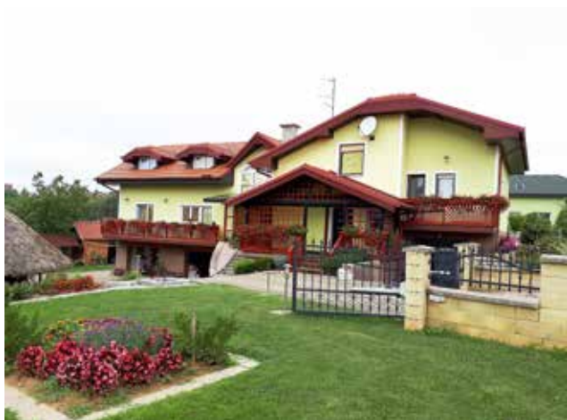
1. hiša, ŠLIHTHUBER ANICA in FRANC, Stanjevci 96