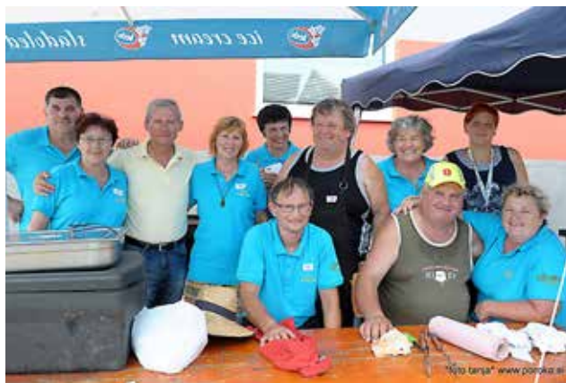
Vaščani Peskovec - organizatorji 23. vaških iger Občine Gornji Petrovci, 09.07.2017