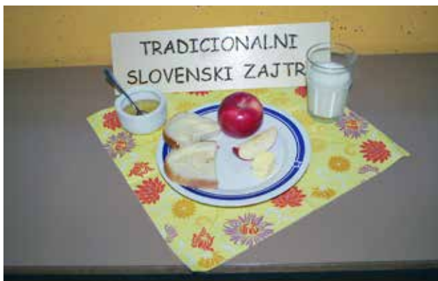
Tradicionalni slovenski zajtrk: med, maslo, jabolko, mleko in kruh