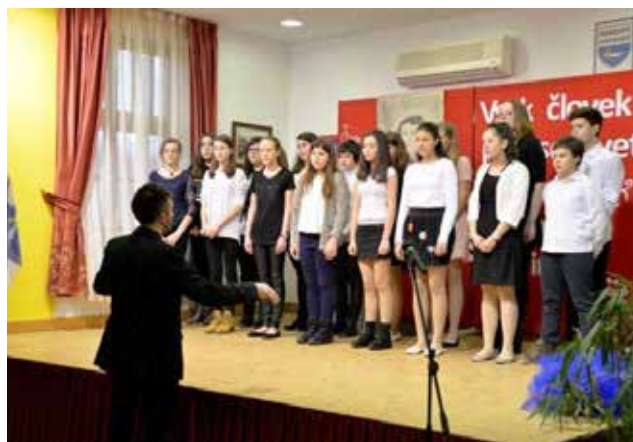
Pevski zbor osnovne šole Gornji Petrovci