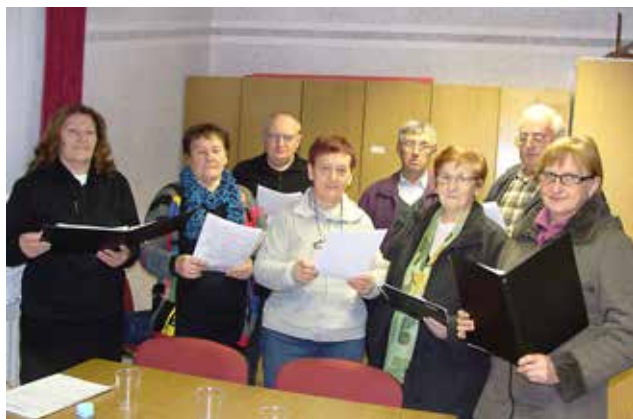
Pevski zbor društva upokojencev Občine Gornji Petrovci