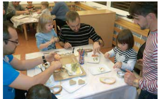
Srečanja na delavnicah projekta »V objemu besed« v vrtcu Jurček pri OŠ Gornji Petrovci