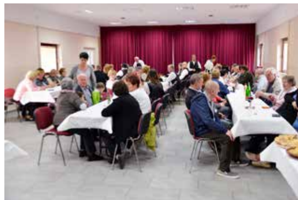
Retašiada v Gornjih Petrovcih