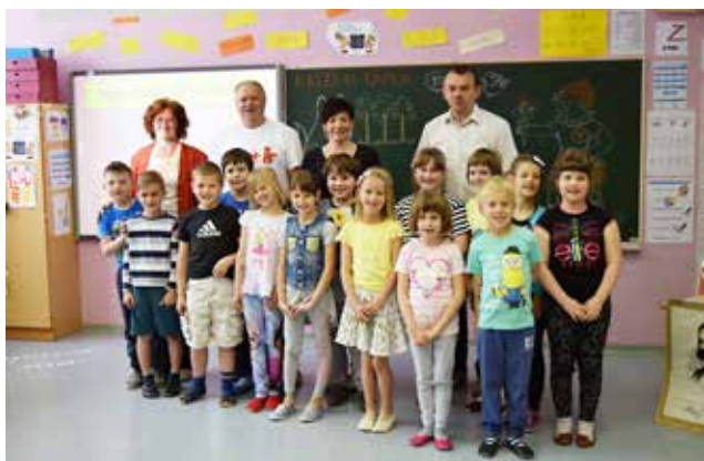
Podmladek RK Osnovne šole Gornji Petrovci

Gibanje Rdečega križa in Rdečega polmeseca v svetu združuje: Mednarodni odbor Rdečega križa s sedežem v Ženevi, Mednarodna federacija nacionalnih društev Rdečega križa in Rdečega polmeseca s sedežem v Ženevi ter nacionalna društva Rdečega križa in Rdečega polmeseca (v Izraelu Rdeči kristal) v kar 190 državah sveta. Del tega gibanja je tudi Rdeči križ Slovenije, s 57 območnimi združenji Rdečega križa po državi in eno izmed teh je RKS - Območno združenje Rdečega križa Murska Sobota, ki združuje krajevne organizacije Rdečega križa v občinah: Beltinci, Cankova, Gornji Petrovci, Grad, Hodoš, Kuzma, Mestni občini Murska Sobota, Moravske Toplice, Puconci, Rogašovci, Šalovci