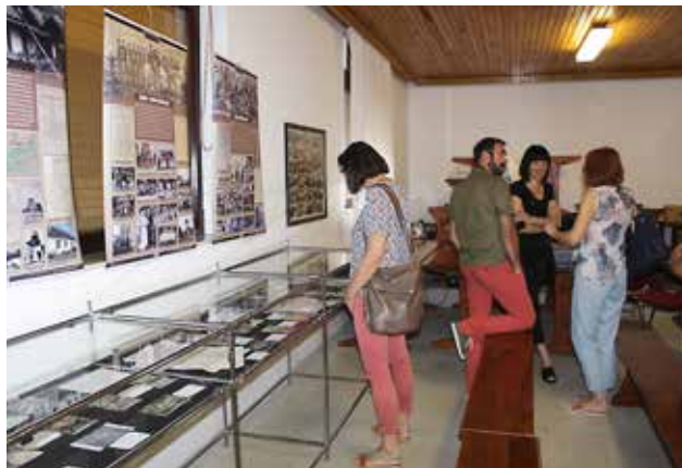
Razstava v gasilskem domu v Boreči

Gordana Šövegeš Lipovšek, Pokrajinski arhiv Maribor