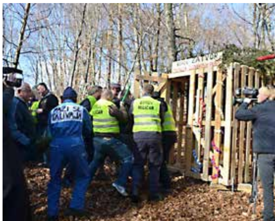
Borovo gostüvanje, 19.02.2017