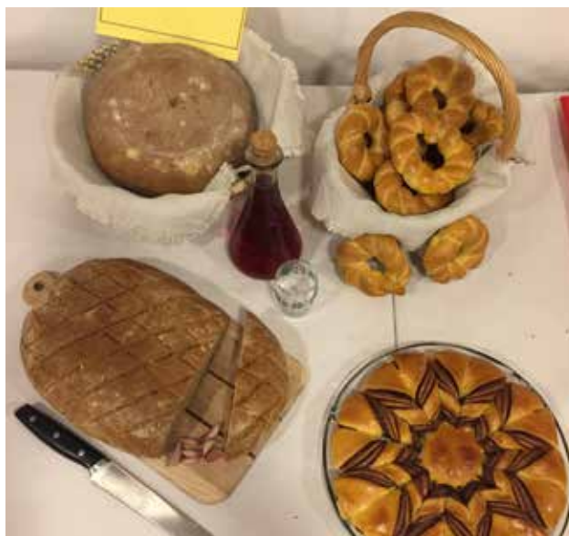
Razstavljene jedi ŠKTD Adrijanci na Kukeču