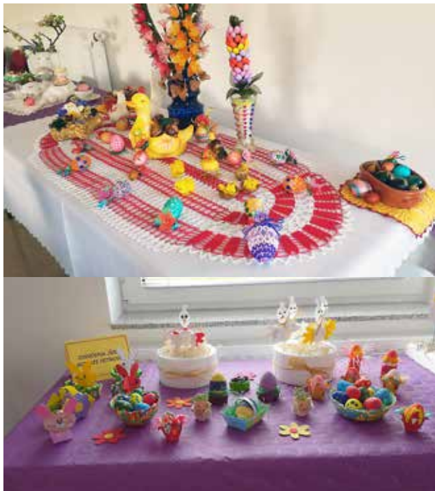
Velikonočna razstava v Peskovcih

Vaščani vasi Peskovci in občina Gornji Petrovci smo organizirali dvodnevno razstavo velikonočnih pisanic in aranžmajev. Razstavljalo je precej društev in prav tako tudi posamezniki.