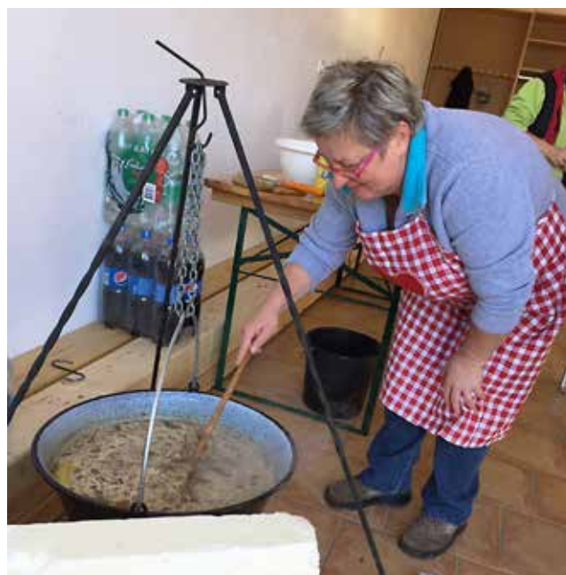
Darinka kuha gobovo juho