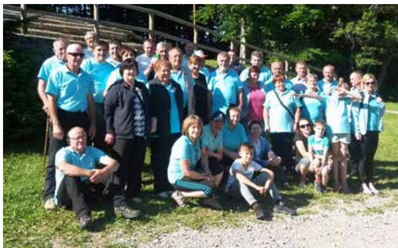
Pohod na Snežnik

zato je kljub dolžini poti (15,7 km), bilo vzdušje prijetno. Najlepši del pohoda pa je okrepčilo na koncu. Naslednje, s čimer se ponašamo, je izlet, ki ga načrtujemo že v prejšnjem letu. Vsak član društva ima možnost, da izrazi svoje mnenje, kam bi se naslednje leto podali na pohodni izlet. Včasih se mnenja »krešejo«, vendar na koncu s skupnimi močmi izberemo tisto, kar je prav za žep in zmožnost vseh članov društva. V letošnjem letu smo se odpravili na Snežnik. V zgodnjih jutranjih urah smo se odpeljali proti Notranjski, v Ilirsko Bistrico in naprej na Svinščake. Pri planinskem domu smo se ustavili in pripravili na hojo na Snežnik, ki je visok 1796 m in je najvišji vrh v bližnji in daljni okolici. Z njega je lep razgled po večjem delu Slovenije in Hrvaške, vidijo se tudi vrhovi Julijskih Alp, Kamniško - Savinjske Alpe in Karavanke. Tisti, ki smo večji hoje, smo v dveh urah prišli do vrha, kjer je zavetišče Drage Karoline. Ostali, ki so hoje manj večji, oziroma jim tega