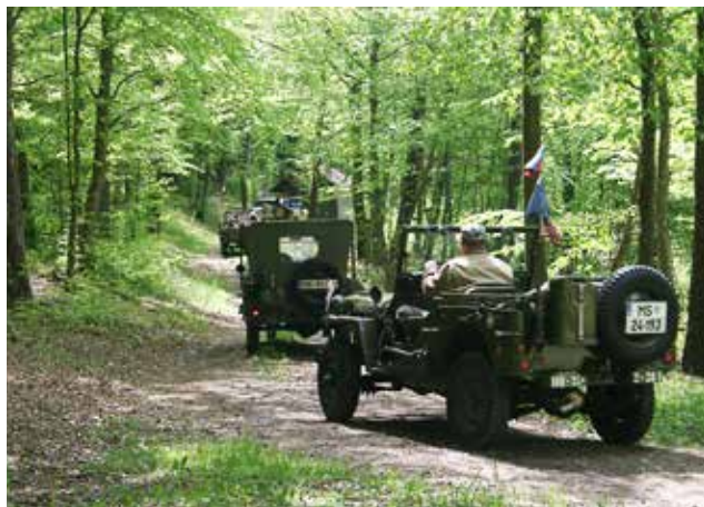
Kdo lahko trdi, da se v vidrinem centru nič ne dogaja? Med zadnjimi prvomajskimi prazniki smo gostili člane društva Jeep klub veteran iz Murske Sobote, ki so bili nad centrom in vsem, kar tam počnemo, navdušeni. Še bodo prišli, so rekli.