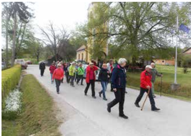
Prvomajski pohod po Adrijancih

precej visoko in močno. Na mizah, postavljenih v zavetju pomladnega gozda, ni manjkalo domačih sokov, hladne vode in seveda hladnega špricerja z domačo šmarnico in rdečko. Tako okrepečani smo se odpravili do Štokove domačije, kjer so nas čakale bogato obložene mize z obloženimi kruhki in slastna kapljica Adrijančan iz Nedelskoga brega.