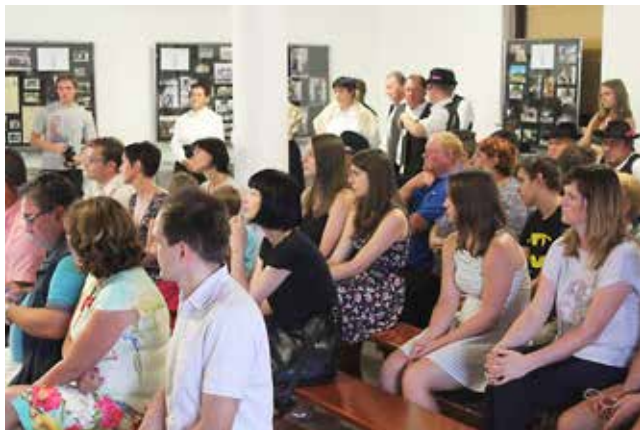
Odprtje razstave ob koncu tabora v gasilskem domu v Boreči

Razstava je bila na ogled do 7. julija, dokumenti in fotografije so spet varno shranjeni pri njihovih lastnikih. Tabor je izpolnil vsa pričakovanja tako dijakov kot mentorjev in Boreče in Ženavej se bomo še dolgo spominjali.