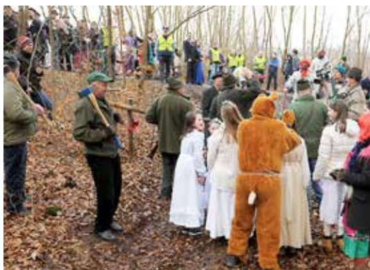
Borovo gostüvanje, 19.02.2017

pred nepridipravi iz sosednjih vasi. Kraja le tega bi bila za domačine velika sramota. Bor smo nato naložil na voz in odpravili smo se nazaj proti gasilskemu domu, kjer je sledila šaljiva poročna slovesnost, nato pa zabava, kot se za vsako gostüvanje spodobi. Bor smo na koncu prodali.