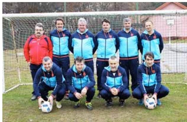
Ekipa veteranov ŠD Srebrni breg Martinje