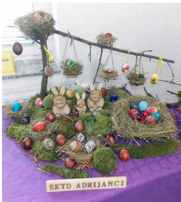
Velikonočni aranžma ŠKTD Adrijanci na razstavi v Peskovcih