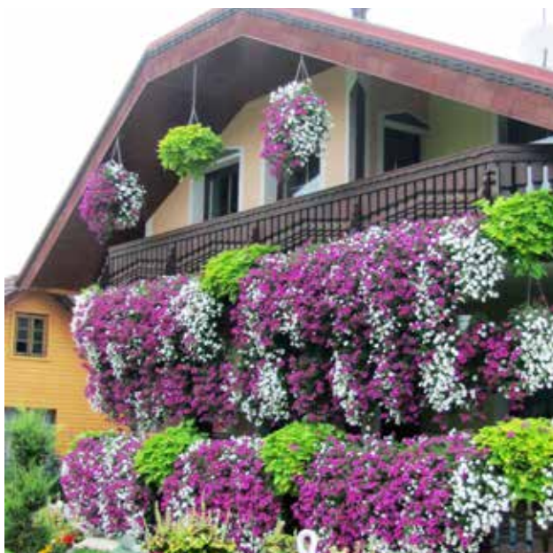
2. balkon, BALEK JOŽICA, Neradnovci 36