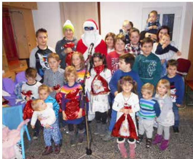
Božič 2016 v Martinju