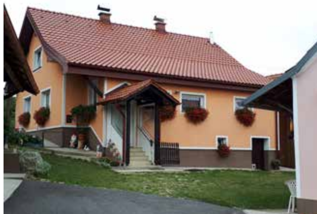
2. hiša, KEREK IRENA in ANTON, Šulinci 70