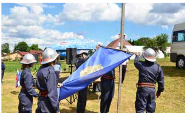
Dvig gasilske zastave