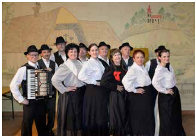
Nastop v Čepincih