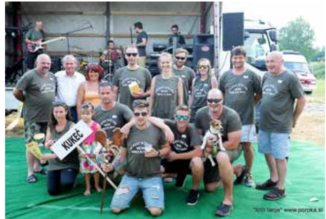
Tretje mesto ekipa Kukeča