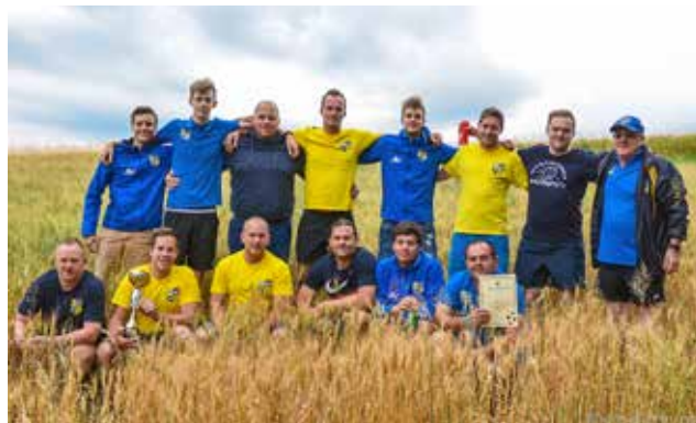
Ekipa domačinov ŠD Neradnovci