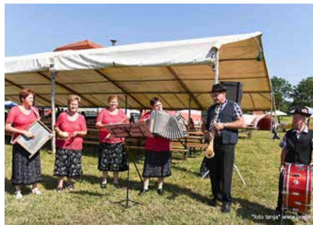
Nastop ljudskih pevcev na vaških igrah 2017 v Peskovcih