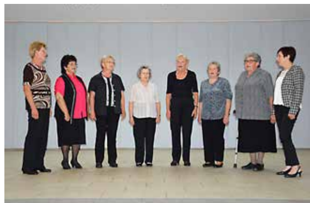
Ljudske pevke Jesensko listje društva prijateljev Dokležovje