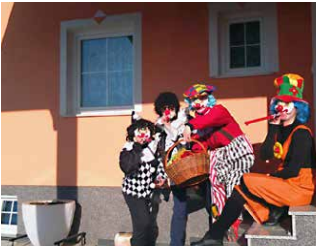
Fašenek na Kukeču