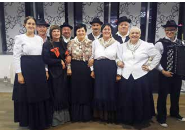
Team building v Vivatu, 13.10.2017

30 nastopov. Prihodnje leto pa nas zopet čaka veliko dela, saj bomo praznovali 25 let delovanja, kar bomo proslavili z veselim večerom v Gornjih Petrovcih, na katerega pa Vas že zdaj vse prisrčno vabimo. Vsi člani društva želimo vsem našim sovaščanom in našim gledalcem srečno, zdravo, zadovoljno in vedro novo leto 2018 in čim več smeha, ki je dokazano najboljše zdravilo.