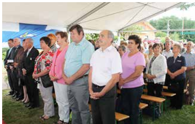
Slovesnosti so se udeležili tudi župani občin: Gornji Petrovci, Cankova in Kuzma ter predstavniki Slovencev v Porabju