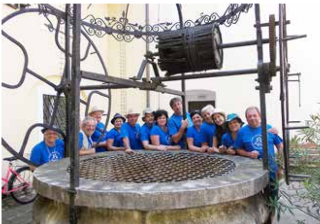
Na dvorišču gradu Velika Nedelja