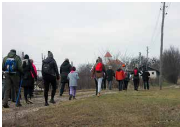
Prešernov pohod 2017 - proti sv. Trojici