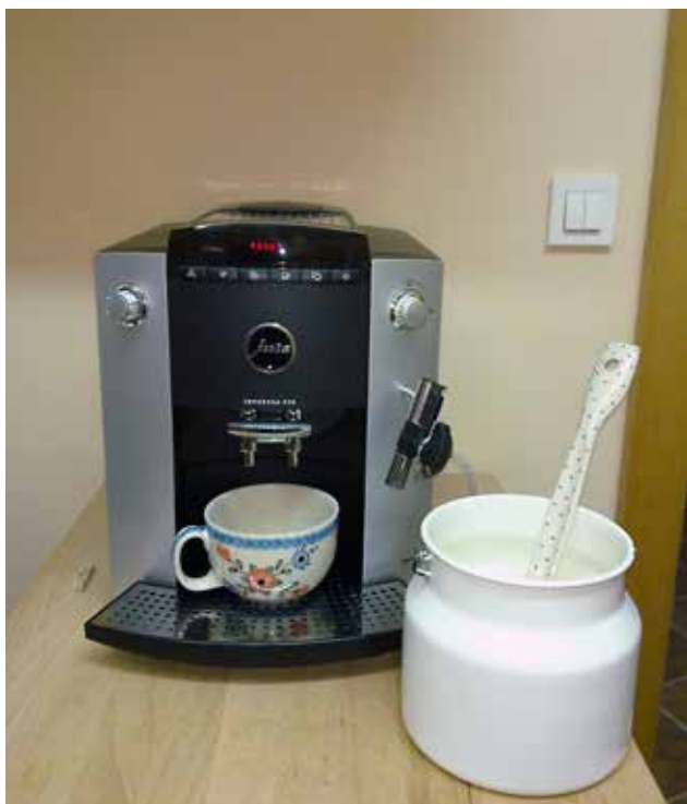
V centru Aqualutra pripravljamo najboljšo kavo z domačim mlekom. Vabljeni na pokušino!

Pred letom smo obljubili, da bomo pod vidrino streho povabili najboljše strokovnjake in raziskovalce,