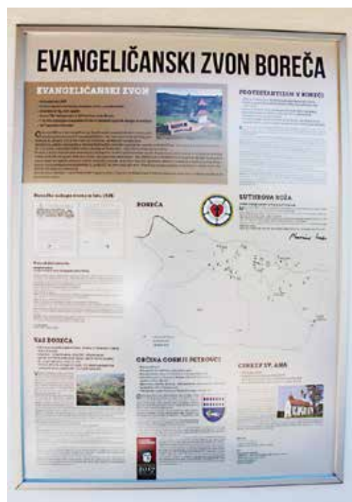
Tabla na evangeličanskem zvoniku v Boreči