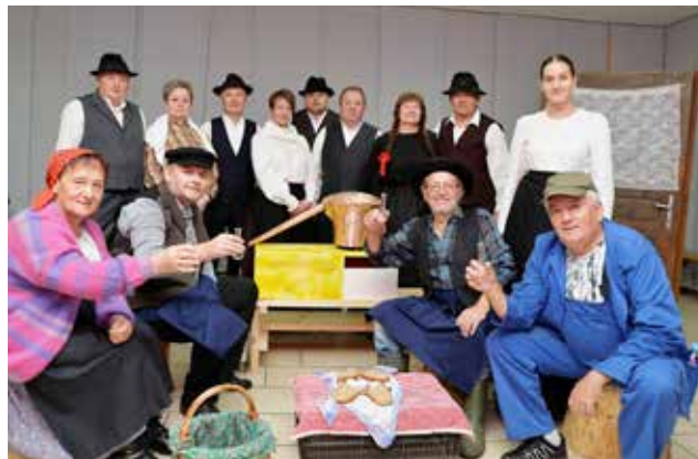
Nastop na Retašadi v Gornjih Petrovcih s skečem: V žganjarni, 21.10.2017