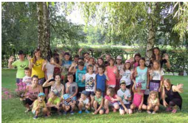
Poletni tabor v Stanjevcih

tudi, da je čas za božični mini disko za otroke, s katerim po navadi zaključimo bumerangastično leto, vmes pa že tradicionalno poskrbimo, da koga tudi obdarimo. Poskušamo pomagati tistim, ki pomoč potrebujejo, včasih finančno, drugič materialno, tretjič pa objem in stisk roke. Vse to nam ni težko in to počnemo celo leto, letos decembra pa bomo poskrbeli, da še dodatno prikrademo kakšen nasmeš na otroško lice.