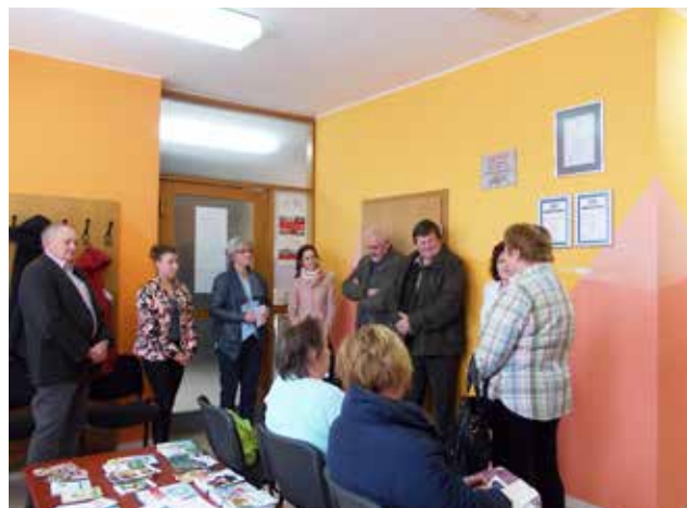
Otvoritev knjižne police »Knjiga za seuf«