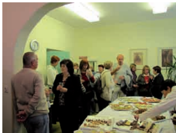
Medicinske sestre iz Ljubljane na obisku zdravstvene postaje Gornji Petrovci