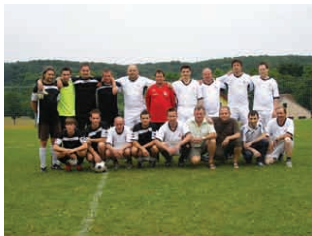
Hajduk Adrijanci in Dangerous, 26. junij 2010

V začetku leta smo odigrali tekme Zimske lige MZ KMN Goričko, kjer smo dosegli odlično tretje me-