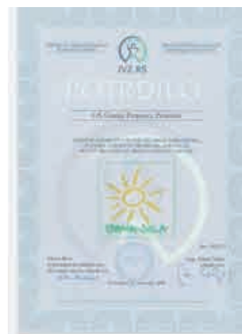
Potrdilo o sodelovanju v mreži zdravih šol

Poleg zdravstveno-vzgojnih vsebin, ki jih vključujemo v učne načrte , skrbimo tudi za uresničevanje skritega učnega načrta (medsebojni odnosi, pravila, klima v šoli, ponudba interesnih dejavnosti), razvijamo sodelovanje s starši, lokalno