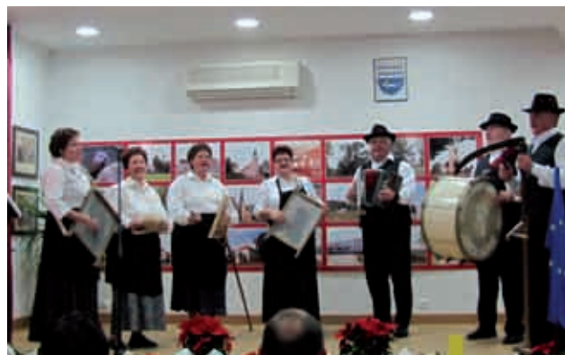
Ljudski pevci in godci TD Vrtanek v prvotni sestavi

Prav tako sem vesel, da ste nastopali na turističnem sejmu v Ljubljani, ki ga organizira Slovenska