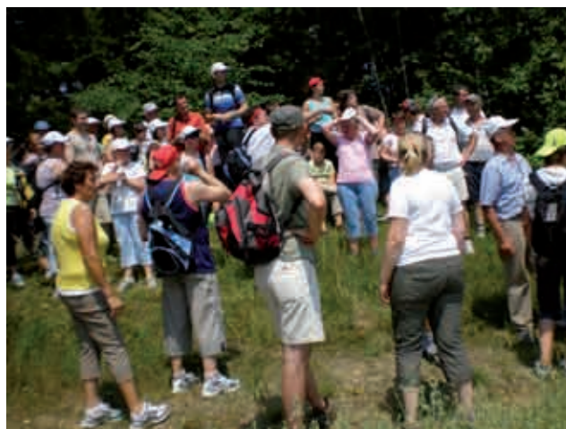
Pohodniki na postanku na Srebrnem bregu

Pot smo zaključili pri cerkvi sv. Ane v Boreči, kjer nas je po krajšem nagovoru župana čakala zaslužena malica. Vsi pohodniki smo bili zelo zadovoljni in veseli, saj je bil pohod res enkrat in nepozaben za vse, predvsem pa za pohodnike iz Odranec, ki teh krajev ne poznajo. Zato lahko trdim, da ta pohod ni bil zadnji.