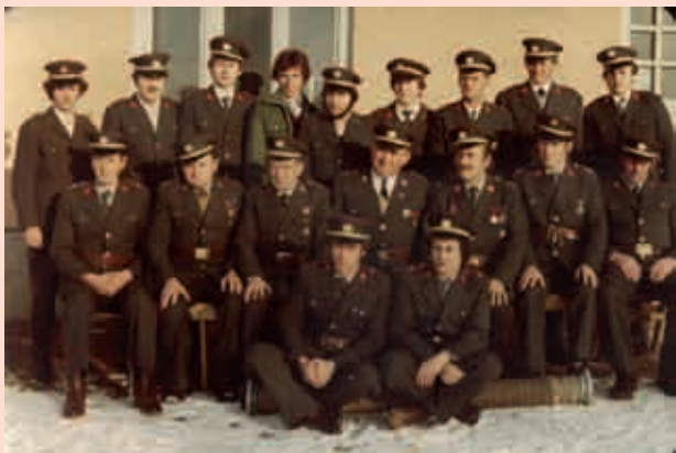
Gasilci PGD Šulinci leta 1981

Članice in člani PGD Stanjevci vas prav lepo pozdravljamo. Zahvaljujemo se vsem, ki so z nami sodelovali v tem letu, predvsem pa Gasilski zvezi Gornji Petrovci, vsem našim članom in članicam za opravljeno delo ter vsem občankam in občanom naše občine.