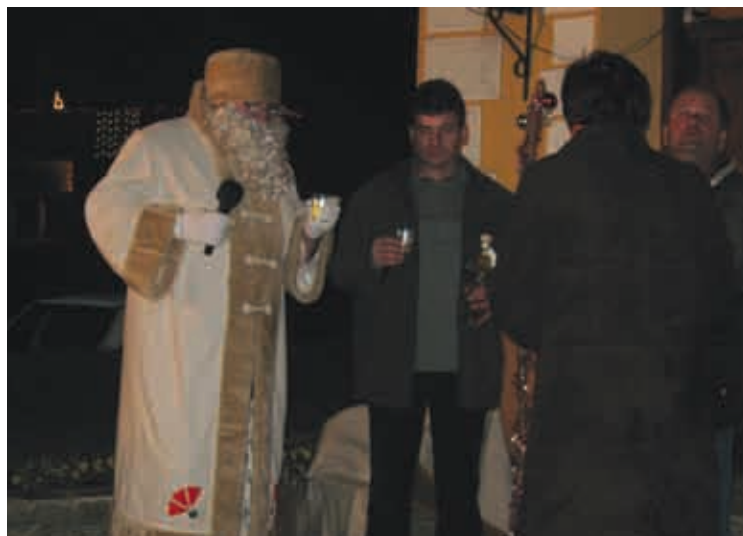
dedek Mraz v Adrijancih

Prireditvev je dobro uspela, našim najmlajšim so se pridružili tudi otroci sorodnikov in družinskih prijateljev, tako da smo bili zadovoljni tudi s številom obdarovancev.