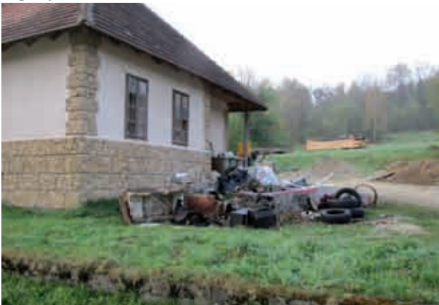
Čistilna akcija v Adrijancih