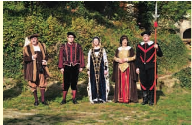
Gornjelendavska in negovska gospoda