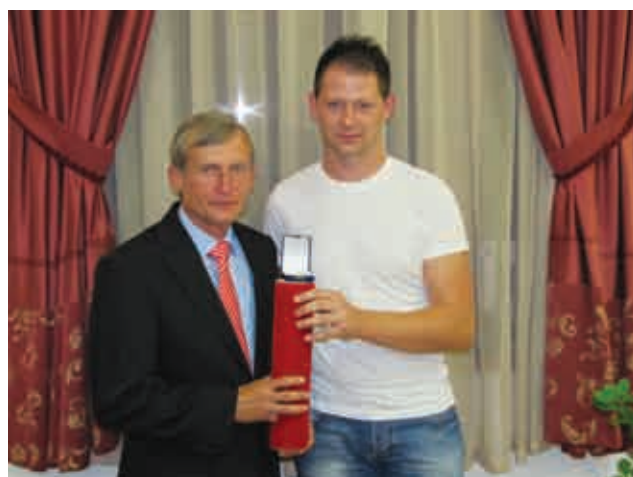
ŠD Lucova je prejelo srebrno plaketo Občine Gornji Petrovci