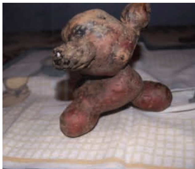
Čudežni krompir iz Stanjevec