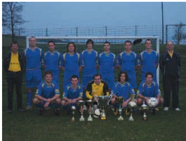
Člani nogometne ekipe ŠD Neradnovci

Člani ŠD lahko tudi letos obiskujejo telovadnico OŠ Gornji Petrovci v zimskem času za rekreativne namene.