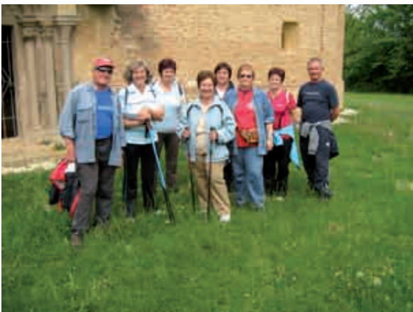
Pohodniki pri cerkvi sv. Martina v Domanjševcih

Tudi rekreacijskega pohoda se je letos udeležilo majhno število pohodnikov. Poleg 25 šolarjev in 5 učiteljev, se je pohoda udeležilo le 8 pohodnikov. Razlog za slab odziv občanov na pohod je verjetno veliko število pohodov, ki jih letos organizirajo naša društva in posamezne vasi. Na prvomajskem pohodu v Adrijancih je bilo