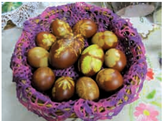
Pisanice Društva žena Kukeč