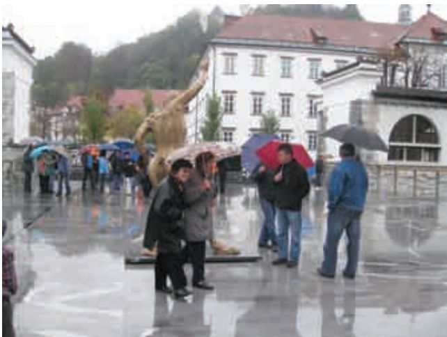
Na Mesarskem mostu na Ljubljani

vane ladvice. Od Mesarskega mostu smo se zopet peš odpravili proti Tromostovju in po Čopovi ulici do NAME, kjer smo počakali na avtobus, ki nas je odpeljal do novega stadiona na Stožicah. Tam nas je pričakala vodička, ki nam je razkazala tako nogometni stadion, kot dvorano za košarko, rokomet in tudi glasbene prireditve. Tu se je naš ogled Ljubljane zaključil. Sledil je družabni del izleta. Odpeljali smo se v Štepanjsko naselje, kjer so nas pričakali gasilci PGD Štepanjsko naselje, ki so pobrateni s PGD Gornji Petrovci. V prijetnem vzdušju smo imeli večerjo, nato pa so zapele harmonike in vesela pesem. Ob osmi uri smo se odpravili domov, prijetno utrujeni in polni novih vtisov s potepanja po naši prestolnici.