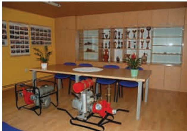
Nova sejna soba gasilcev PGD Lucova