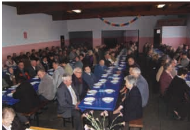
Udeleženci občnega zbora DU v Križevcih