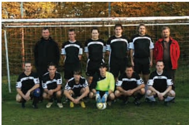
Hajduk Adrijanci, 30. oktober 2010

sto. Slabše nam je šlo v spomladanskem delu lige. Toda kljub zapravljenim priložnostim smo osvojili zadovoljivo sedmo mesto in se obdržali v A ligi. V športu so pač vzponi in padci. Četudi se tokrat ni izšlo povsem po naših željah, še ni bilo nič izgubljenega. Za jesenski del tekmovanja smo si zadali cilj, da obstanemo v A ligi. V končnici smo tri tekme zmagali in tako zasedli celo šesto mesto na lestvici.