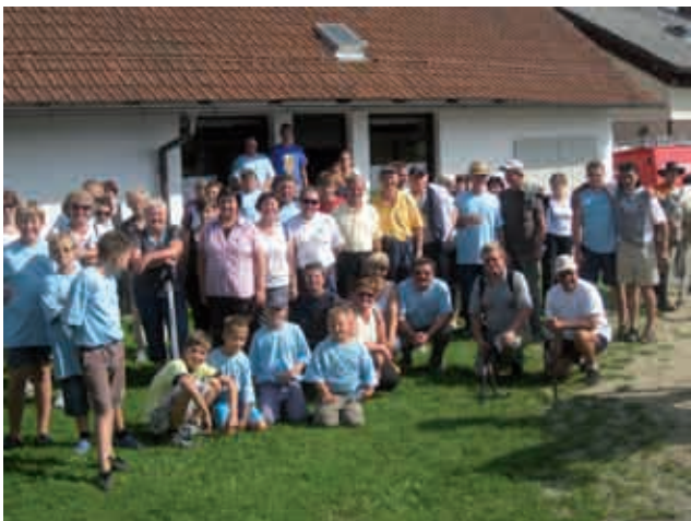
Udeleženci pohoda » Po paute mlinara »