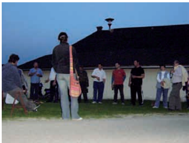
Kres na Kukeču