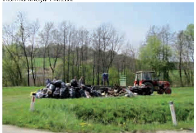
Odlagališče v Stanjevcih