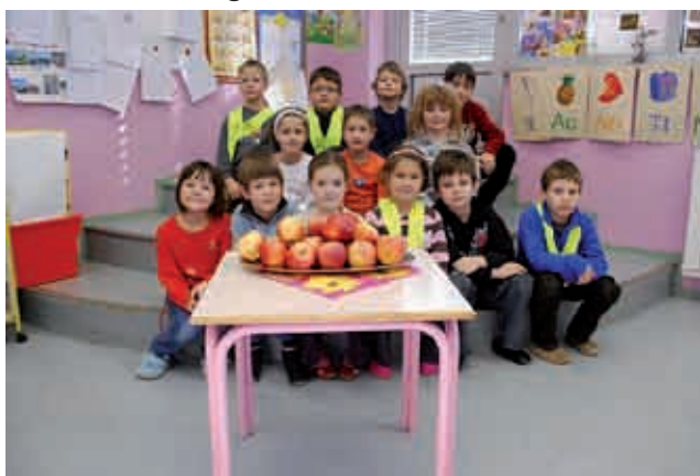
Sadje v razredu

- na roditeljskih sestankih, vključevanje v dneve dejavnosti, občinsko glasilo