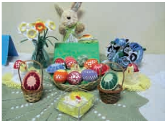
Izdelki Biserke Kuronja iz Neradnovca