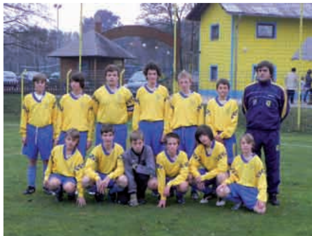
Ekipa U - 12

Po programu je sledila pogostitev, nato pa različne dejavnosti igranja z žogo, skupaj s starši in igralci. Ob lepem vzdušju se je čas hitro iztekkel in zaključili smo v poznih popoldanskih urah.