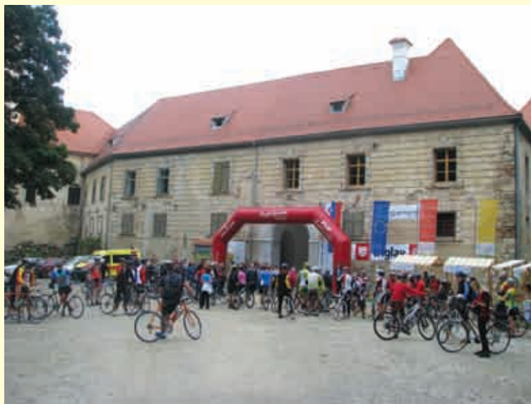
Kolesarji pred gradom