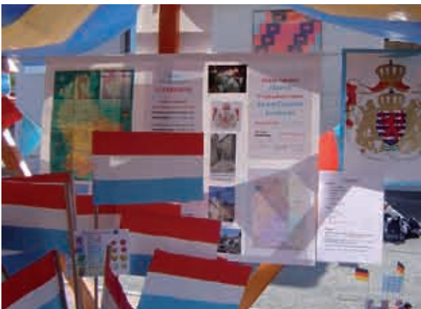
Predstavitve Luxemburga na stojnici v Murski Soboti

Obiskovalce smo na stojnici tudi pogostili s pravimi luksemburškimi prestami in solato