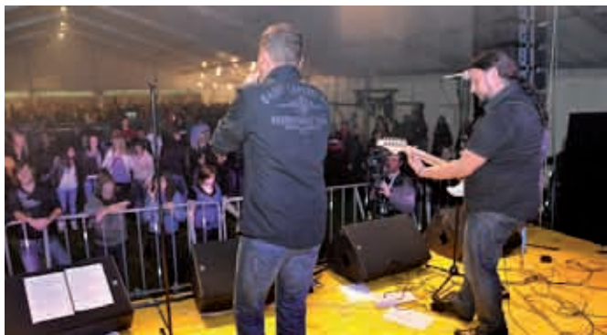
Koncert ansambla Blue Planet v Stanjevcih