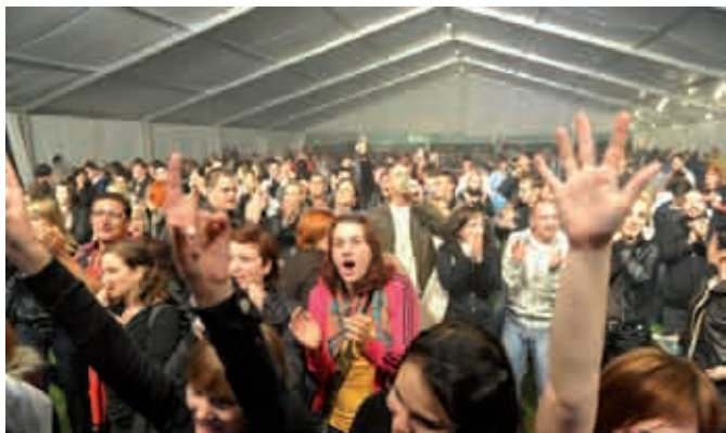
Množica na koncertu