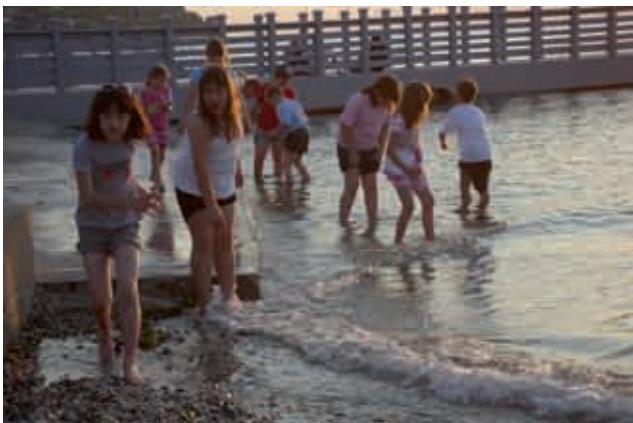
Nabiranje kamnov in školjk