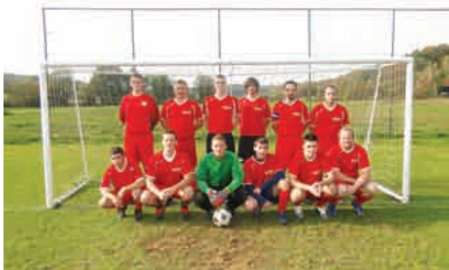
ŠD ŠULINCI - mladi

moštvo veteranov. Razen tega, da sta se obe moštvi pridno udeleževali vseh predvidenih tekem, veterani celo v meddržavni ligi, so organizirali že tradicionalni turnir v malem nogometu. Za lažje premagovanje finančnih obveznosti pa so organizirali tekmovanje v pikadu. Pomagali so si tudi s sponzorji, da so si lahko zagotovili potrebne drese.