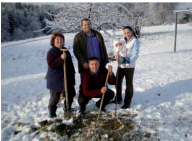
Lucijina jablana je posajena.