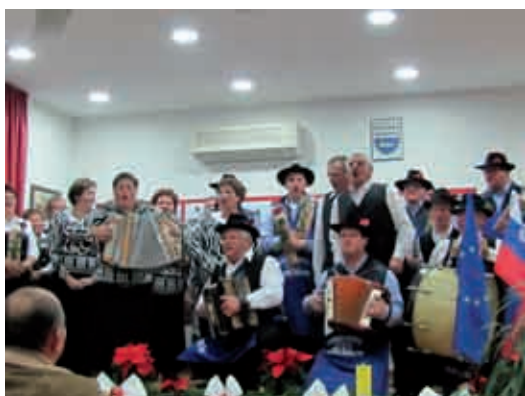
Vsi nastopajoči so zapeli nekaj pesmi

V Občini Gornji Petrovci, in sam osebno, se trudim, da pomagamo vsem kulturnim društvom in turističnim društvom. Tudi vam sem vedno priskočil na pomoč, če ne drugo, pa vedno imate na razpolago občinski kombi, ki vas odpelje na nastope in tekmovanja. Za to se bom trudil tudi v prihodnje.