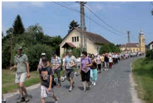
Kozarjev pohod iz Gornjega Senika preko Srebrnega brega do sv. Ane v Boreči

Najprej je bil pohod od Gornjega Senika do sv. Ane v Boreči. Pohoda se je udeležilo čez sto pohodnikov iz Odranec in tudi veliko pohodnikov iz