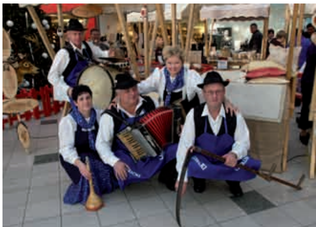
Nastop na » Diši po Prekmurju » v Ljubljani