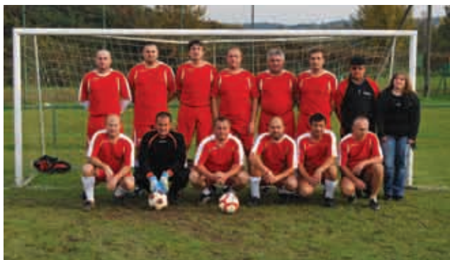
ŠD ŠULINCI - veterani

Sama vaška skupnost posebnih aktivnosti ni organizirala.