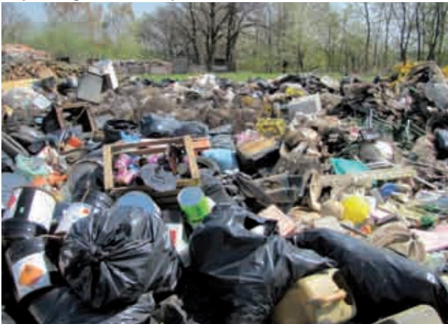
Deponija v Križevcih