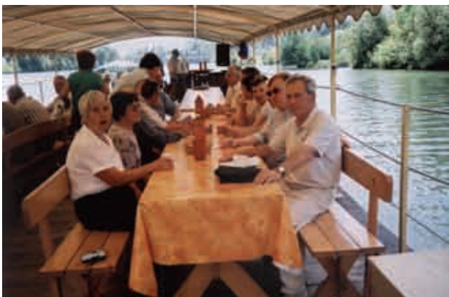
Vožnja s splavom po Savi