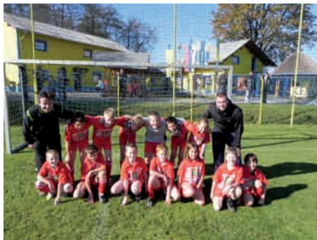
Ekipa U - 8