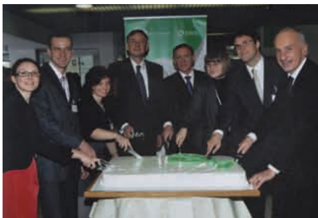
Nagrajencem Krkinih nagrad je pomagal razrezati torto predsednik Republike Slovenije, dr. Danilo Türk.