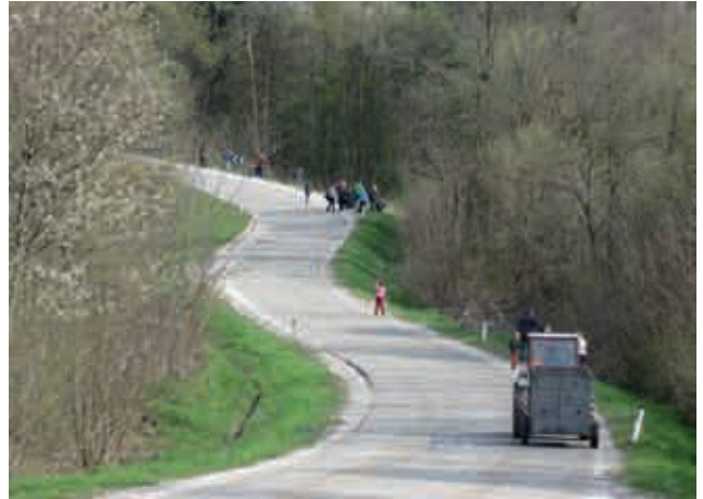
Čistilna akcija v Panovcih