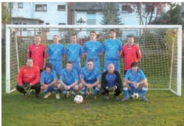
Člani ŠD Srebrni breg Martinje

Nadpovprečno topel november se je končal in že smo globoko v veselem decembru. V mesecu, ki je za najmlajše najlepši mesec, saj jih pridejo obiskat kar trije dobri možje iz severa, za starše in starejše pa malo manj, saj se vsak po svoje trudi, da bi se kar najlepše pripravil na praznike. A kaj, ko nas trgovine kar mamijo z različnim blagom, plače in pokojnine pa se iz dneva v dan zmanjšujejo. Ljudje morajo kar racionalno delati z denarjem, saj se lahko zgodi, da se kaj hitro spozabimo in se nam