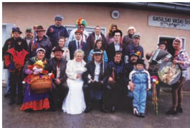
Društvo žena Neradnovci za pusta