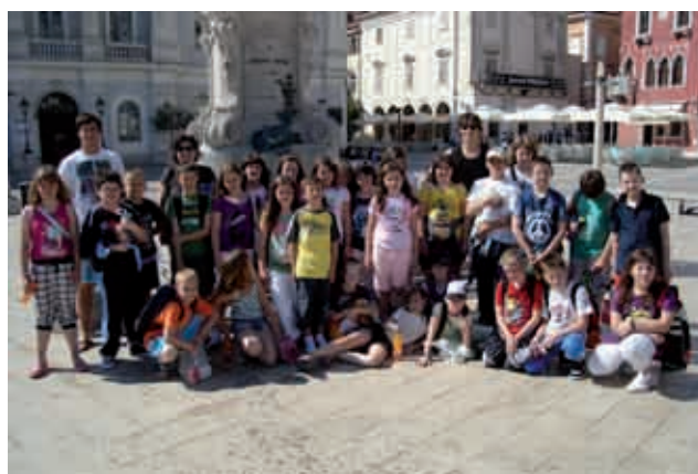
Skupinska slika na Tartinijevem trgu v Piranu