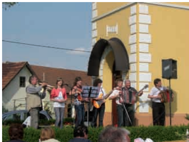
Šolski ansambel Sonček OŠ Puconci