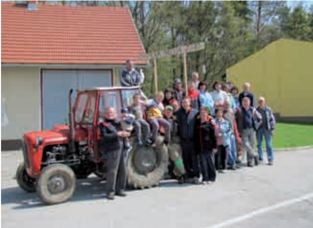
Čistilna akcija v Gornjih Petrovcih