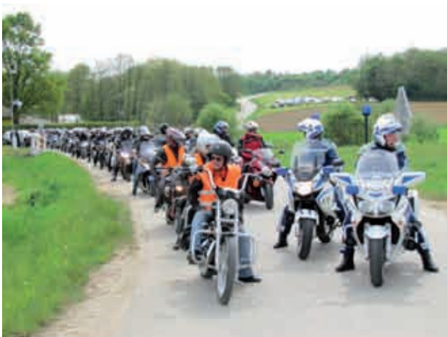
Vožnja po Goričkem ob spremstvu policistov