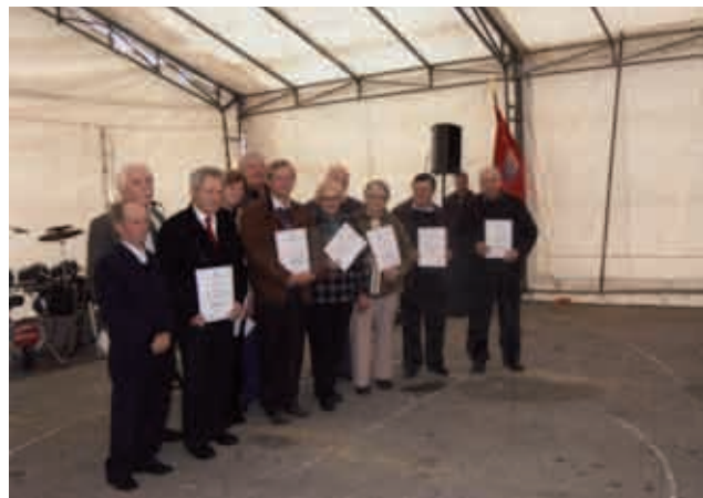
Dobitniki društvenih in občinskih priznanj

Prva seja iniciativnega odbora za ustanovitev društva je bila, 24.10.1999, v sejni sobi občine.