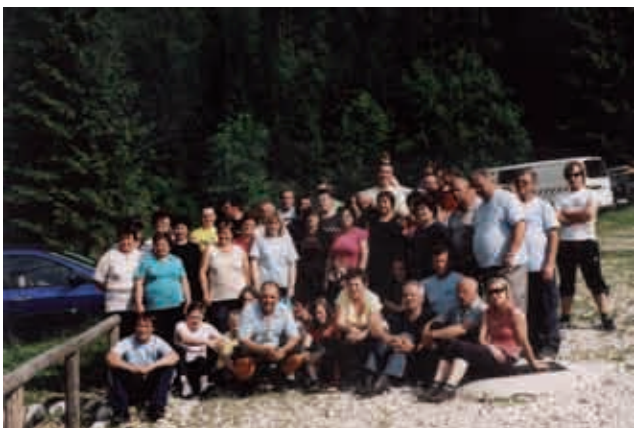
Izletniki na začetku poti

dranje smo se podali v zgodnjih jutranjih urah, 26.06.2010 izpred vaško-gasilskega doma v Stanjevcih. Pot nas je peljala prek Vršiča v dolino Trente in v Lepeno, kamor nas je zapeljal avtobus s 54 udeleženci. Pri domu Klementa Juga smo se zbrali in krenili po udobni mulateri s številnimi zavoji na strmo gozdnato pobočje nad dolino Lepene. Pot nas je vodnila po travnatih goličavah in meliščih pod vznožjem Lemeževega soseda Debeljaka. Hodili smo med gostim ruševjem, poraščenimi griči in čez čas zagledali malo Dupelsko jezero. Pred nami je stal nepogrešljiv Krnov nos. Ko smo prekoračili široko Korito planine Duplje smo prišli do kočice pri Krnskem jezeru. Še malo naprej pa smo zagledali prečudovito Krnsko jezero, ki s svojimi 1.393 m spada med našo največje in najlepše visokogorsko jezero. Dolgo je 400 m, široko pa 150 m in 18 m globoko. Nastalo je v dolini, ki jo je s svojo čelno moreno zgradil ledenik. K njegovi severozahodni obali se spuščajo visoke travnate strmale Lemeža 2.011 m, na jugovzhodu pa se dviga skalnata glava Šmohorja 1.931 m. Jezero se v vročem poletju precej ogreje in je primerno za kopanje. Oživljajo ga izredno številne ribice pisanci, dolgi 10 cm. Opazimo pa tudi malo večje zlatovščice.