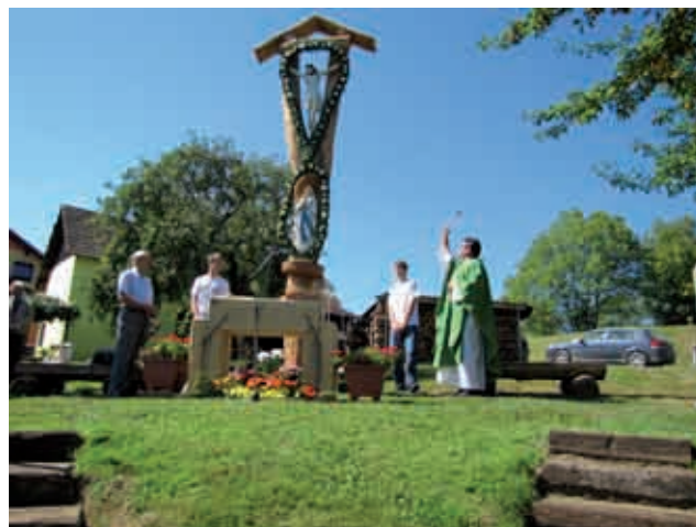
Blagoslovitev križa v Neradnovcih