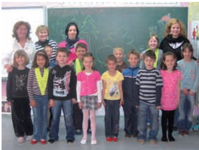
Učenke in učenci 2. razreda OŠ Gornji Petrovci