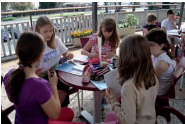
Reševanje delovnega zvezka

Vstajali smo ob pol osmih, ob osmi uri smo imeli zajtrk. Po zajtrku smo imeli učno uro, pri kateri smo reševali naloge v delovnem zvezku. Po kosilu smo se odpravili na zaslužen počitek. Vsak dan smo učencem ocenjevali tudi urejenost sob. Veliko smo se sprehajali, si ogledali mesto Koper, nakupovali, jedli sladoled... V sredo, 26. 5. smo se z ladjico peljali v Piran. Tam smo si ogledali akvarij, pomorski muzej, Tartinijev trg. Učenci so imeli nekaj prostega časa, kar so seveda izkoristili za nakupovanje. V hotelu smo izdelali tudi tehnični izdelek, okvir za slike iz valovite lepenke. Čas, ki smo ga skupaj preživeli daleč stran od doma, je bil nekaj čisto drugačnega kot v šoli, predvsem za učence.