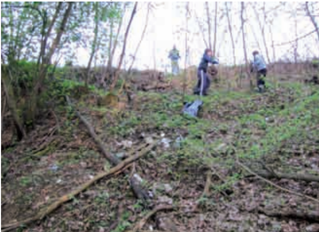
Divje odlagališče v Gornjih Petrovcih