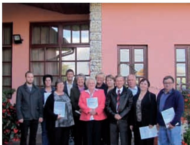
Udeleženci računalniškega tečaja v letu 2010