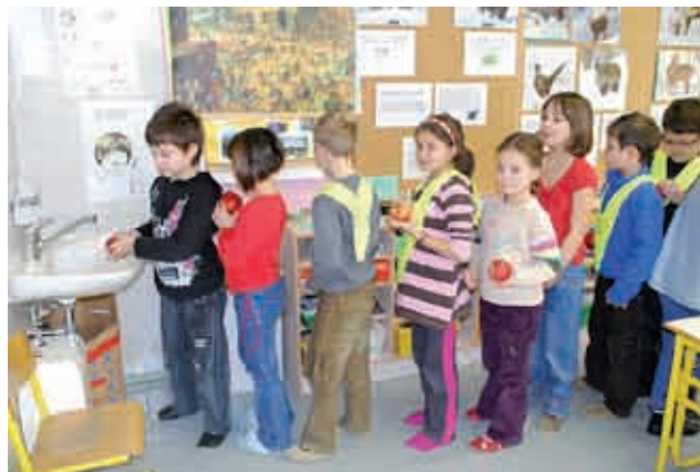
Učenci sami operejo jabolka.

Sodelujemo s strokovnjaki Kmetijsko gozdarskega zavoda Murska Sobota, Zavodom za zdravstveno varstvo Murska Sobota in Sadjarstvom Gomboc .