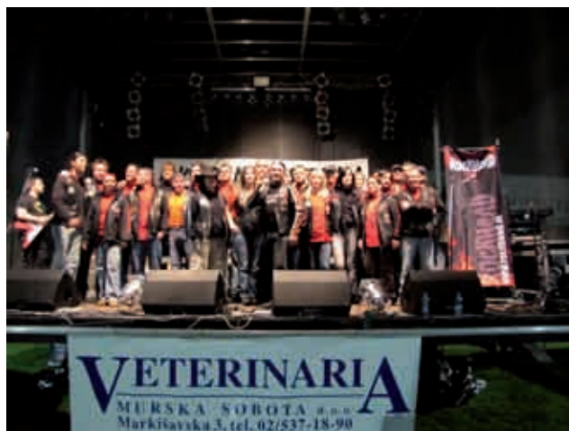
Člani MK GRONSKA STREJLA ob 10. obletnici motorističnega srečanja v Križevcih

Tako organizatorji, kot obiskovalci, so bili tudi letos zelo zadovoljni s prireditvijo. Razšli so se z upanjem, da se prihodnje leto zopet srečajo in nadaljujejo dolgoletno prijateljstvo.