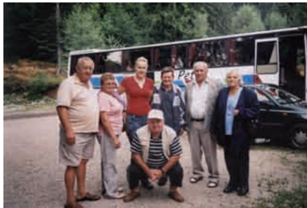
Izlet na Pohorje