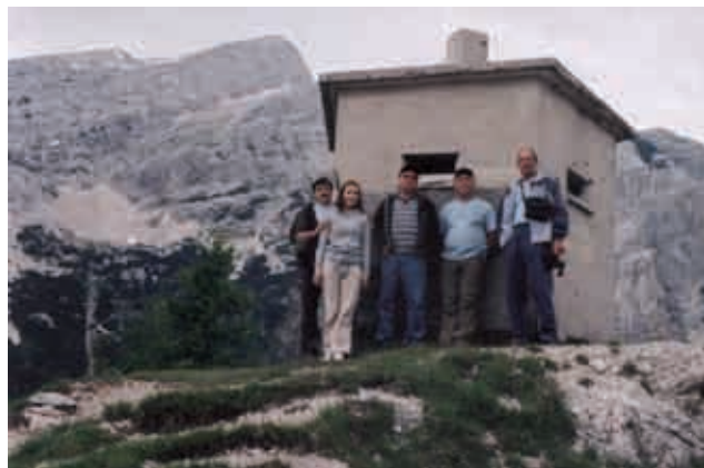
Pri starem bunkerju

Občudovali smo z zanimanjem to prečudovito naravo okoli jezera, se okrepčali in se počasi po isti poti spustili v dolino Lepene. Po kosilu smo krenili po prečudoviti dolini Trente na sam izvir bistre Soče, ki je hči planin in izvira pod sinom slovenskih planin, Jalovcem. Močno žuborenje številnih slapov nas je pripeljalo do luknje iz katere pride na dan naša gorska reka. Po ogledu smo se ustavili na Vršiču in si ogledali panoramo Julijskih Alp, ki so vabile marsikoga v svoje naročje. Dan se je počasi nagibal proti večeru zato smo zadovoljni in utrujeni krenili proti domu. Izlet je za marsikoga prinesel prelepo doživetje in druženje v kraljestvu naših gora.