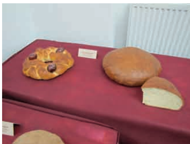
Društvo žena Kukeč