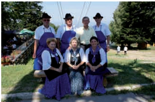
Nastop na Pohorju

Ob koncu leta smo popestrili adventni čas z našim 6. srečanjem Ljudskih pevcev in godcev pod naslovom » ZAPOJMO IN ZAIGRAJMO NA GORIČKI ZEMLJI ». Udeležili so se ga pevci in godci iz Slovenije, Madžarske, Hrvaške in Romunije.