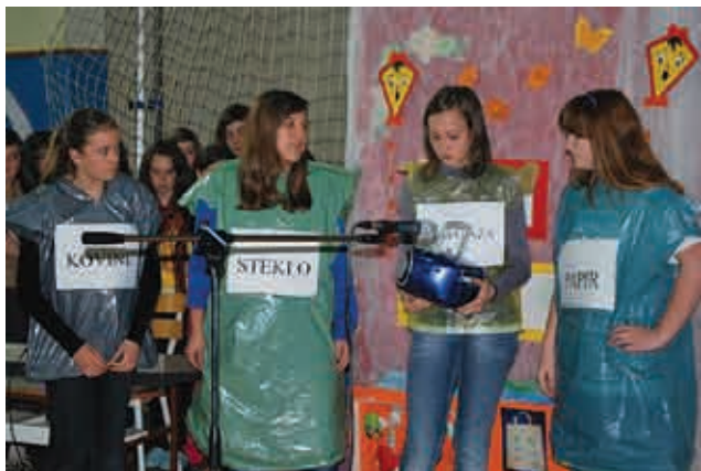
Otroci so ponazorili ločevanje odpadkov

Tudi v šolskem letu 2010/2011 uresničujemo cilje ekošole. Vodilni tematski sklopi v tem letu so ENERGIJA, ODPADKI IN VODA. Spremljajoči pa Eko branje za eko življenje, Mi in naša preteklost, likovni natečaj: Prednovoletni čas, sodelovali bomo v projektu Šolska VRTilnica: ustvarjaj-