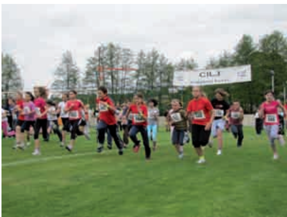
Tek deklic in dečkov

Tekmovalci so prejeli diplome in kolajne za prva tri mesta v posamezni kategoriji ter pokale za absolutno najhitrejšega pri moških in ženskah na progi dolžine 7.000 metrov.