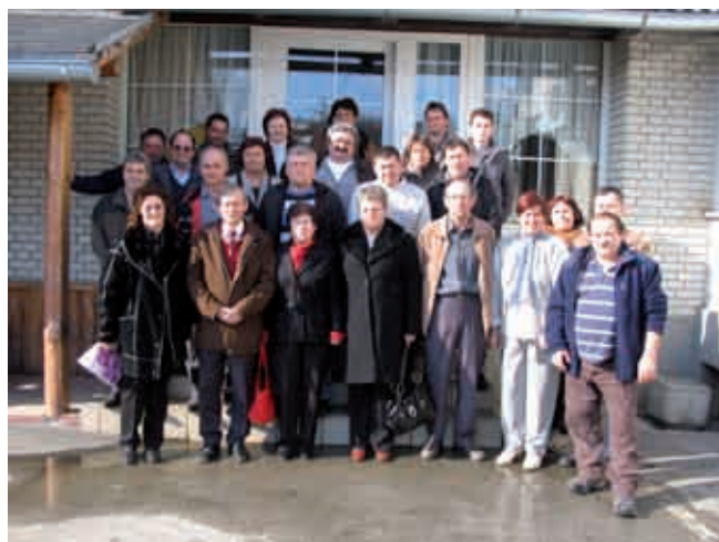
Krvodajalci KORK Gornji Petrovci, 04.02.2010