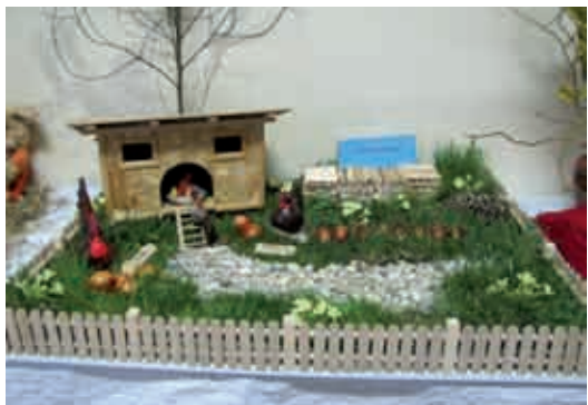
Izdelek vasi Križevci