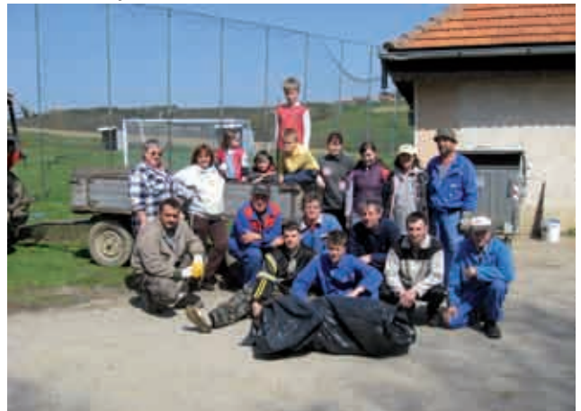
Čistilna akcija v Neradnovcih