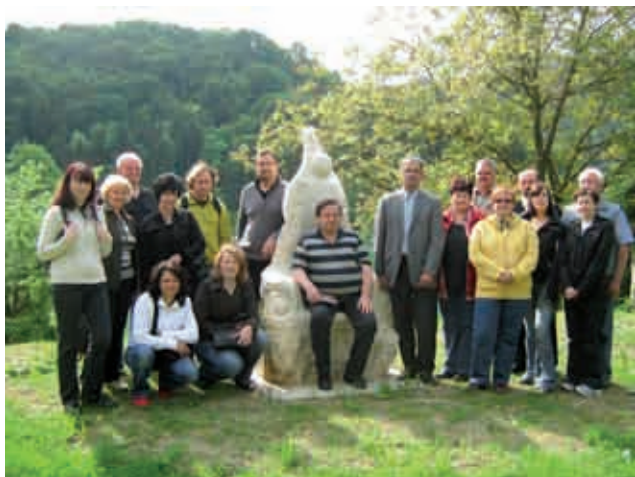
Na dvorišču Kozjanskega parka v Podsredi

Zadnja postaja na naši poti pa je bila vas Olimje, kjer smo si ogledali minoritski samostan, čokoladnico in pivovarno. Trg pred minoritskim samostanom je zelo lepo urejen v park, v katerem so predstavljena številna zelišča, ki jih minoriti gojijo in iz katerih izdelujejo domača zdravila, ki jih prodajajo v svoji lekarni. Polni prijetnih vtisov in spominov na številne znamenitosti in kraje, ki smo si jih ta dan ogledali, smo se odpravili prosti domu in pri gradu Grad na našem Goričkem zaključili izlet.