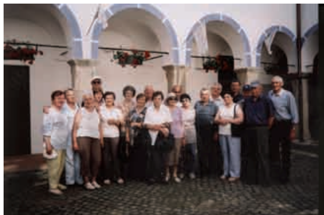
Na Sevniškem gradu