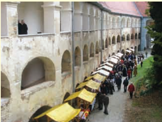
Sejemsko vzdušje na jesenskem bazarju