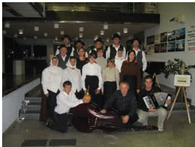
Člani KUD Goričko v hotelu VIVAT V Moravskih Toplicah