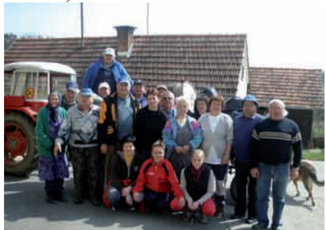
Čistilna akcija v Boreči