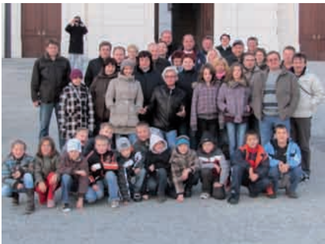
Mladi nogometaši ekipe U-10 s starši na turnirju v Bratislavi

so sodelovale ekipe, članice prvoligaških klubov iz Bratislave. Vsi so imeli ekipe, katerih igralci so bili stari 10 let. Mi pa smo imeli tudi mlajše, 9 ali 8 let. Na samem turnirju je bilo vzdušje lepo in razburljivo. Predvsem za naše najmlajše nogometašice in nogometaše je bilo to pravo doživetje. V spominu jim bo ostalo tudi to, da so že tako mladi igrali v velikem mestu Bratislava. Po končanem turnirju, ob 16.30 uri, smo se napotili domov. Prispeli smo v zelo zasneženo Slovenijo in Občino Gornji Petrovci, kjer nas je ob 22.00 uri pričakala lepa, snežna zimska idila.