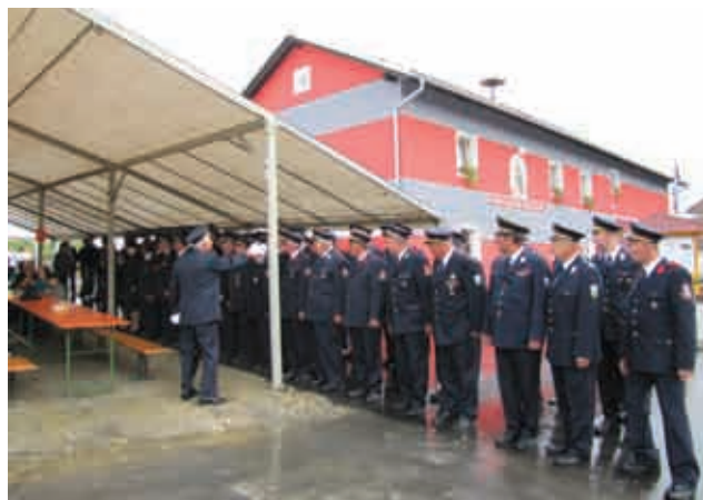
Zbor gasilcev pred prireditvijo