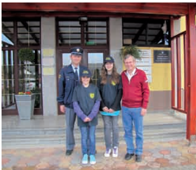
Učenki na obisku pri županu, 15.04.2010

V drugem delu aktivnosti sta se učenki z vodjo policijskega okoliša odpeljali na teren, kjer sta spoznali delo in delovno okolje vodje policijskega okoliša. Ob tem so prav tako obiskali Urad župana občine Gornji Petrovci, kjer so z županom pokramljali o