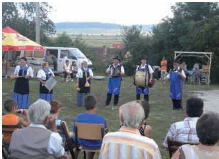
Nastop v Transilvaniji v Romuniji