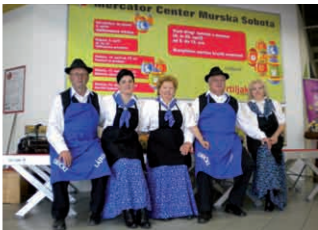
Nastop v Mercatorju

Ob koncu leta smo popestrili adventni čas z našim 6. srečanjem Ljudskih pevcev in godcev pod naslovom » ZAPOJMO IN ZAIGRAJMO NA GORIČKI ZEMLJI ». Udeležili so se ga pevci in godci iz Slovenije, Madžarske, Hrvaške in Romunije.