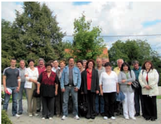
Krvodajalci KORK Gornji Petrovci, 02.09.2010