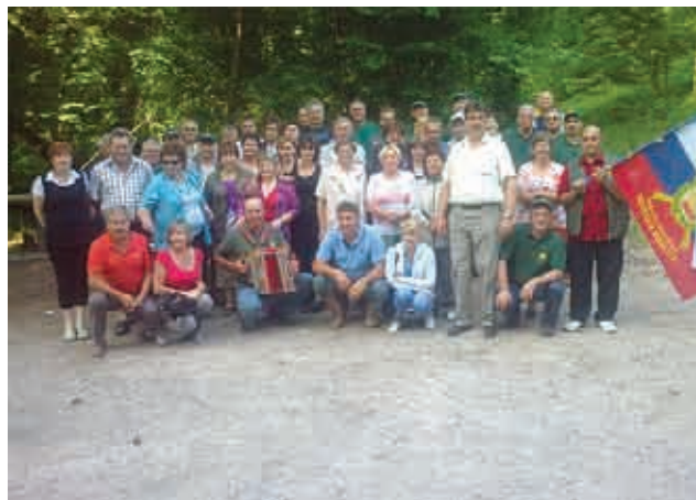
Vojni veterani na izletu v Idriji