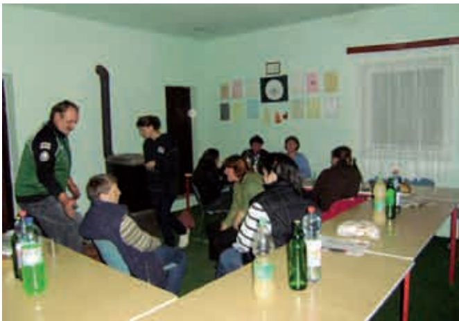
Kostanjev piknik na Kukeču