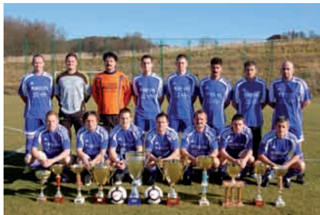
Ekipa ŠD Lucova v letu 2010

V sezoni 2009/2010 smo do zadnjega kola tekmovanja v ligi hoteli pridobiti še en rekord, ki nam še manjka v zgodovini našega delovanja, to je postati prvak z vsemi osvojenimi točkami. Do zadnjega kola smo imeli poln izkupiček, toda spodrsnilo nam je v zadnjem kolu v Neradnovcih.