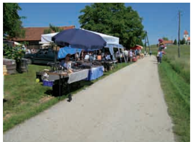
Sejem Buča pod Nedelo

Tudi danes predstavlja sejem svojevrstni družabni dogodek in v zadnjem času tudi prvovrstno turistično prireditev. Sejmi so bili vedno paleta raznovrstne ponudbe za široke množice. Kdor pa želi kupiti kakovosten izdelek, bo pa šel v specializirane trgovine