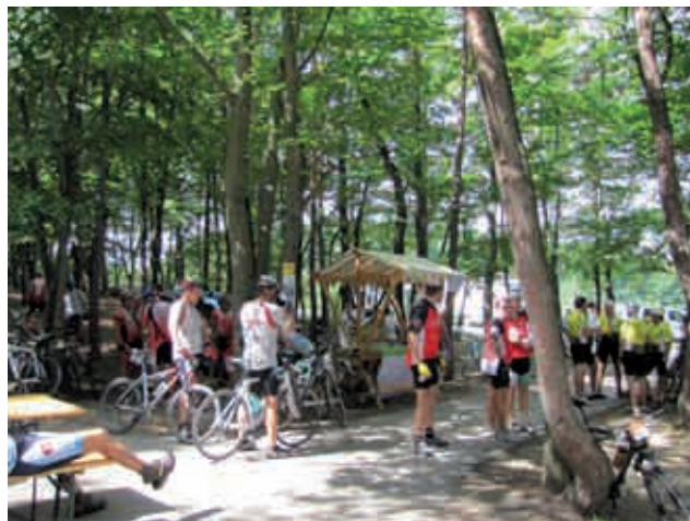
Kolesarji v Križevcih

Na kontrolni točki smo skupaj z Občino Gornji Petrovci organizirali predstavitev domačih ponudnikov na stojnicah in tako omogočili vsem kolesarjem in spremljevalcem, da so lahko poskusili in kupili dobrote z goriških kmetij.