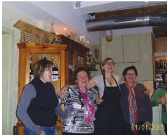
TD VRTANEK v prekmurski gostilnici Mencigar - Nobile v Lj.