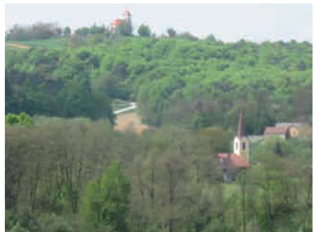
Pogled na cerkev sv. Trojice in kapelo v Adrijancih

Letošnje prireditve se je udeležilo do zdaj rekordno število pohodnikov-bilo nas je okrog 200. Po pozdravnem govoru smo se ob 10.30 uri podali na pot. Krenili smo po makadamski cesti proti Markovcem ter se na križišču obrnili proti Lucovi. Šli smo mimo Pujcovi, ter se po poljski poti odpravili proti gozdu. Vreme je bilo prijetno, včasih kar pretoplo za ta letni čas. Skoraj prevroče sonce so kdaj pa kdaj delno prekrili čudoviti oblaki ter za hip prekinili pripeko vročih sončnih žarkov, ki so nas ob hoji pošteno ogreli. Pihal je prijeten pomladni veter, ki je hladil naša pregreta telesa. Lepšega vremena si organizatorji res nismo mogli želeli. Hoja po gozdu je bila v primerjavi s hojo po pripekajočem soncu osvežujoča in prijetna. Skozi