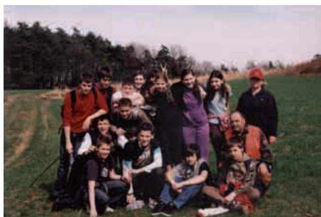
Učenci OŠ Gornji Petrovci pod Donačko goro