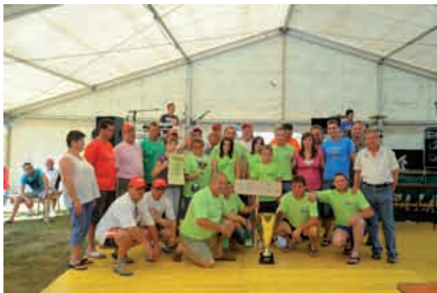
Zmagovalna ekipa vasi Košarovci