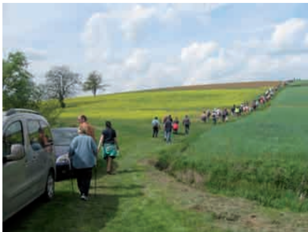
Veselo v hrib.