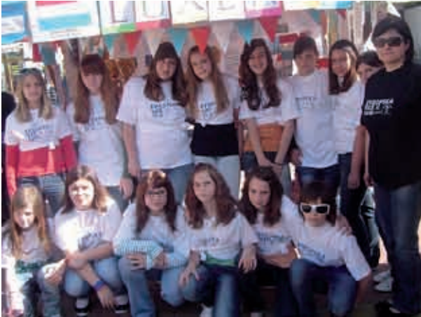
Otroci na predstavitvi Luxemburga v Murski Soboti

mih, ki jih vidijo mladi v Evropi in Sloveniji.