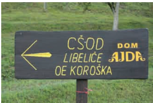
Smerokaz k domu Ajda