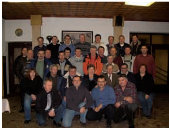
Krvodajalci KORK Ženavlje, 14.01.2010