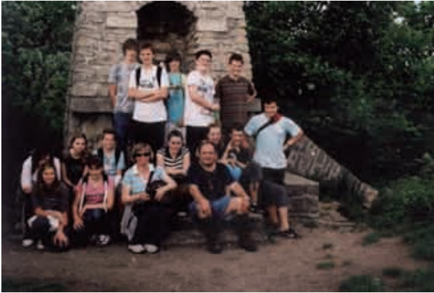
Na vrhu Donačke gore

se prek Ptujске gore proti Stopercam, od koder smo peš krenili proti Rudijevemu domu, ki stoji na Polajžerjevem travniku na Sedlu pod vrhom Donačke gore, ki je dobila ime po cerkvi Sv. Donata. Staro ime gore je Rogaška gora. Pri domu smo se malo odpočili, okrepčali in nato krenili po dokaj strmi poti proti vrhu. Na vrhu so se nekateri utrujeni posedli, drugi pa smo občudovali razglede, kar se jih je dalo videti. Namreč Donačka gora je porasla z gozdom, zato so razgledi slabši. Na vrhu je tudi sezidan neke vrste stolp, vendar ni razgleden. Po počitku smo počasi krenili proti Rudijevemu domu, kjer nas je čakal avtobus. Učenci so bili zadovoljni kakor tudi midva, saj je spet uspel lep izlet na naše gore.