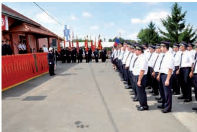
Zbor gasilcev pred gasilskim domom v Križevcih

22. avgusta 2010 smo razvili nov prapor. Na prireditvi so se zbrali gasilci PGD iz naše občine, počaščeni pa smo bili tudi s prihodom gasilcev s pobratenega PGD Turnišče - Ptuj ter sosednjih društev: PGD Domanjševci, PGD Lončarovci in PGD Kuštanovci. Svečanost so s svojim obiskom