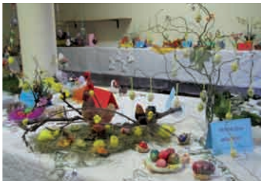
Izdelki Društva žena Neradnovci