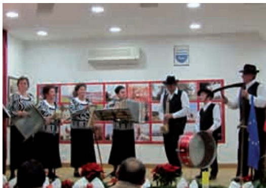
Današnji člani Ljudskih pevcev in godcev TD Vrtanek

turistična organizacija, na Radgonskem sejmu in na številnih prireditvah v sosednjih občinah in širom po Sloveniji. Občina Gornji Petrovci vam je v okviru praznovanja letošnjega občinskega praznika podelila za 10 let delovanja in za ves vaš trud in opravljeno delo na kulturnem in glasbenem področju, Diplomo občine Gornji Petrovci.