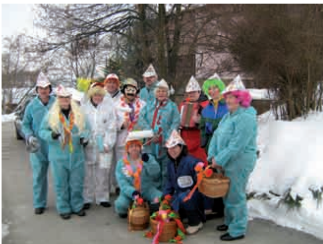
Člani TD Vrtanek na pustno nedeljo