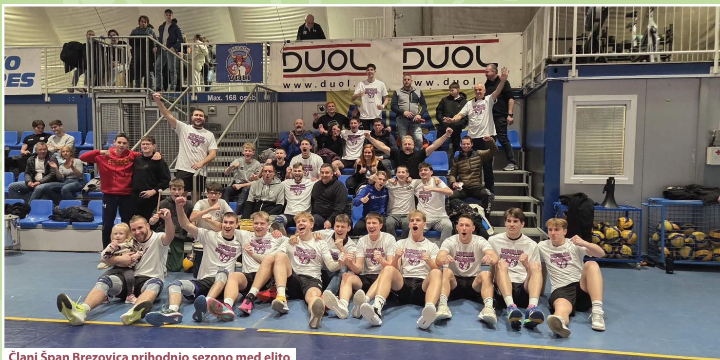
Člani Špan Brezovica prihodnjo sezono med elito