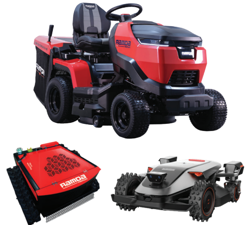
UREJENA TRATA CELO LETO

*Rastlina meseca 3831094201496 v akciji je brez okrasnega lončka.