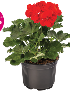
RASTLINA MESECA - PELARGONIJA

*Rastlina meseca 3831094201496 v akciji je brez okrasnega lončka.