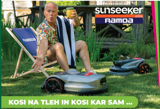
KOSI NA TLEH IN KOSI KAR SAM ...