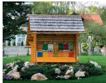
Čebelnjak v Zdraviliškem parku