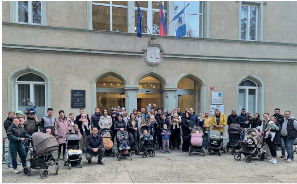
Starši z novorojenčki, rojenimi v letu 2025