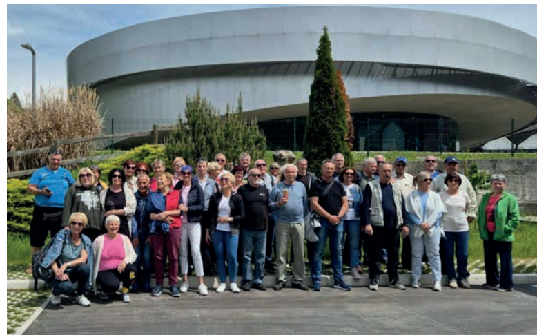
Klub Maksa Perca na izletu v Vitanjah