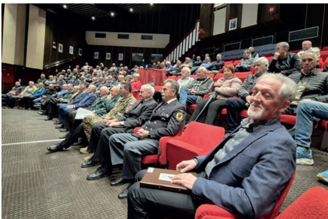
Letni zbor.

Na letnem zboru v Poljčah so pregledali delo, podelili priznanja in sprejeli načrte za leto 2026.