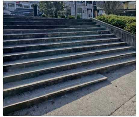
Obnovljeno stopnišče