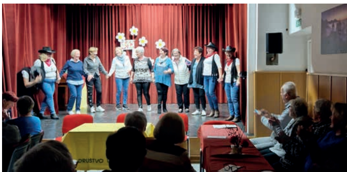
Na občnem zboru DU Zasip

Tako kot v društvu upokojencev skrbijo, da se ljudje srečujejo na skupnih piknikih, potujejo, se veselijo in ustvarjajo lepe spomine, se posamezniki trudijo tudi v drugih društvih ohraniti be-