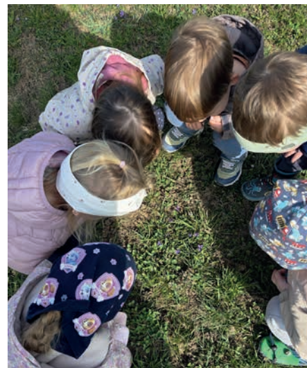
Iz zemlje je pokukala drobna vijolica

Lepo vreme nas kar kliče na prosto, sonček pa že med zajtrkom trka po našem oknu in nas vabi na potep. Narava je prostor, kjer se otroci povežejo na čisto drugačen način. Je prostor, kjer vsak najde svoje mesto za igro in material, s katerim rokuje. Pa še na pretek ga je, če se še kdo domisli podobne igre kot ti. Narava je prostor, kjer otrok potrebuje pomoč prijatelja, le-ta pa jo z veseljem ponudi (roko ob padcu, svežo rožico namesto uvele ali celo palčko namesto polomljene). Narava je prostor, kjer vsak lahko zasije in je najboljša različica sebe. Je prostor, kjer se prebudi domišljija: palice postanejo ribiške, oživijo vsi palčki, ki se skrivajo pod koreninami, v loncih se kuha "juha" in storž se spremeni v sladoled. Vsaka luknjica lahko skriva nekaj zanimivega in – hej! – zakaj ne bi pokukali notri? Vrtčevsko igrišče nudi neskončno priložnosti za igro na prostem, lepa narava pa je čisto na dosegu roke. V mesecu marcu se vrsti-