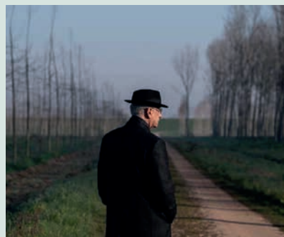
Mojstrski italijanski film