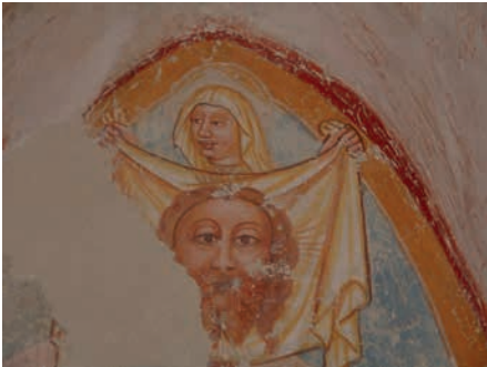
Kapela sv. Ivana, prizor Veronikina tančica

V Bitenčevi dvorani bo od 1. aprila do 14. junija na ogled razstava Legenda o Veroniki Deseniški , ki odpira pogled v eno najbolj pretresljivih in hkrati romantičnih zgodb srednjeveške zgodovine. Gre za gostujočo razstavo, s katero Zavod za kulturo Bled in Muzeji Hrvaškega Zagorja nadaljujejo uspešno sodelovanje.