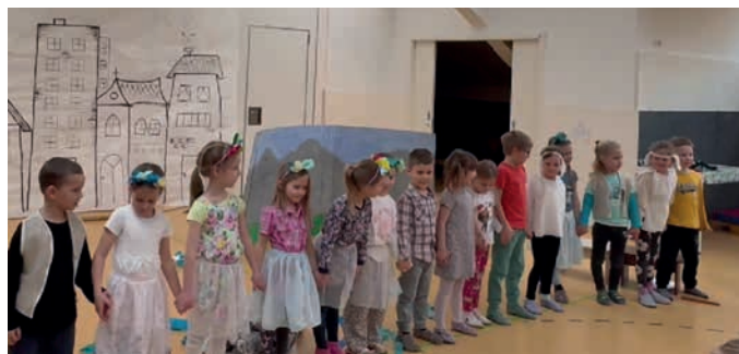
Dramatizacija Kako je nastalo Blejsko jezero?

V februarju smo na popoldansko srečanje povabili starše. Najprej smo jim zaigrali našo dramatizacijo. Sledilo je skupno ustvarjanje. Starši so zavihali rokave in skupaj z otroki strigli, lepili, risali in sestavljali. Končni izdelek je unikatna maketa je-