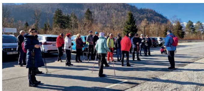
Nomenj ŽP, pred odhodom

Od plavža sv. Heme smo pot nadaljevali po kolesarski stezi do