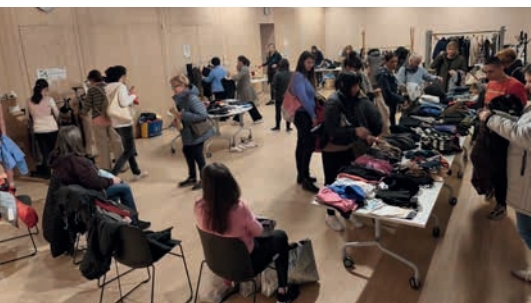
Izmenjevalnica oblačil

Priljubljene izmenjevalnice oblačil se vračajo! Občina Bled v sodelovanju z Infrastrukturo Bled in društvom Ekologi brez meja nadaljuje z organizacijo dogodkov, ki stremijo k zmanjševanju tekstilnih odpadkov. Pomladna oblačila za odrasle in