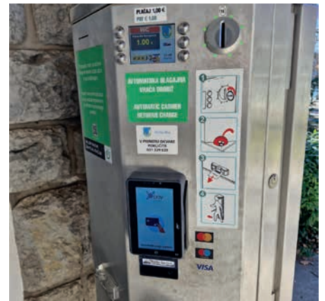
Možnost plačila s plačilnimi karticami