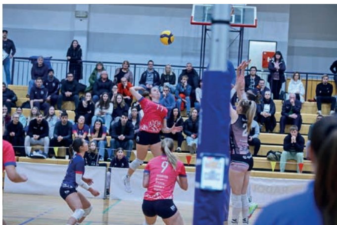
Domače odbojkarice pred velikim podvigom; Foto: F. Humerca

Domače odbojkarice AFM Volley so dosegle izjemen uspeh in se uvrstile v polfinale državnega prvenstva. Po zmagi na prvi tekmi v gosteh so odločilen korak naredile 18. marca na domačem igrišču, kjer so pred več kot 400 gledalci z drugo zmago v četrtfinalni seriji proti favorizirani ekipi Luke Koper Volley potrdile napredovanje med štiri najboljše ekipe v državi.