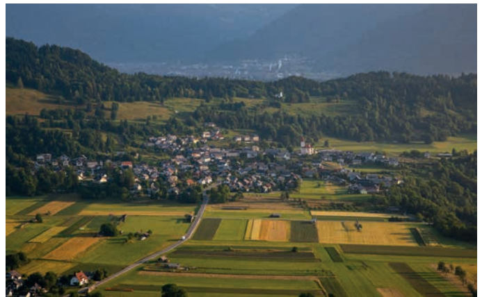
Vas Zasip

Obvezne prijave sprejemamo do 9. aprila do 12. ure s klicem