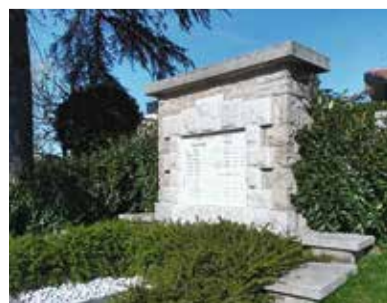
Ob železnici v Dobravljah...