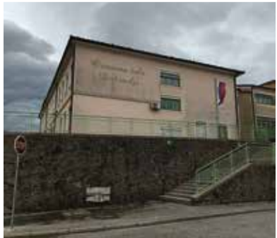
Osnovna šola v Dobravljah.

Ta zgodbica je bila zapisana v letu 1988, v bližnjih Skriljah, od koder hodijo otroci v Dobravlje v osnovno šolo. Takrat je bila objavljena v šolskem glasilu OŠ Dobravlje, v Čavnu.