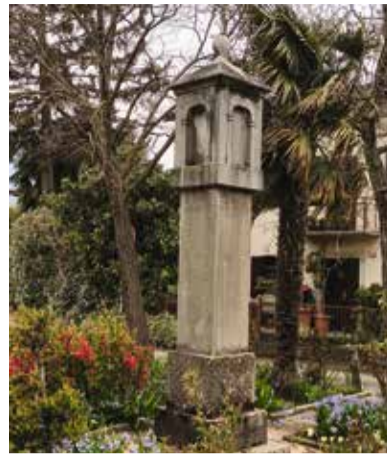
Pil Na Kržišu, kjer cesta zavije v Pikče in Kozjoparo ...