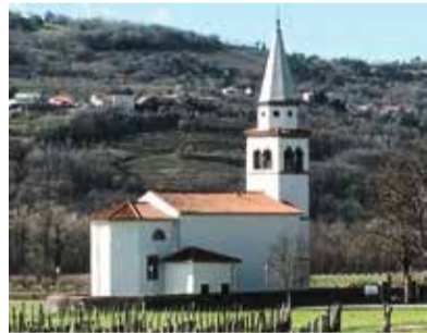
Cerkev sv. Petra pod Dobravljami ...

Na tabli zraven cerkve 4 sv. Petra pod Dobravljami piše, da je ta cerkev znana zaradi poslikav slikarja Cebeja iz Šturij, enega osrednjih baročnih slovenskih slikarjev iz 18. stoletja. V 13. in 14. stoletju naj bi bilo polje pod Dobravljami poraščeno s hrastom dobom. Od tod tudi ime vasi. V času turških vpadov so se v ta hrastov (dobov) gozd zatekli vaščani in so potlej iz hvaležnosti, ker so se tako rešili, tam postavili cerkev. Davna zgodba pa pravi, da so prvotno cerkev hoteli zgraditi na območju današnjega zaselka Hrib. A vse kamenje za gradnjo, ki so ga čez dan tja navozili, je bilo ponoči prestavljeno na prostor 5 ,