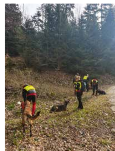
Projekt CROSS ALERT sofinancira Evropska unija v okviru Programa Interreg VI-A Italija-Slovenija. // Il progetto CROSS ALERT è co-finanziato dall'Unione europea nell'ambito del Programma Interreg VI-A Italia-Slovenia.

Projekt tako predstavlja pomemben korak k večji varnosti in boljši pripravljenosti na izzive, ki jih prinašajo podnebne spremembe, hkrati pa utrjuje sodelovanje med partnerji na obeh straneh meje.