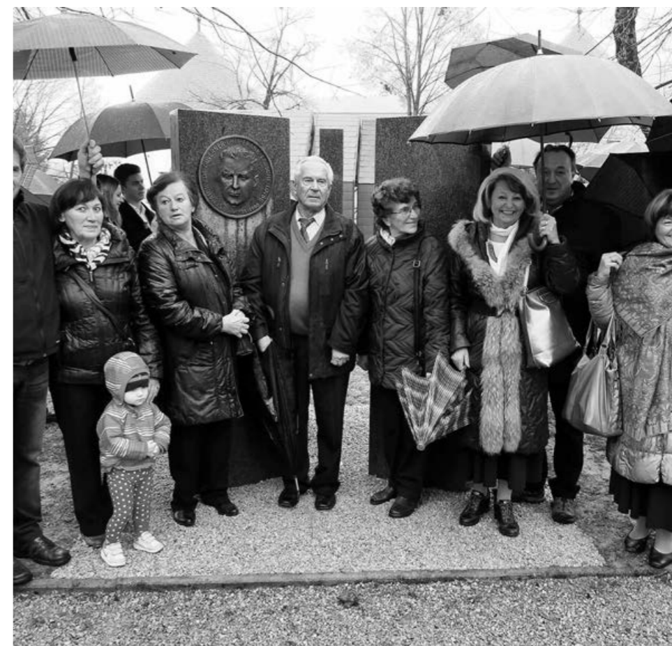
Lovšetovi sorodniki pred obeležjem