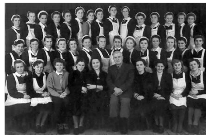
Kuharski tečaj okr. 1955

Na pogorišču požgane šole je zgradil novo, ustanovil KUD in formiral pevski zbor. Bil je spoštovan zaradi preudarnosti, pravičnosti in delavnosti. L. 1973 je dobil Janševo priznanje za dvig slovenskega čebelarstva. V Suhi