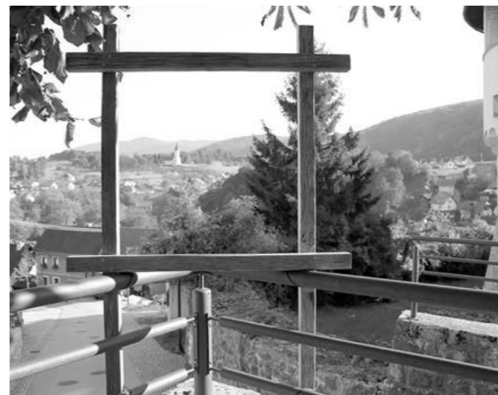
Zeleno okno Žužemberka

Ob svetovnem dnevu turizma, 27. septembra, smo v Sloveniji odprli 50 Zelenih oken, med katerimi je bilo tudi 'Zeleno okno Žužemberka'.