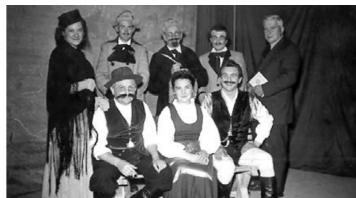
DRAMSKA SKUPINA / UPRIZORITEV »Županove Micke« l. 1957

Umril je leta 1973. Pokopan je v Žužemberku.