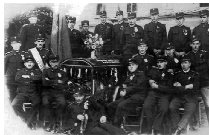
Gasilska četa okr. 1937