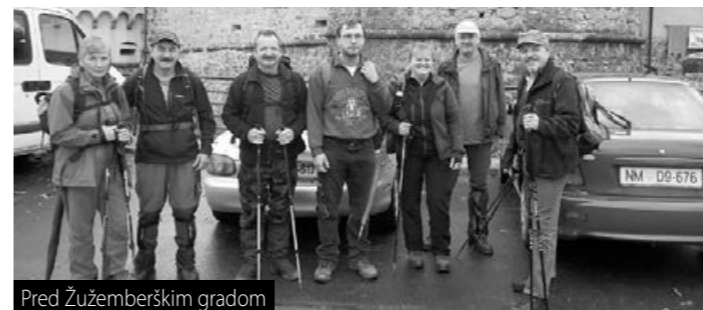
Pred Žužemberškim gradom

Letošnjega Martinovega pohoda se je 6. novembra zaradi slabe vremenske napovedi udeležilo le 8 pohodnikov, ki pa smo bili nagajeni le z enim dežnim nalivom. Ta nas je močil le od Vrtača do Arčelce. Na ruševinah Šumberškega gradu z izjemno zgodovino in zanimivo legendo nas je razveselil celo sončni žarek. V Drveni smo bili zelo lepo postreženi, na zaključku pa smo si v Žužemberku ogledali še državno razstavo potic in bili lepo postreženi s strani Društva kmečkih žena Suha krajina Žužemberk. Hvala pohodnicam in pohodnikom ter vsem, ki ste nas na poti lepo pozdravili in pogostili.