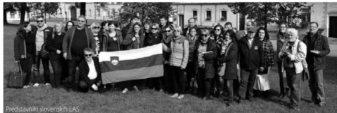
Predstavniki slovenskih LAS