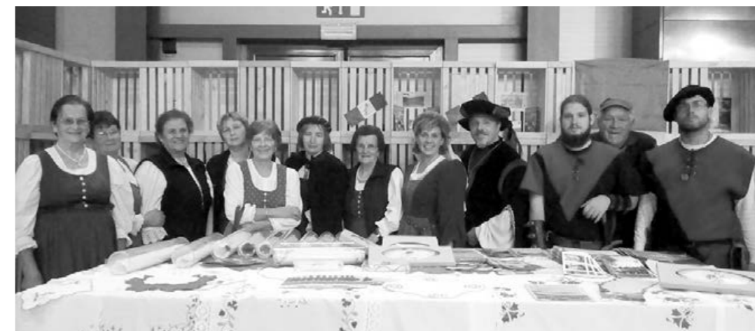
Utrinek s sejma