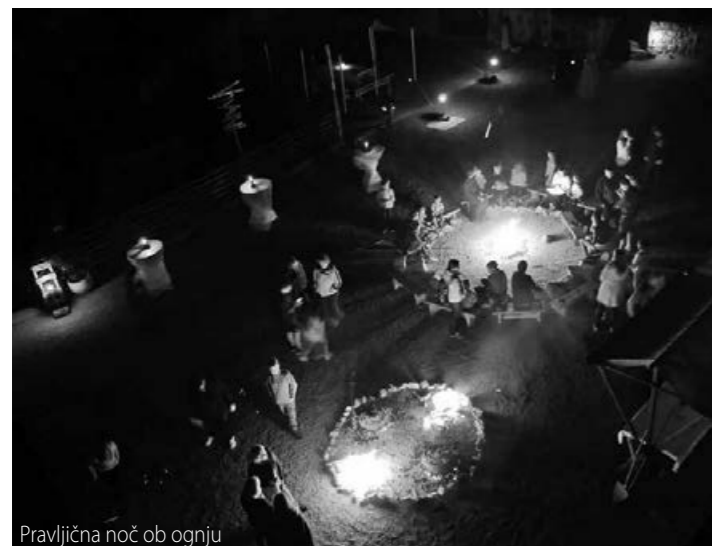
Pravljica noč ob ognju

Žužemberški grad, eden najslavnejših gradov na Slovenskem, je 24. septembra že šestič zaživel kot v pravljici, in to brez električnih svetil in druge uporabe električne energije.