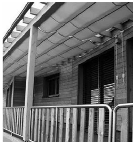
Primer projekta s podobno rešitvijo.