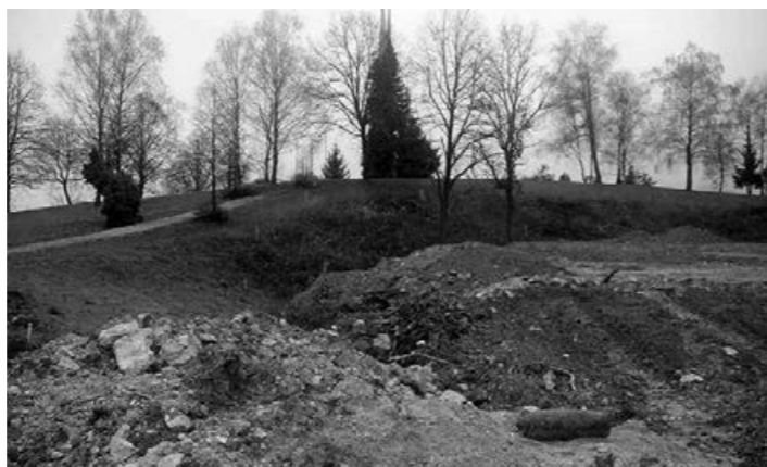
Angleška letalska bomba v bližini spomenika NOB na Cviblju