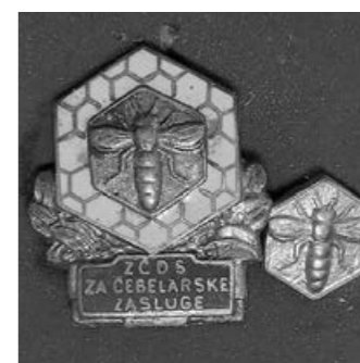
PRIZNANJA: red sv. Save in Janševo čebelarstvo

Konjerejsko društva Suha krajina želi vsem simpatizerjem, ljubiteljem in lastnikom konj vesele, blagoslovljene praznike ter SREČNO v 2017!